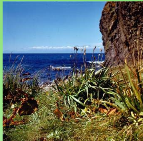
Вид на Кунаширский пролив, мыс Столбчатый, с ирисом щетинистым

30 сентября. Поездка к мысу Столбчатый. 17-й километр к югу от Южно-Курильска, побережье Кунаширского пролива. Человек десять с рыбокомбината поехали за грибами, это была суббота. И мы с ними. Время: с 9.40 до 17 часов. Высота вулкана Менделеева – 890 метров над уровнем моря. Я уже знал, что вулкан похож на спящую женщину. Тропа идёт вниз до горячего источника, где люди купаются, и даже варят местную горбушу. А оттуда ещё минут 15 до берега (Кунаширский пролив или Охотское море). Купался я два раза в море, где вода в небольшом заливчике защищена от волн. Вода солёная и не холодная, даже можно нырнуть. Нырять я с открытыми глазами. После этого третий раз купался в горячей ванне.