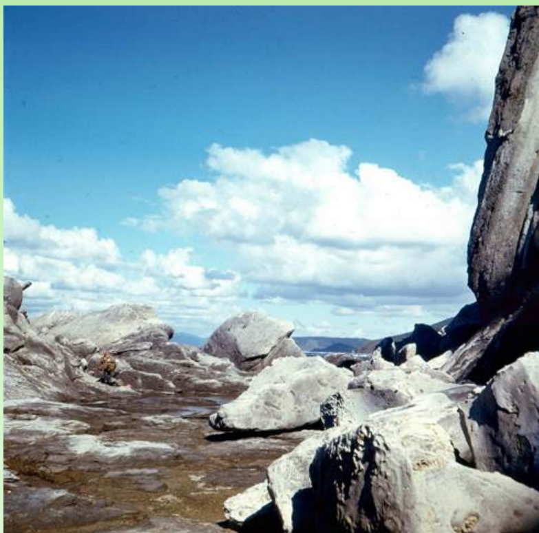
Мыс Алёхина, где утонул рюкзак