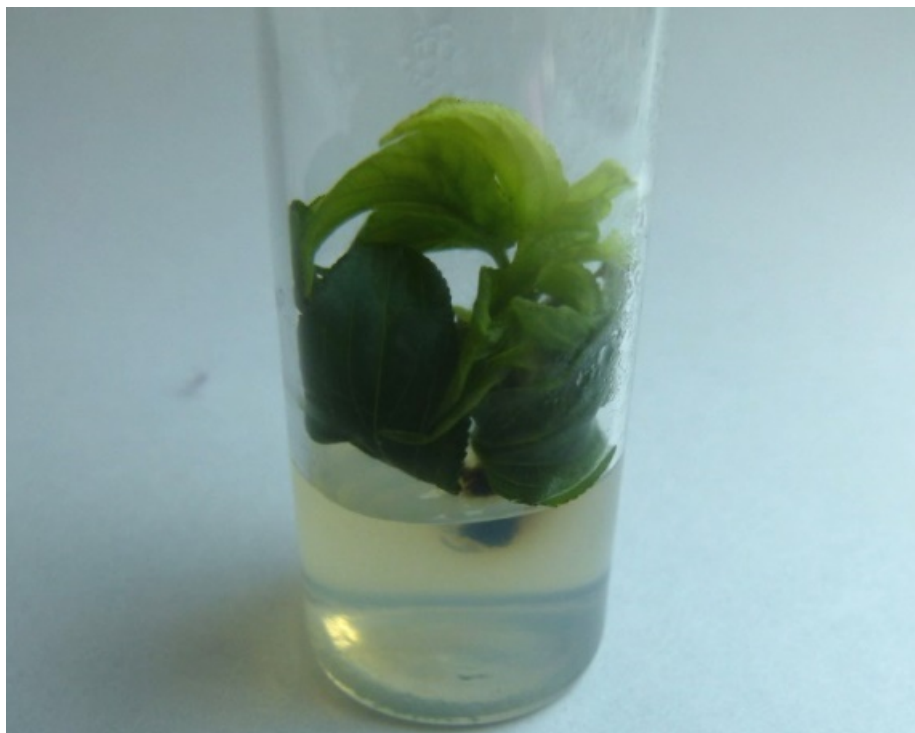
Рис. 3. Морфогенез R. diamantica in vitro .