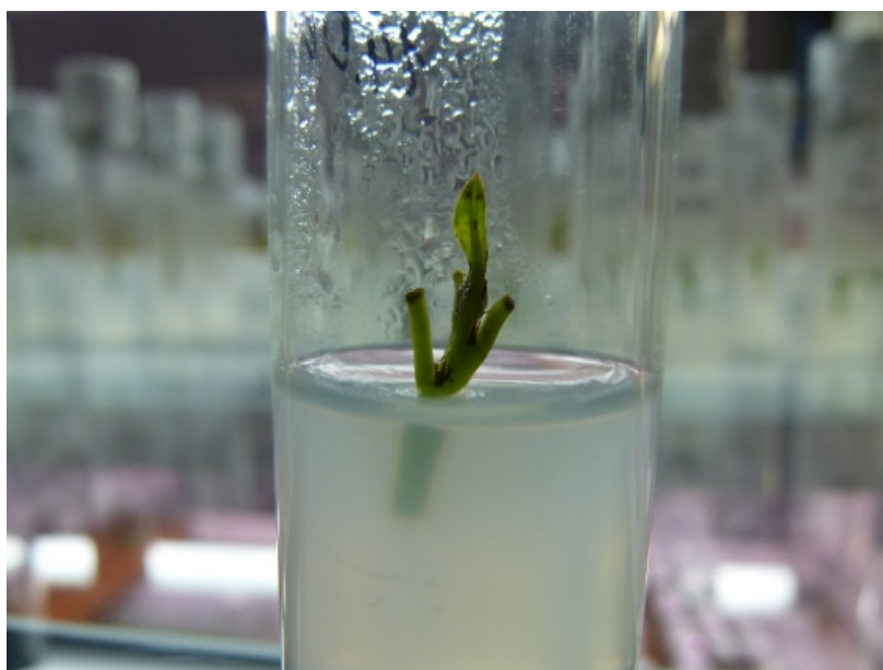
Рис. 1. Введение R. diamantica in vitro .

Полученный стерильный жизнеспособный материал высаживали на питательные среды Мурасиге и Скуга с различным содержанием регуляторов роста.