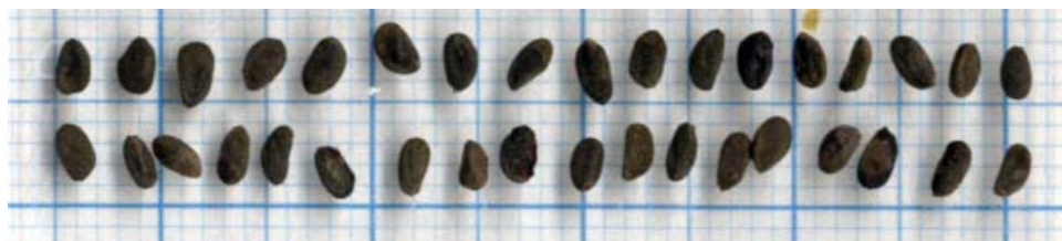
Рис. 2. Семена Lonicera tolmatchevii .