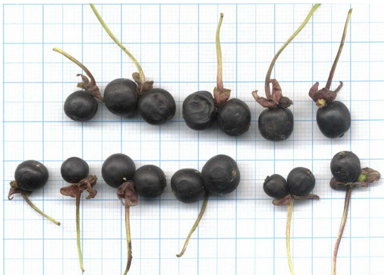
Рис. 1. Плоды Lonicera tolmatchevii в натуральную величину.