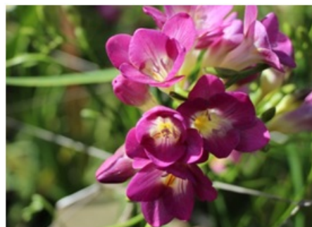
Рис. 9. Гибрид K-76-3/1 с простой формой околоцветника.

Fig. 9. Hybrid K-76-3/1 with a simple form of perianth.