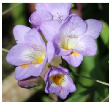
Рис. 6. Freesia refracta 'Blue Navy'.