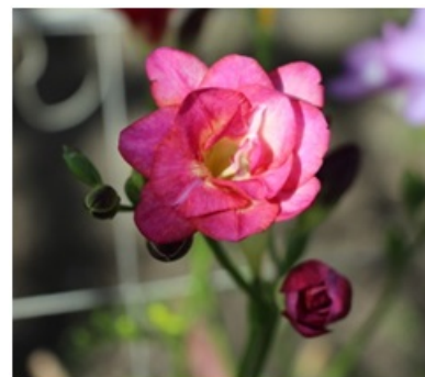
Рис. 5. Freesia refracta 'Пальмира'.