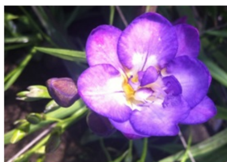
Рис. 11. Freesia refracta 'Blue Ocean' с полумахровой формой околоцветника.

Fig. 10. Freesia refracta 'Gabriel' with double-petalled form of perianth.