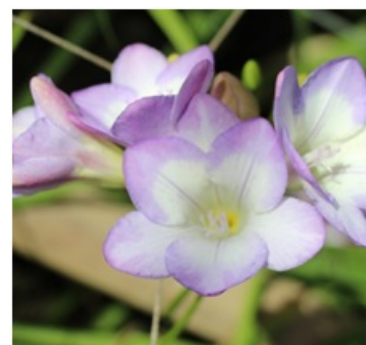
Рис. 7. Freesia refracta 'Чайка'.