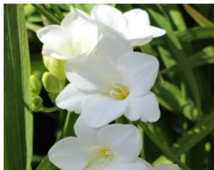
Рис. 2. Freesia refracta 'Athene'.