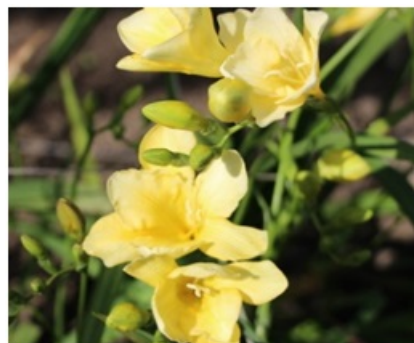
Рис. 4. Freesia refracta 'Golden River'.