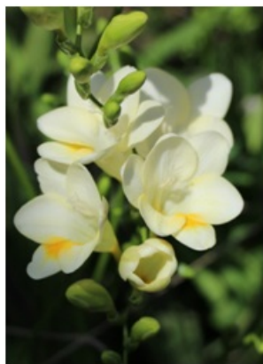
Рис. 8. Гибрид I-108-1.