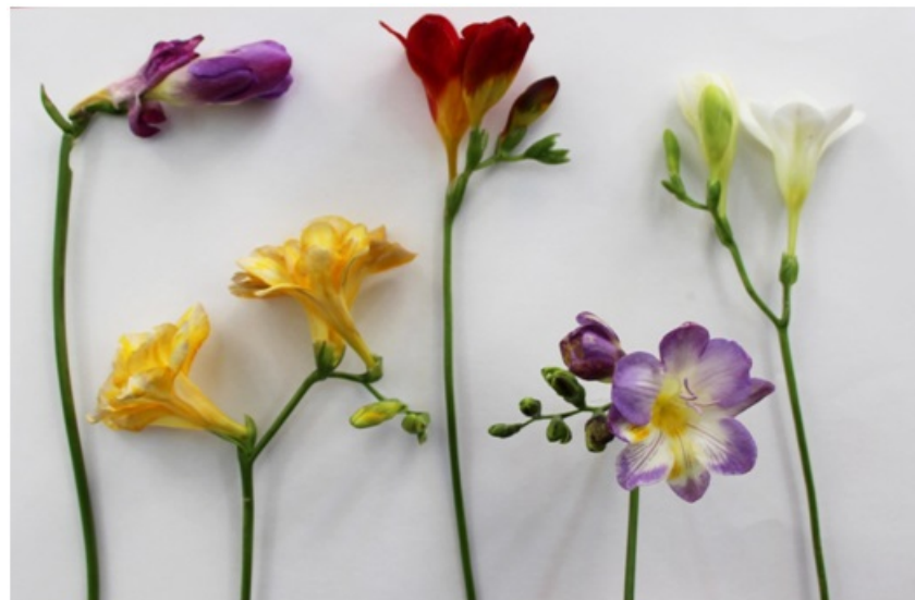
Рис. 12. Различные деформации цветоносов, соцветий и цветков фрезии, вызванные низкими температурами.

Культивирование фрезии на территории Сочи ведется в стеклянных теплицах с нерегулируемым микроклиматом. За зимний период 2016-2017 гг. температура в теплице дважды опускалась до -10^{\circ}\text{C} , что является губительным для растений фрезии, вызывает деформацию цветоносов, соцветий и отдельных цветков (рис.11).