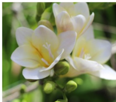
Рис. 3. Freesia refracta 'Мечта'.