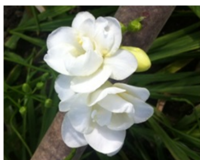
Рис. 10. Freesia refracta 'Gabriel' с махровой формой околоцветника.

Fig. 9. Hybrid K-76-3/1 with a simple form of perianth.