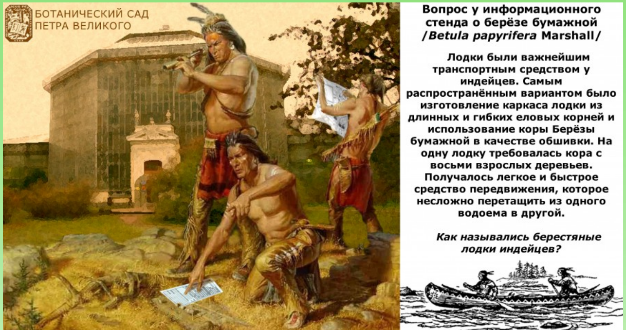
Рис. 1. Пример междисциплинарной содержательной части вопросов квеста.

примере вопроса из квеста «Иммигранты Нового света», посвященного растениям-переселенцам Северной и Южной Америки в коллекции Ботанического сада Петра Великого, традиционно проводимого в дни выставки флоксов, начиная с 2016 года (Рис. 1).