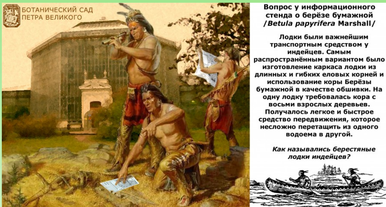
Рис. 1. Пример междисциплинарной содержательной части вопросов квеста.

аудиторию и перестают носить образовательный характер. Для максимального расширения возможного числа потенциальных участников в нашей практике мы в основном не ориентируемся на определённую возрастную группу посетителей. Задания квестов по парку-дендрарию имеют достаточно сложный характер и рассчитаны на семейное участие и использование интернета в поисках ответа на поставленные вопросы. Однако, при этом дополнительная информация в маршрутных листах излагается на максимально доступном обывателю языке и затрагивает разнообразные отрасли знаний, культуры и искусства, не ограничиваясь исключительно ботаникой. Междисциплинарность содержательной части заданий может быть проиллюстрирована на примере вопроса из квеста «Иммигранты Нового света», посвященного растениям-переселенцам Северной и Южной Америки в коллекции Ботанического сада Петра Великого, традиционно проводимого в дни выставки флоксов, начиная с 2016 года (Рис. 1).