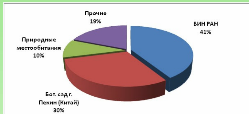
Рис. 7. Источники пополнения коллекции представителей родов Liriope и Ophiopogon в Субтропическом ботаническом саду Кубани (г. Сочи).

По результатам работы с представителями родов Liriope и Ophiopogon в составе коллекционных и декоративных насаждений СБСК были рекомендованы направления для использования в условиях региона и составлен перечень видов и форм, перспективных для культивирования. Так для создания газонных покрытий на затененных участках лучше прочих подходят Liriope graminifolia , Ophiopogon japonicus и его карликовая форма; для использования в качестве фоновых растений в составе декоративных насаждений пригодны практически все представители рассматриваемых родов, успешно прошедшие интродукционные испытания, а наибольший интерес представляют: L. exiliflora , L. koreana , L. graminifolia , L. minor , L. muscari , L. zhejiangensis , O. jaburan , O. japonicus , O. planiscapus и O. umbraticola . Отдельно стоит отметить возможность использования практически всех представителей рассматриваемых таксонов, интродуцированных в регионе, в контейнерной культуре. Также представляет интерес их культивирование в зимних садах, где при неблагоприятном световом режиме лучше себя проявляют типовые формы рода Ophiopogon .