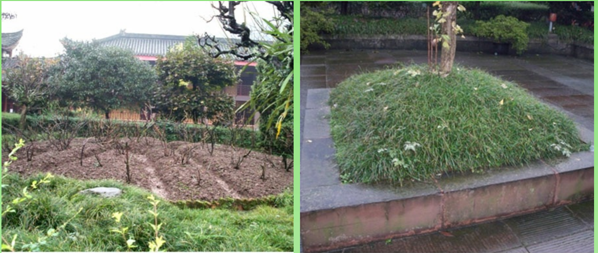
Рис. 1. Ophiopogon japonicus в озеленении (Китай, 2014 г.).