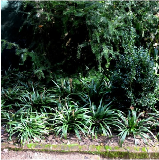
Рис. 2. Liriope muscari в садово-парковом озеленении (Испания, Барселона, 2015 г.).

Fig. 2. Liriope muscari in landscape architecture (Spain, Barcelona, 2015).