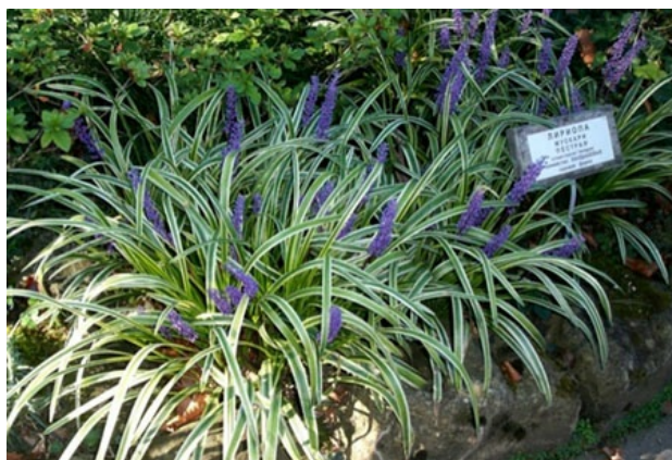
Рис. 5. Liriope muscari 'Variegata' в озеленении СБСК (Сочи, 2014).

Fig. 4. Ophiopogon japonicus in street composition (Sochi, 2015).