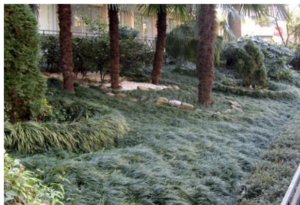
Рис. 4. Ophiopogon japonicus в городских насаждениях (Сочи, 2015).

Fig. 3. Ophiopogon planiscapus 'Nigrescens' in landart composition (London, 2012 г., electronic resource ).