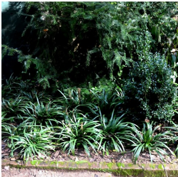
Рис. 2. Liriope muscari в садово-парковом озеленении (Испания, Барселона, 2015 г.).

Fig. 2. Liriope muscari in landscape architecture (Spain, Barcelona, 2015).