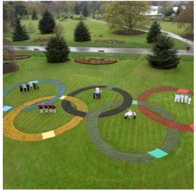
Рис. 3. Ophiopogon planiscapus 'Nigrescens' в композиции (Лондон, 2012 г., электронный ресурс ).

Fig. 2. Liriope muscari in landscape architecture (Spain, Barcelona, 2015).