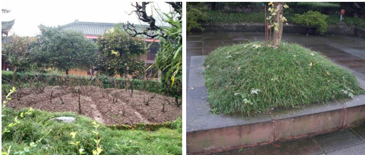
Рис. 1. Ophiopogon japonicus в озеленении (Китай, 2014 г.).