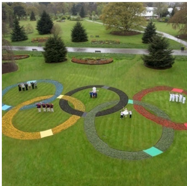
Рис. 3. Ophiopogon planiscapus 'Nigrescens' в композиции (Лондон, 2012 г., электронный ресурс ).

Fig. 2. Liriope muscari in landscape architecture (Spain, Barcelona, 2015, photo by N.A. Slepchenko).