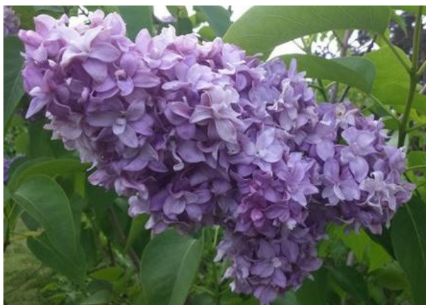
Рис. 2. Сорт 'Надежда'.

Fig. 1 Cultivar 'Pamyat o S. M. Kirove' from the Central Siberian Botanical Garden collection.