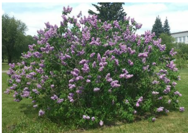
Рис. 1 Сорт 'Память о С. М. Кирове' в коллекции ЦСБС.