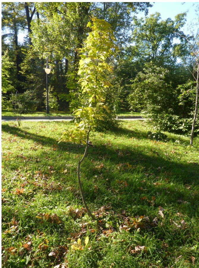
Рис. 1. Acer mayrii Schwer. f. pyramidale V.V. Byalt et Firsov forma nova в парке БИН РАН (уч. 90)

Fig. 1. Acer mayrii Schwer. f. pyramidale V.V. Byalt et Firsov forma nova in the park of Komarov Botanical Institute