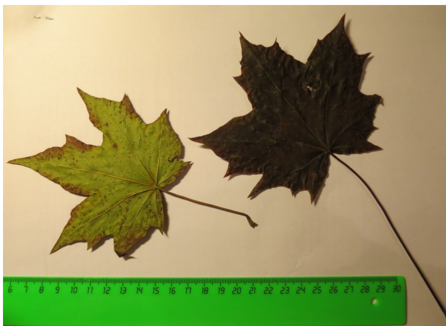
Рис. 2. Листья Acer platanoides L. f. atropurpureo-viridis V.V. Byalt et Firsov forma nova.

Holotypus (голотип): Russia, St. Petersburg, cultivated in the dendrological nursery of St. Petersburg botanical garden / Россия, г. Санкт-Петербург, культивируется в ботаническом саду Петра Великого БИН РАН в дендропитомнике. 18 X 2017, veg., Г.А. Фирсов, В.В. Бялт / G.A. Firsov, V.V. Byalt (holotypus – LE, isotypi 5 in LE, KFTA, LECB, WIR).