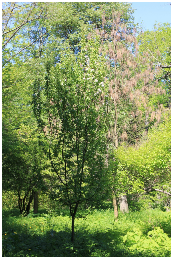
Рис. 5. Форма кроны Malus praecox (Pall.) Borkh. f. pyramidale V.V. Byalt et Firsov n. f.