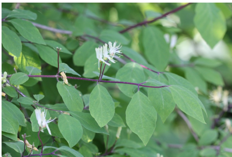
Рис. 6. Lonicera x zaitzevii V.V. Byalt, A. Byalt et Firsov, nothosp. nova в цветении

Holotypus (голотип): Россия, г. Санкт-Петербург, культивируется на дендропитомнике Санкт-Петербургского ботанического сада Петра Великого, гряда Ж-14. Экземпляр - кустарник 2,2 м выс., крона 3,25 x 2.8 м. – Russia, St. Petersburg, cultivated in the dendrological nursery of St. Petersburg Peter the Great botanical garden (row Zh-14). 13 VI 2017, fl., Г.А. Фирсов, В.В. Бялт / G.A. Firsov, V.V. Byalt (holotypus – LE, isotypi - 5 in LE, LECB, KFTA, WIR).