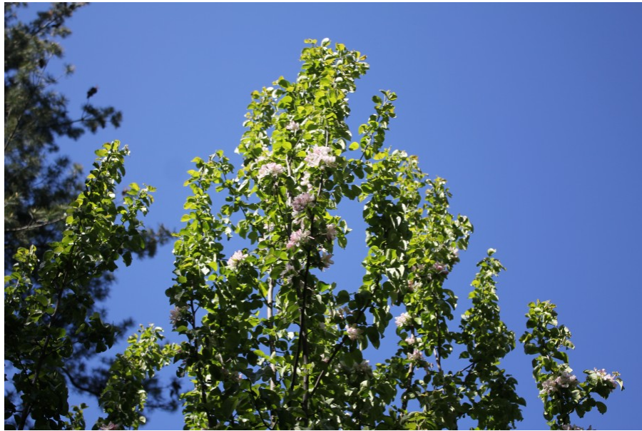
Рис. 4. Malus praecox (Pall.) Borkh. f. pyramidale V.V. Byalt et Firsov n. f. в цветении