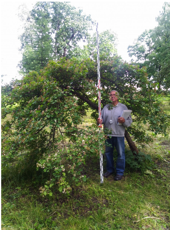
Рис. 3. Crataegus nigra Waldst. et Kit. f. arcuato-pendula V.V. Byalt et Firsov forma nova в парке БИН РАН