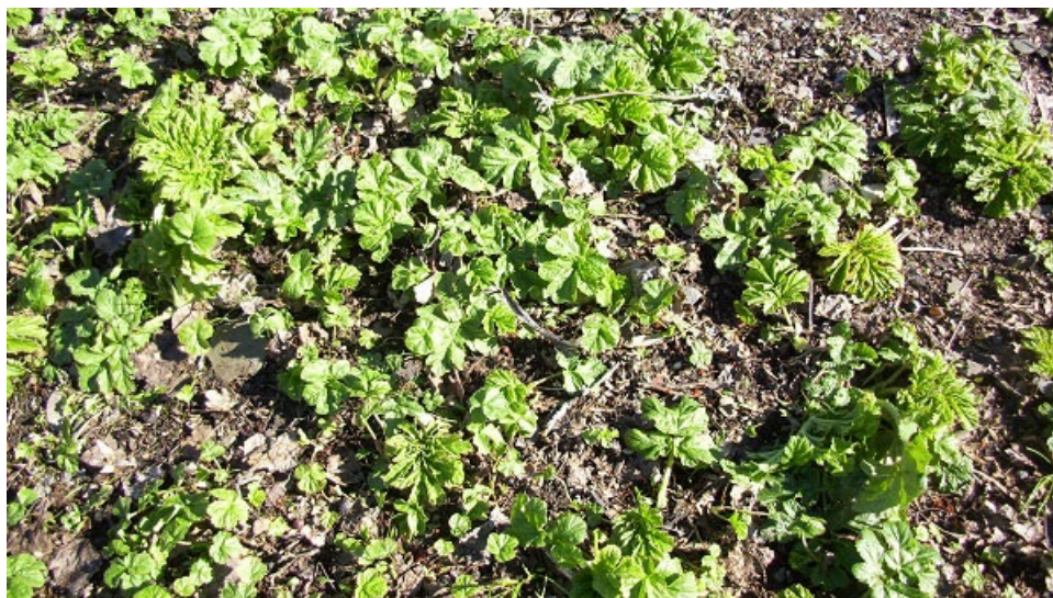
Рис. 1. Вид участка массового произрастания борщевика Сосновского весной. 16.05.2017.

Участки, где летом находятся труднопроходимые заросли борщевика, рано весной представляют собой открытые пространства (рис. 1). Ко времени заложения пробных площадей в апреле почва уже освободилась от снега, началось отрастание листьев двух- и многолетних растений, а семена находились на первых стадиях прорастания.