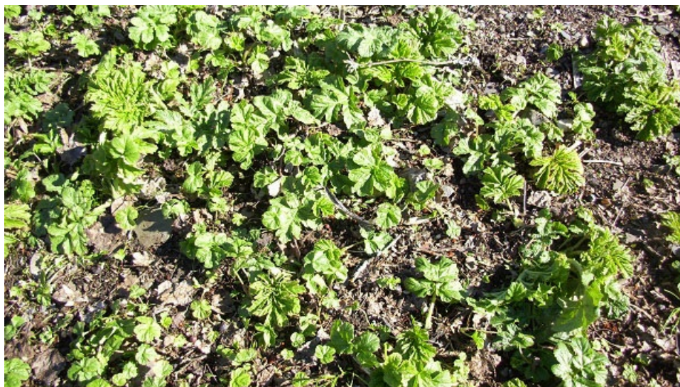
Рис. 1. Вид участка массового произрастания борщевика Сосновского весной. 16.05.2017.

Участки, где летом находятся труднопроходимые заросли борщевика, рано весной представляют собой открытые пространства (рис. 1). Ко времени заложения пробных площадей в апреле почва уже освободилась от снега, началось отрастание листьев двух- и многолетних растений, а семена находились на первых стадиях прорастания.