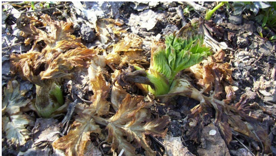
Рис. 5. Отрастание новых листьев у многолетнего растения через неделю после обработки растения горячей водой. 24.05.2017.

воздействие на растения горячей воды, продолжалось в течение пяти недель. Отрастание листьев после еженедельной термической обработки прекратилось только через несколько месяцев – к середине июля. Начиная с этого времени ни новые листья, ни генеративные побеги у обработанных горячей водой многолетних растений не появились.