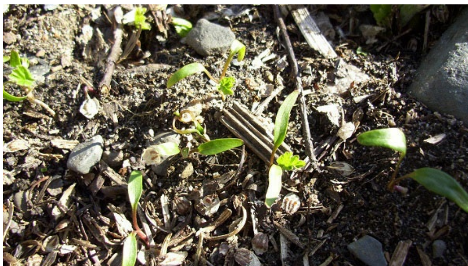
Рис. 2. Всходы борщевика Сосновского. 10.05.2017.

Площади для обработки всходов были заложены в местах их массового развития (рис. 2). На площадках были подрезаны подземные органы и срезаны отрастающие листья многолетних растений. Подсчет всходов проводили непосредственно перед обработкой.