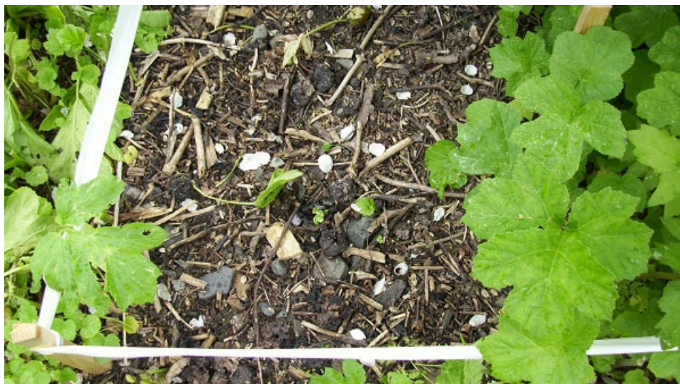
Рис. 4. Опытная площадь через месяц после последней термической обработки всходов. 26.06.2017.