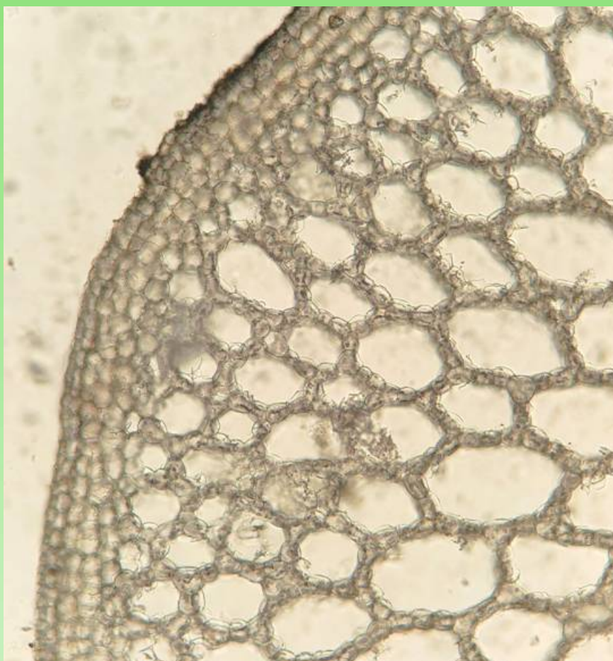
Рис. 4. Аэренхима в корневище Nymphoides peltata (увеличение 10х).

При выполнении данного исследования таких элементов механической ткани в придаточных корнях N. peltata не обнаружено.