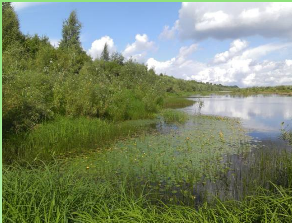
Рис. 2. Популяция Nymphoides peltata у берега реки Северная Двина.

Fig. 2. The population of Nymphoides peltata near the bank of the Severnaya Dvina River.