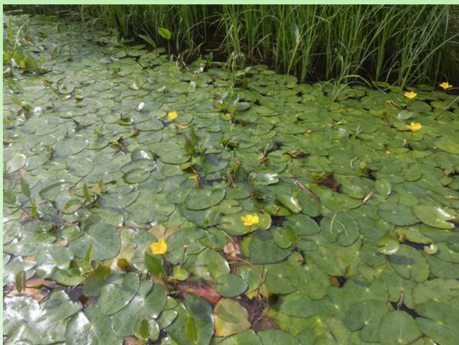
Рис. 3. Цветение Nymphoides peltata .

Fig. 2. The population of Nymphoides peltata near the bank of the Severnaya Dvina River.