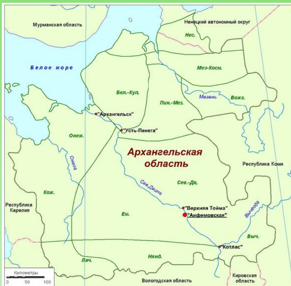
Рис. 1. Местонахождение ценопопуляции Nymphoides peltata (деревня Анфимовская, Архангельская область, Россия).

Флористические районы: Нес. – Несский; Мез.–Косм. – Мезенско-Косминский; Бел.–Кул. – Беломорско-Кулойский; Пин.–Мез. – Пинежско-Мезенский; Вожг. – Вожгорский; Онеж. – Онежский; Кож. – Кожозерский; Ем. – Емецкий; Сев.–Дв. – Северо-Двинский; Лач. – Лачский; Нянд. – Няндомский; Выч. – Вычегодский.