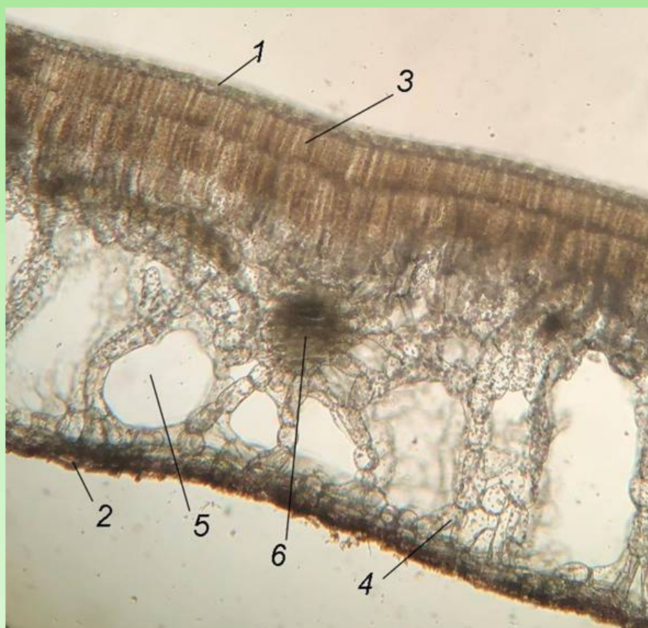
Рис. 5. Поперечный срез листа Nymphaeoides peltata (увеличение 4х).

Листья дорзовентрального типа (рис. 5). Палисадный мезофилл расположен на адаксиальной стороне, губчатый – на абаксиальной. Толщина листовых пластинок составляет 1046.0 \pm 11.5 мкм. Они плотные и покрытые тонкой кутикулой. Верхняя эпидерма с многочисленными устьицами и состоит из одного слоя клеток с извилистыми стенками.