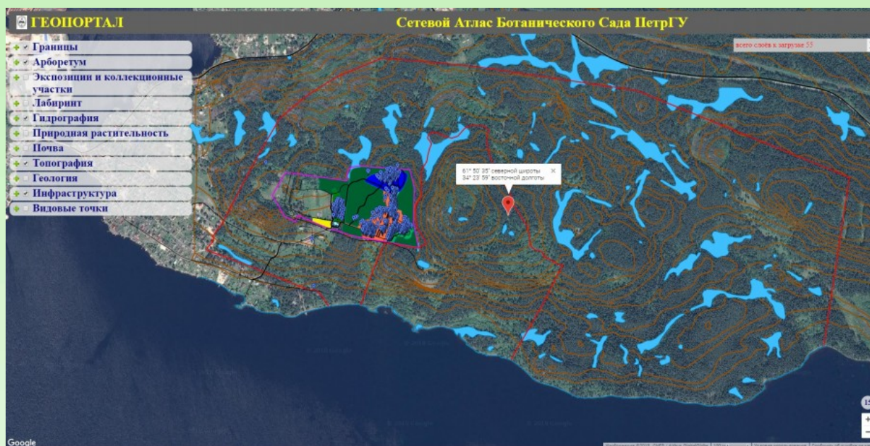
Рис. 1. Интерфейс веб-ГИС БС ПетрГУ.

После завершения тестирования ГИС была перемещена на сервер БС ПетрГУ и стала доступна всем пользователям. Пример интерфейса веб-ГИС БС представлен на рисунке 1.