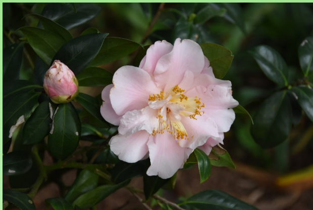
Camellia japonica 'Show Time'.

В парке организовано много мест для отдыха, пассивного созерцания рукотворных ландшафтов, для знакомства с разнообразием замечательных растений - камелий.