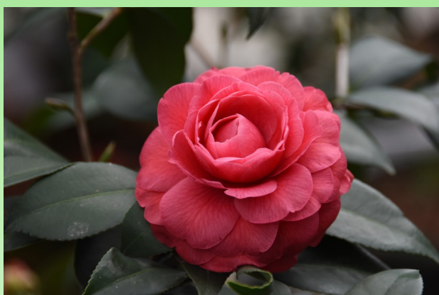
Camellia japonica 'Red Bird'.