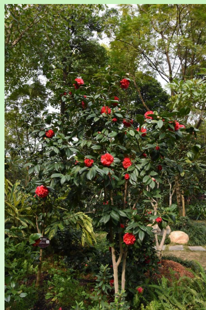
Camellia in the Nanning Golden Camellia Park.