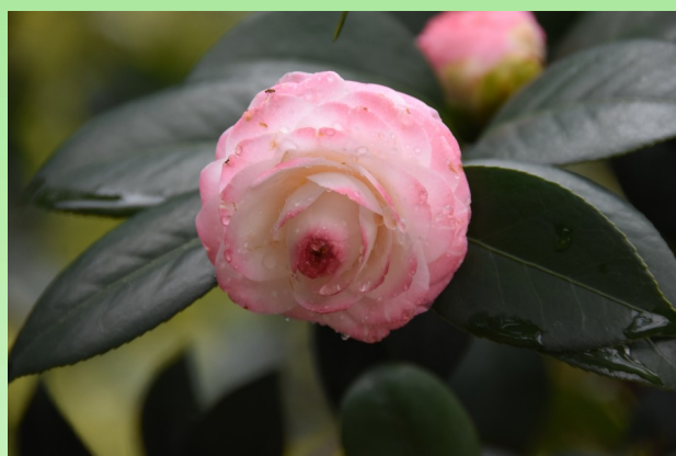
Camellia japonica 'Grace Albritton'.

В 1981 году в этом парке был создан первый Национальный генетический банк жёлтых камелий, которые в природе встречаются преимущественно в провинции Гуанси (Китай) и во Вьетнаме. И в настоящее время эта коллекция живых растений является самой крупной в мире и насчитывает 3100 растений, представляющих 33 вида (важно учесть, что в мире всего 46 видов камелий с жёлтыми цветками). В 2010 году были созданы два новых гибридных сорта жёлтой камелии 'Dongyue' и 'Jinbei Danxin', которые были успешно зарегистрированы Комитетом номенклатуры Китая.