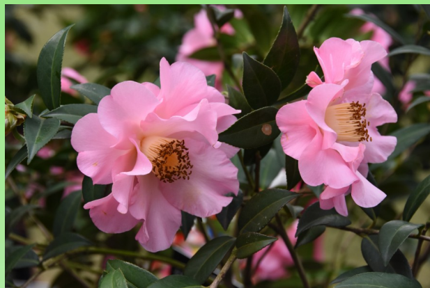
Camellia japonica 'Taylor Perfection'.

Парк Nanning Golden Camellia Park расположен в восточной части города Наньин (провинция Гуанси), рядом с Южным озером и открыт для посетителей в декабре 1995 года; он занимает площадь 23,8 га, из которых 17,7 га (74,5 %) занимают растения. На момент открытия в парке было высажено всего 8 160 экземпляров растений камелий. В настоящее время (почти через 25 лет) в парке насчитывается уже 13 577 экземпляров растений и представлено 517 сортов камелий. Основными являются сорта от таких видов как Camellia japonica L., Camellia oleifera Abel, Camellia sasanqua Thunb.