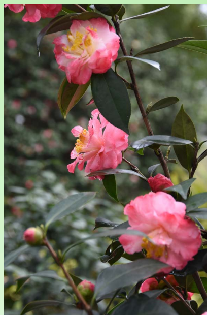
Camellia japonica 'Spring Daze'.

Ежегодно на территории парка проводят выставки селекционных достижений в области создания новых сортов камелий, чаще всего созданных на основе камелии японской. Этот парк был разработан для множества функций, включая осмотр парковых достопримечательностей, досуг для горожан, развлечения для посетителей с детьми, а также научные исследования. С момента основания парка важнейшими являются охрана и производство посадочного материала не только редких видов, но и перспективных форм и сортов разных видов камелий. Ежегодно с ноября по апрель число посетителей парка, желающих