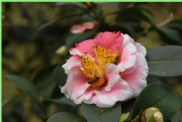
Camellia 'Scented Sun'.

Камелии, удивительные и замечательные растения, которым в мире уделяют очень много внимания. В Китае же – это одни из «императорских», привилегированных, любимых растений. Мировое общество камелий (International Camellia Society) уже почти 50 лет выпускает специализированный международный журнал (International Camellia Journal), посвященный камелиям. А в Китае, в городе Наньин, существует удивительный, фантастический сад камелий.