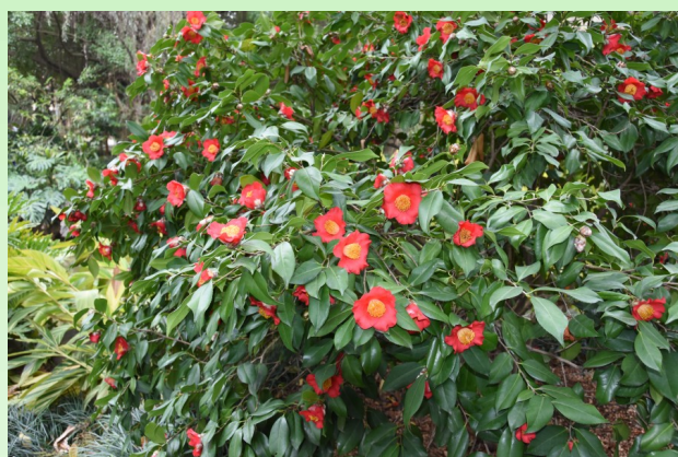
Camellia japonica 'Yilanjiao'.

The path in honor of the best cultivator - Japanese Yilanjiao camellias.