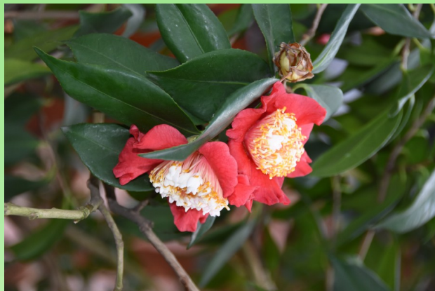
Camellia japonica 'Kumagai Nagoya'.