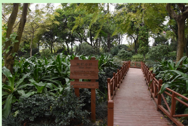
Дорожка лучшего культивара - камелии японской Yilanjiao.

Регион вокруг города Наньнин является родиной «золотой» камелии. А точнее – двух редких и наиболее красивоцветущих видов – Camellia chrysantha (Hu) Tuyma и Camellia nitidissima C. W. Chi, которые иногда относят в синонимы друг другу. А вот созданный уникальный парк – Nanning Golden Camellia Park (Наньнинский парк Золотых Камелий) является ключевым звеном сохранения, изучения и разведения золотых камелий в Китае. В мире камелий – Золотая камелия ( Camellia chrysantha w/или Camellia nitidissima ) является самой ценной и значимой, известной также как «Королева камелий». Именно этот вид находится под угрозой исчезновения (статус EN) и подлежит охране во флоре Китая на национальном уровне. На базе этого парка в 2010 был заложен и уже в 2011 году открыт Национальный центр сохранения и изучения «золотых» камелий.