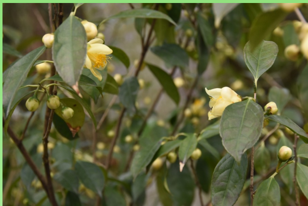
Camellia chrysantha (Hu) Tuyama.

являются одними из десяти любимых и традиционных растений.