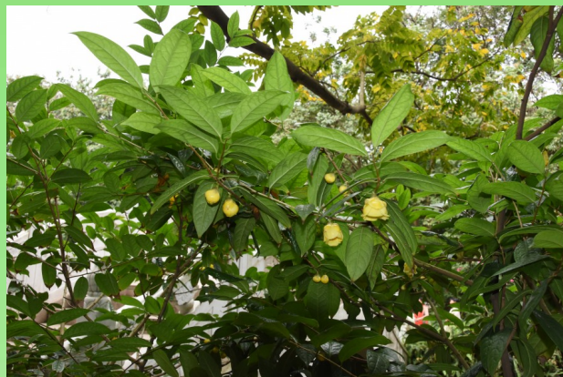
Camellia nitidissima C. W. Chi.