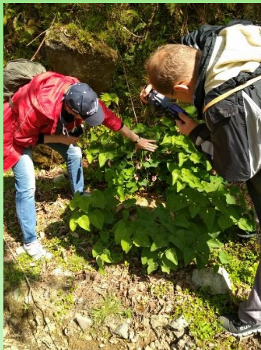
Рис. 5. Aristolochia pontica Lam.