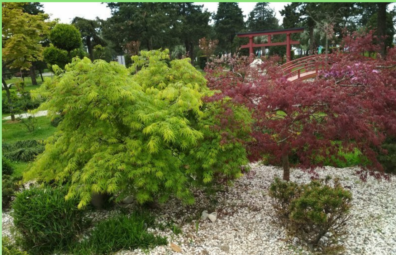
Рис. 8. Приморский бульвар. Участок «Японский сад».