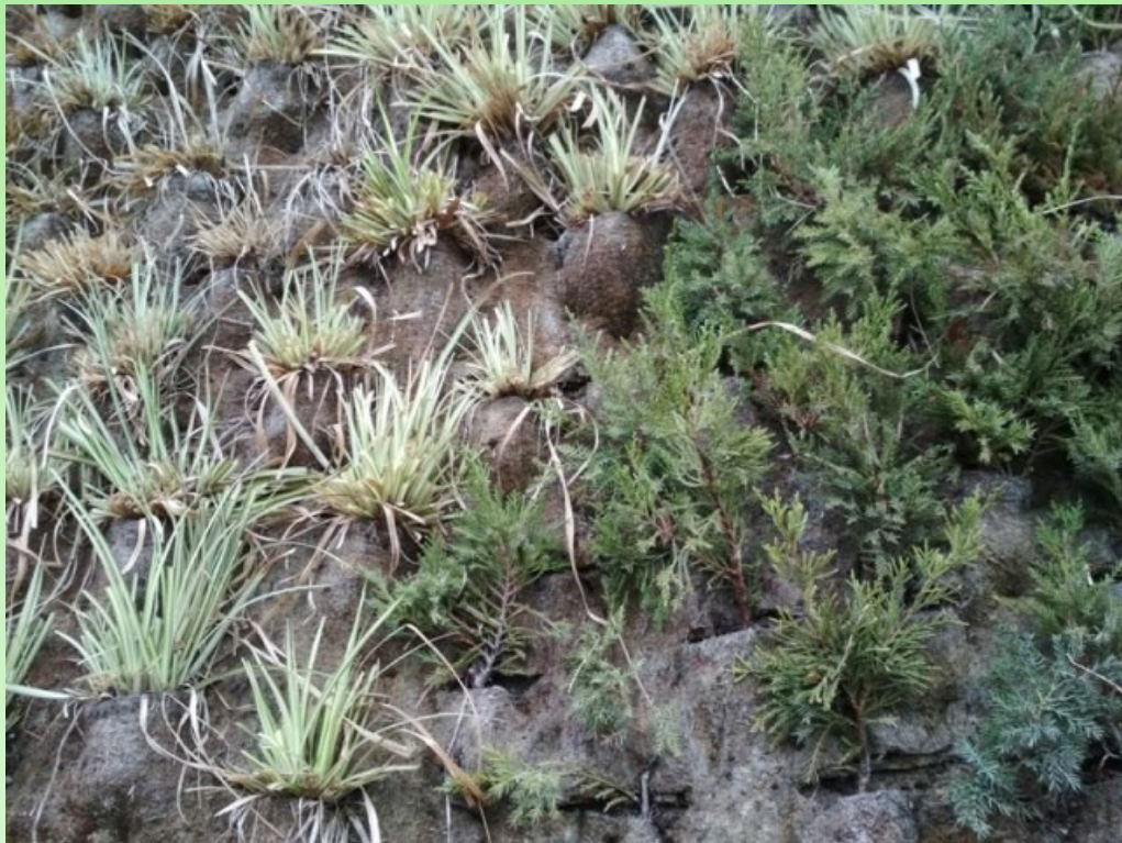
Рис. 13. Панно из живых растений (город Тбилиси).

В центре Тбилиси создан современный парк, отражающий тенденции современной ландшафтной архитектуры: различный тип мощения, МАФы, привитые и стриженные формы (рис. 10). Особое внимание уделено сочетанию построек и окружающих их растений. Основу рекреационной нагрузки берет на себя Ботанический сад и пригородные лесопарковые массивы. Набережные представлены в виде аллейных посадок. В целом, отсутствует единая система озеленения.