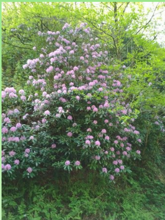
Рис. 4. Rhododendron ponticum L.

к побережью местности. Благодаря обильным осадкам, выпадающим на склонах Мтиралы (до 4520 мм в год), территория парка характеризуется многообразием редких растений — здесь можно найти образцы 284 видов, среди которых эндемических – 16, а понтийский дуб, береза Медведева, рододендрон Унгерна, колхидский самшит, клекачка колхидская, тис, каштан обыкновенный, лещина колхидская, эпигея ползучая (редчайшее растение Аджарии) и др. занесены в Красную книгу. Среди природных растений, представленных в парке, наибольший интерес для интродукции представляют различные виды папоротников, камнеломки, примулы, осоки и весеннецветущие эфемероиды (рис. 3-5).