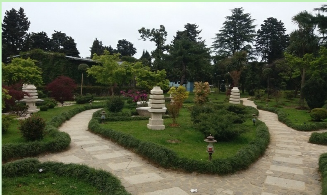
Рис. 9. Стриженные формы древесно-кустарниковых растений.