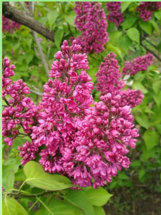
Рис. 7. Селекционный сеянец сирени.