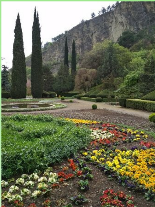
Рис. 6. Экспозиция «Партер».

В рамках обмена коллекционными фондами нами были переданы 5 сортов роз (живые растения), 7 образцов сортов хвойных растений (черенки) и 28 образцов семян. Для пополнения коллекционного фонда ГБС РАН было получено 8 образцов: Anemone multifida Poir., Macleaya microcarpa (Maxim.) Fedde, Rosa banksiaea L. 2 формы, Veronica sp., Vinca major L. 'Variegata', Veronica sp., Ranunculus cappadocicus Willd.