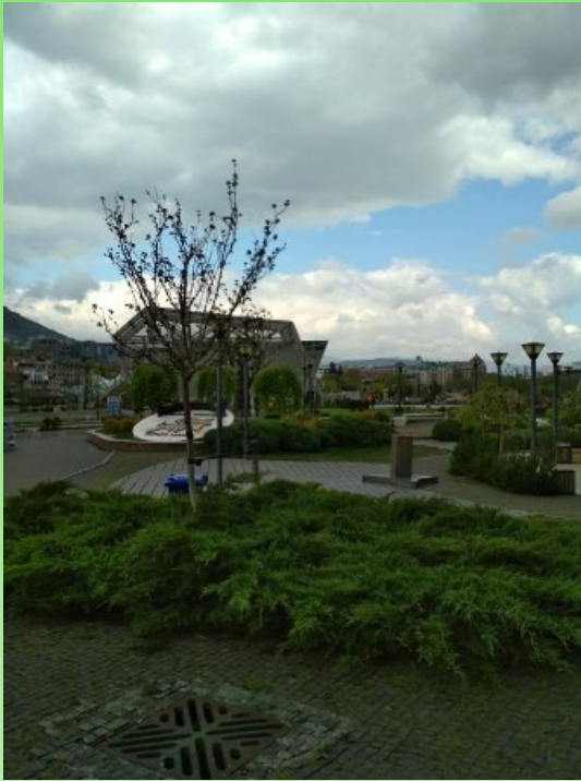
Рис. 10. Современный парк на набережной реки Кура, город Тбилиси.