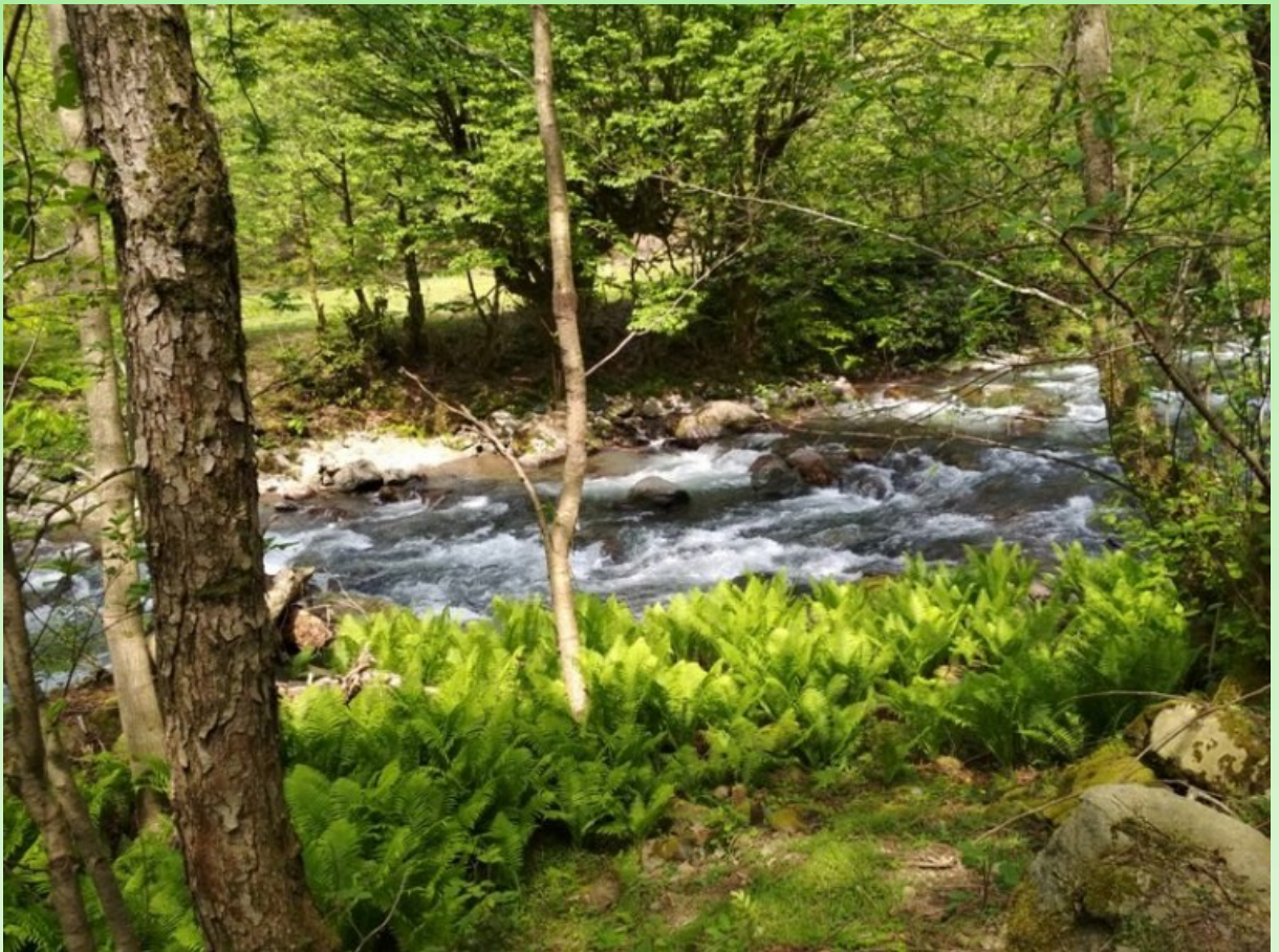
Рис. 3. Национальный парк Мтирала.

Территория Аджарии представляет собой сложный комплекс средне- и высокогорья, горно-лесных и влажно- субтропических ландшафтных категорий, имеющих тесную взаимосвязь, и, в то же время, отличающихся самобытностью и строгой индивидуальностью. В зависимости от географического расположения, климатических условий, растительного покрова и ландшафтного разнообразия территория делится на 2 части – приморский край Аджарии и внутригорная Аджария. Приморская полоса характеризуется влажным субтропическим климатом, а внутригорный край – климатом, схожим с сухим средиземноморским субтропическим. В приморской части расположен Ботанический сад. Главные особенности аджарского климата определяются, с одной стороны, близостью Черного моря и, с другой стороны, рельефными особенностями. Море оказывает прямое влияние на температуру воздуха, понижает высокую температуру лета и привносит тепло в зимние холода, а характер рельефа предопределяет сложные микроклиматические условия и вертикальную зональность климата. При интродукции растений природной флоры Аджарии в среднюю полосу России наиболее перспективным считаем использование травянистых видов, произрастающих в Приморской части Аджарии, характерные для лиственных лесов (бук, граб с подлеском из рододендрона понтийского, лещины, самшит и другие).