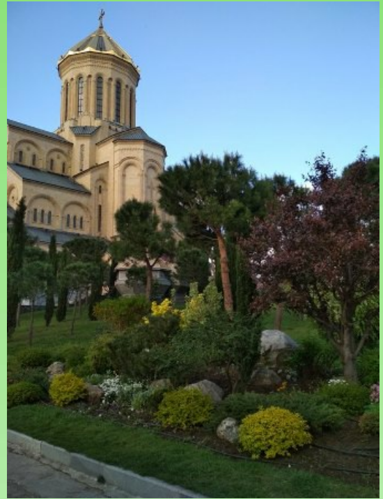
Рис. 11. Озеленение вокруг храма Цминда Самеба, город Тбилиси.