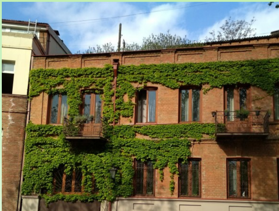
Рис. 12. Вертикальное озеленение (город Тбилиси).