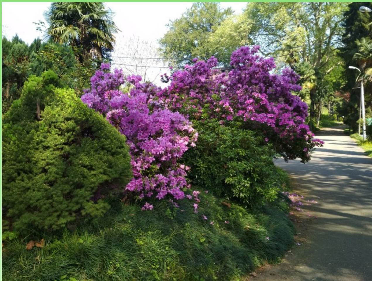
Рис. 2. Рододендроны в Батумском ботаническом саду.