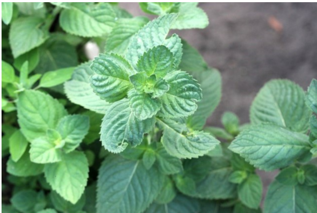
Рис. 4. Mentha x dumetorum Schult. культивируется на огороде в хут. Шакин.