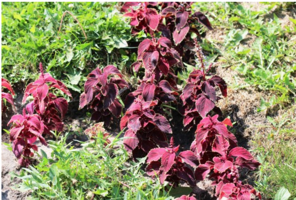
Рис. 8. Plectranthus scutellarioides (L.) R. Br. на цветнике в ст. Кумылженской.

По Нижнему Хопру культивируется в качестве декоративного однолетника (Рис. 8). Обычно высаживается на лето в вазонах и кашпо, иногда также выращивается на клумбах и альпийских горках. Имеется большое количество пестролистных садовых форм и сортов, которые используются для создания ярких комбинированных цветников.