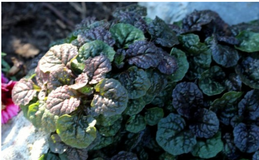
Рис. 2. Ajuga reptans 'Black Scallop' культивируется на альпийской горке в хут. Шакин.

Fig. 2. Ajuga reptans 'Black Scallop' is cultivated on a alpine hill in the village Shakin.