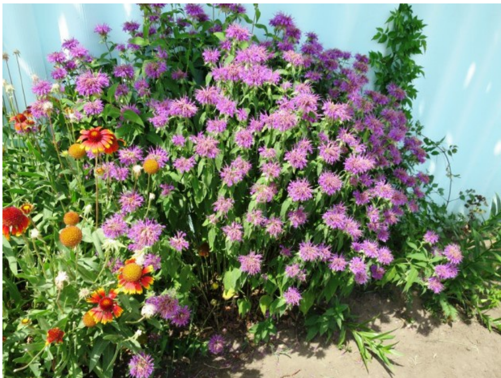
Рис. 5. Monarda fistulosa L. на цветнике около забора в ст. Кумылженской.

В культуре в европейской России наиболее распространены два вида: M. fistulosa , M. didyma L., и, реже, M. citriodora Cerv. ex Lag. На территории ППНХ нами достоверно обнаружен только один вид – M. fistulosa , который изредка культивируется в некоторых станицах (ст. Кумылженская, Букановская, Алексеевская). По всей вероятности, на Нижнем Хопре могут встретиться и другие приведенные выше виды (в первую очередь M. didyma ). Указанные виды довольно часто плохо различают, в связи с этим мы приводим здесь ключ для их определения, составленный по нескольким источникам (Cleason, Cronquist, 1963; Steyermark, 1981; Горлачёва, 2009).