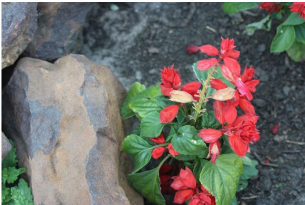
Рис. 10. Salvia splendens Sellow ex Nees на горке в хут. Шакин.