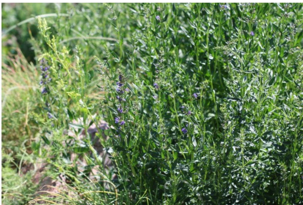
Рис. 3. Hyssopus officinalis L. на огороде в хут. Помалинский Алексеевского района.

Fig. 2. Ajuga reptans 'Black Scallop' is cultivated on a alpine hill in the village Shakin.