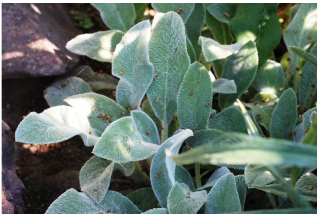
Рис. 11. Stachys byzantina K. Koch на альпийской горке в хут. Шакин.

Изредка культивируется на территории НХ в качестве декоративного растения в частных садах в цветниках и на альпийских горках. Например, мы наблюдали это растение в саду на альпийской гоке в хуторе Шакин (Рис. 11).