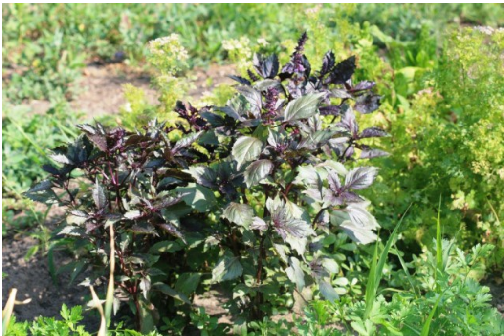
Рис. 7. Ocimum basilicum L. выращивается на огороде в ст. Букановская.