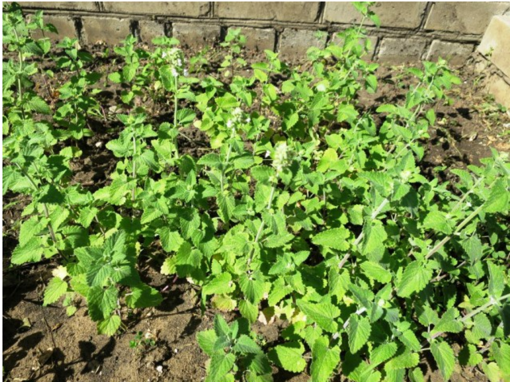
Рис. 6. Nepeta cataria L. культивируется около автостанции в ст. Кумылженской.