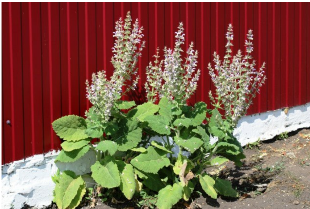
Рис. 9. Salvia sclarea L., одичавшая около забора в хут. Шакин Кумылженского района.