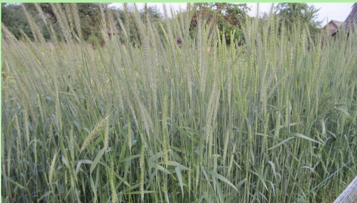
Рис. 6. Пшеница спельта на участке Телеханского центра детского творчества.

Fig. 5. Wheat « Vysokalitovka » and its grains grown on the site of the Telehany center for children's creativity.