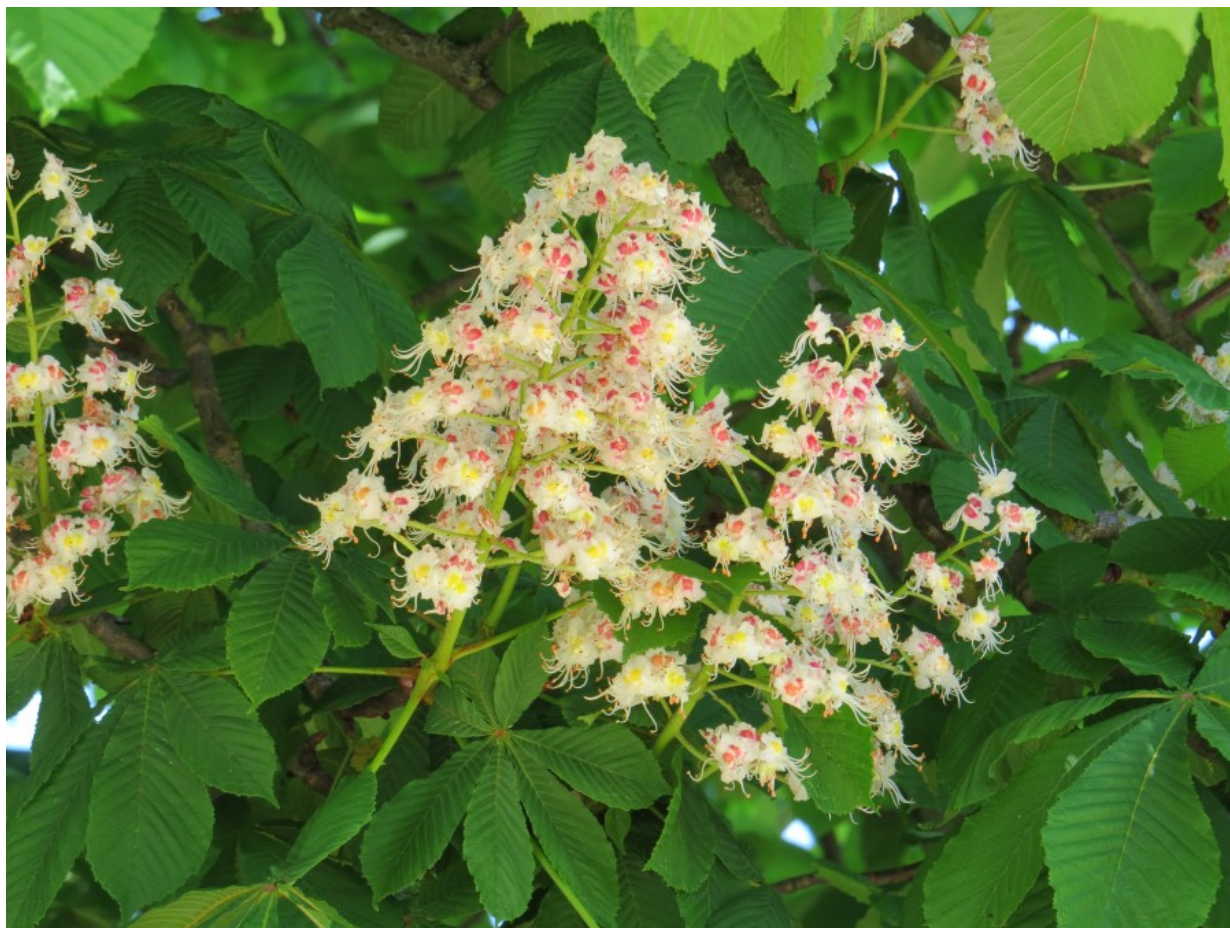
Рис. 4. Конский каштан обыкновенный.