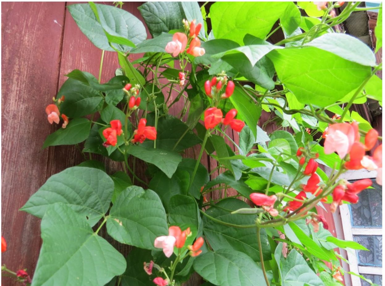
Рис. 2. Местный сортобразец фасоли огненно-красной в вертикальном озеленении.

Встречалась во многих хозяйствах, где выращивалась как пищевое и декоративное растение. На Телеханщине называлась «тычковой хвасоляй», поскольку этот вид имеет длинный выющийся стебель и требует опоры. Долгое время фасоль огненно-красная оставалась единственным травянистым декоративным растением, используемым в вертикальном озеленении (рис. 2).