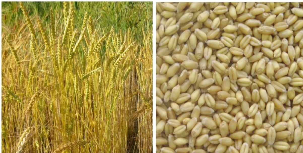
Рис. 5. Пшеница «Высокалітовка» и её зерновки, выращенные на участке Телеханского центра детского творчества.