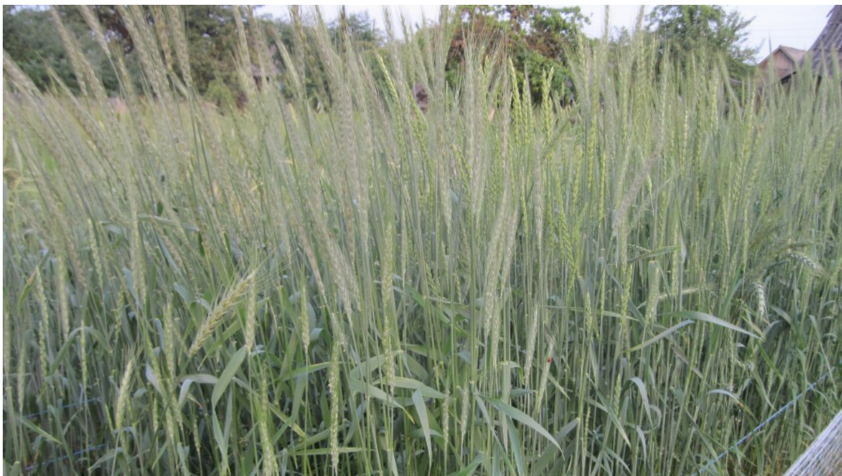
Рис. 6. Пшеница спельта на участке Телеханского центра детского творчества.