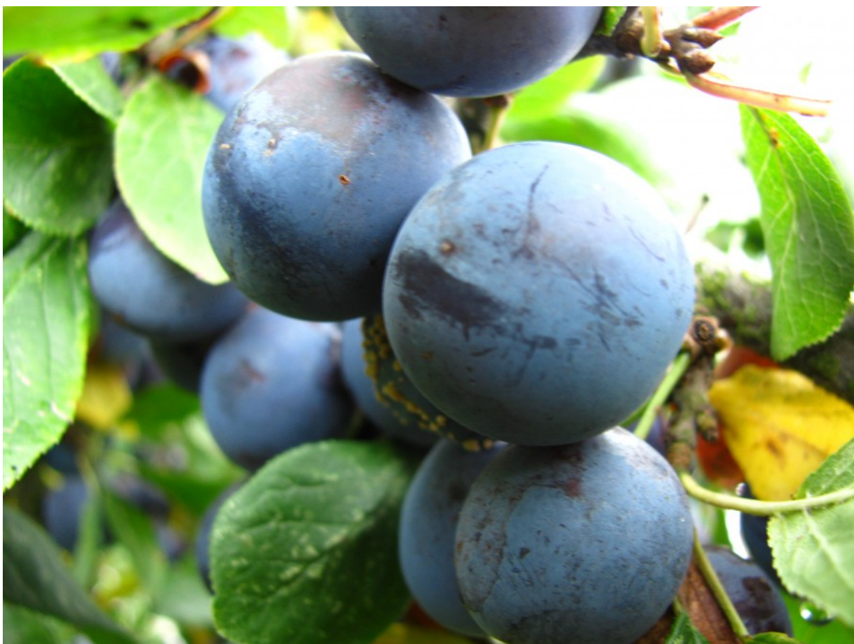
Рис. 3. Старинный сорт сливы домашней.

Встречалась в садах очень часто. Более широко был распространён сорт с небольшими плодами синего цвета, который довольно часто встречается в садах и сегодня. В одичавшем виде растёт также на месте бывших усадеб и хуторов (рис. 3).