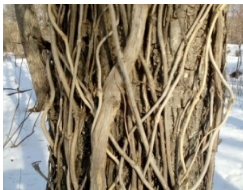
Рис. 12. Кампсис укореняющийся ( Campsis radicans ).

Снежноягодник белый - невысокий листопадный кустарник высотой до 1.5 м (Баженов, Лысиков, Сапелин, 2011). В начале мая всё растение покрывается небольшими розовыми цветками, а к сентябрю на нём появляются необычные белые плоды, похожие на градинки. Ягоды могут достигать диаметра 1 см и так же, как и цветки, собираются в плотные кисти. Куст становится как бы заснеженным, за это и получил своё название. Этим великолепием можно любоваться вплоть до весны.