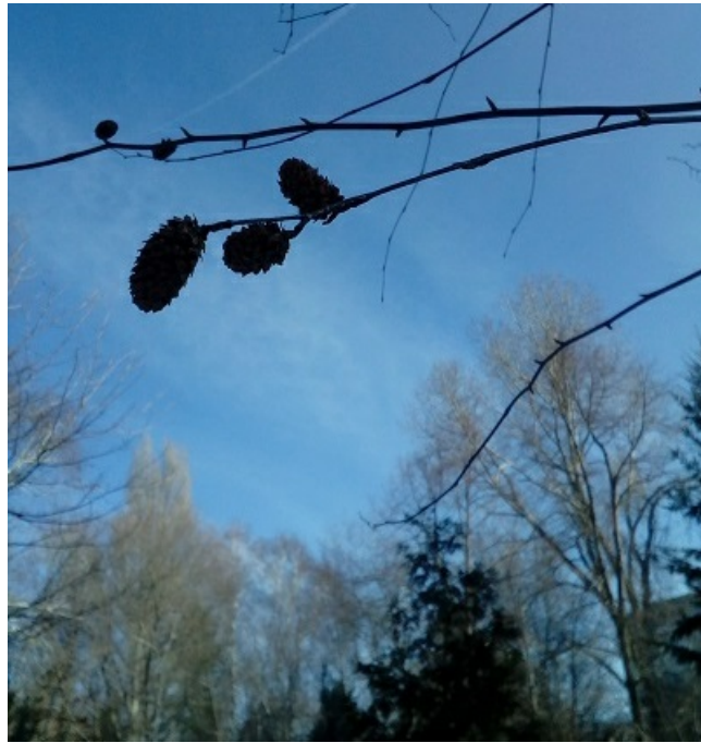
Рис. 7. Берёза вишнёвая ( Betula lenta ). Серёжки.