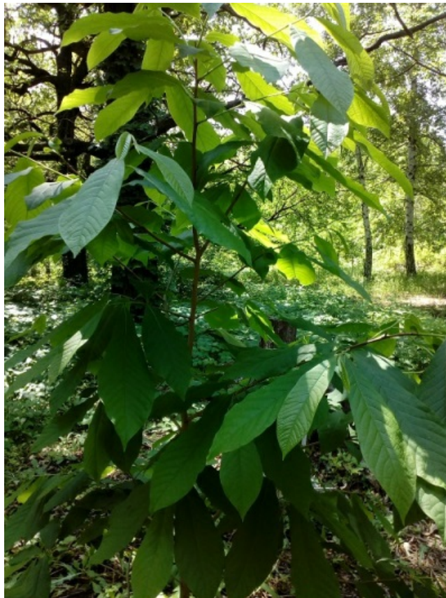
Рис. 9. Азими́на трехлопа́стная ( Asimina triloba ).

Поистине необычное южное дерево, которое отлично себя чувствует в нашем ботаническом саду - это азимина трехлопастная ( Asimina triloba (L.) Dunal) (рис. 9). Родиной этого замечательного растения считается южная часть Канады.