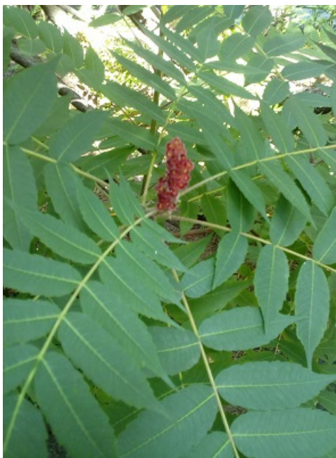
Рис. 4. Листья и завязь плода сумаха оленерогого.