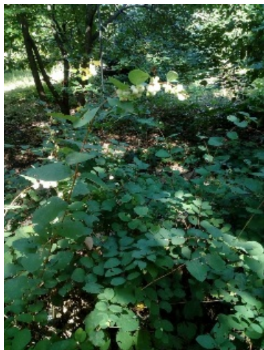
Рис. 10 Снежноягодник белый ( Symphoricarpos albus ) летом.

Fig. 10. Common snowberry ( Symphoricarpos albus ) in summer.