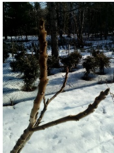
Fig. 6. Staghorn sumac 'Tiger's eye' ( Rhus typhina 'Bailtiger') in winter.