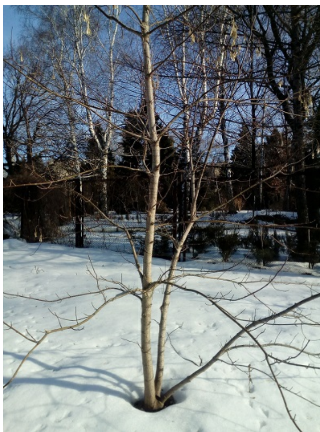
Рис. 1. Клён ясенелистный золотистый ( Acer negundo 'Auratum').

В учебно-научном центре "Ботанический сад Саратовского государственного университета" постоянно пополняется коллекция растений Северной Америки. Многие растения достаточно хорошо акклиматизировались к природным условиям Саратовской области. Одним из таких растений является клён ясенелистный золотистый ( Acer negundo L. 'Auratum') (рис. 1).