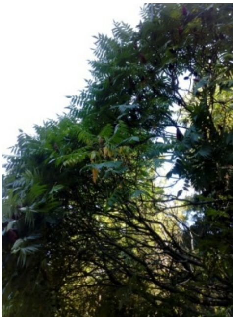
Рис. 3. Сумах оленерогий ( Rhus typhina ).