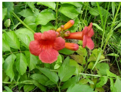
Рис. 13. Кампсис укореняющийся ( Campsis radicans ). Цветки.

Fig. 12. Trumpet vine ( Campsis radicans ).