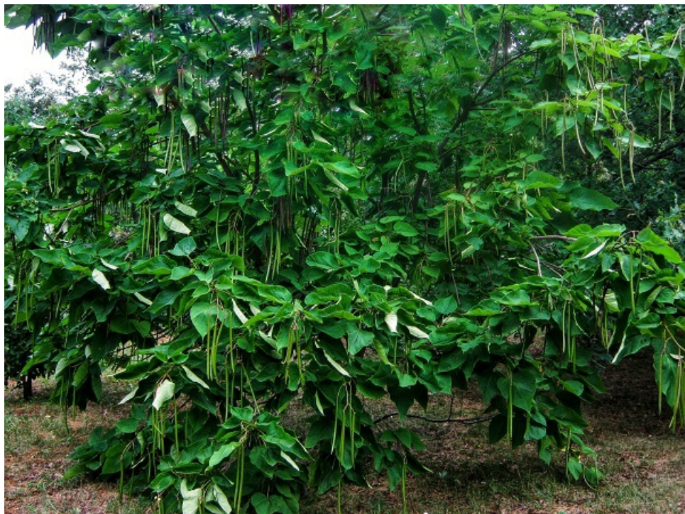
Рис. 8. Кatalпа бигнониевидная ( Catalpa bignonioides ).