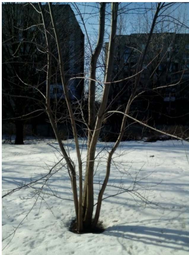
Рис. 2. Клён серебристый ( Acer saccharinum ).

Так как на родине это дерево произрастает на заболоченных местах и по берегам рек, то летом требуется обильный полив. И всё же клён серебристый хорошо приспособился к нашим климатическим условиям.