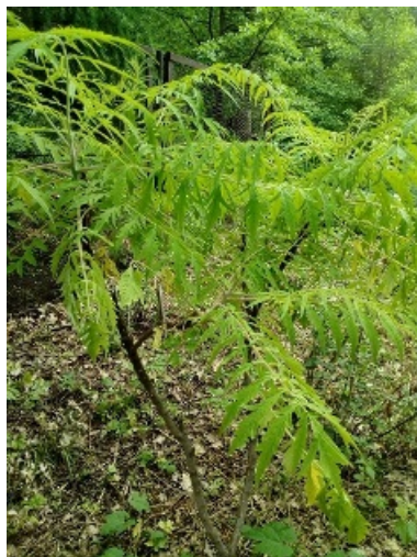
Рис. 5. Сумах оленерогий 'Тигринный глаз' ( Rhus typhina 'Bailtiger') летом.

( Anacardiaceae ), правда, пока только в единственном экземпляре - это сумах оленерогий 'Тигринный глаз' ( Rhus typhina 'Bailtiger') (рис. 5-6). Он отличается от обычного красивой расцветкой листьев. Они у него золотисто-зелёные. Наше деревце совсем молодое (трехлетнее), поэтому на зиму укрывается опилками.