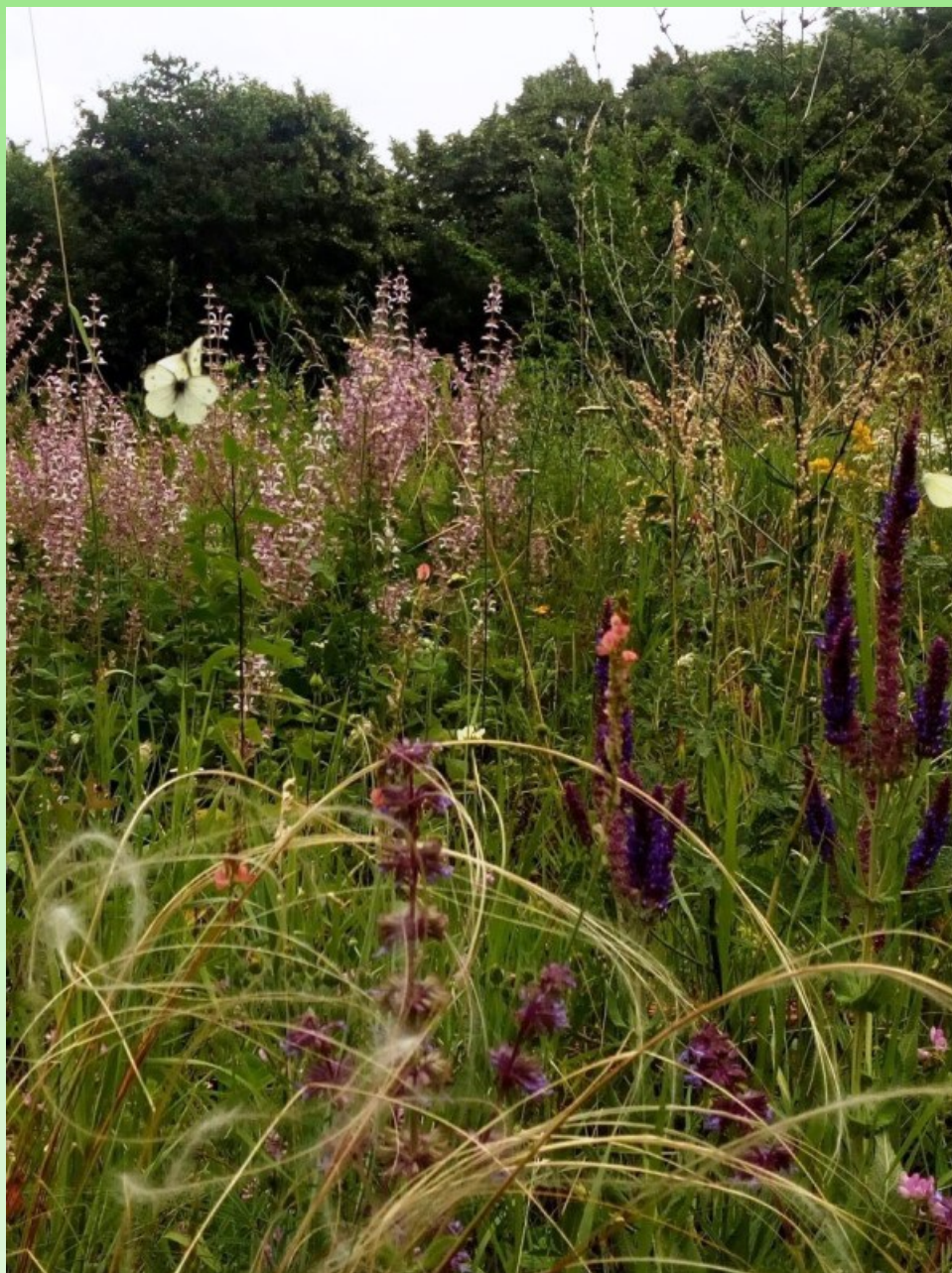
Рис. 3. Посадки в природном стиле в Перкальском арборетуме.

Событие «Сад для всех», акцентирующее внимание экскурсантов на разнообразии местных растений и вопросах их охраны, проводится на участке с посадками в природном стиле, который был заложен в 2015 году на территории около 100 м 2 и включает в себя 140 видов растений. Посадки представляют собой сочетание пересаженного дерна степного растительного сообщества и отдельных видов из разных областей происхождения, но из сходных местообитаний (рис. 3).