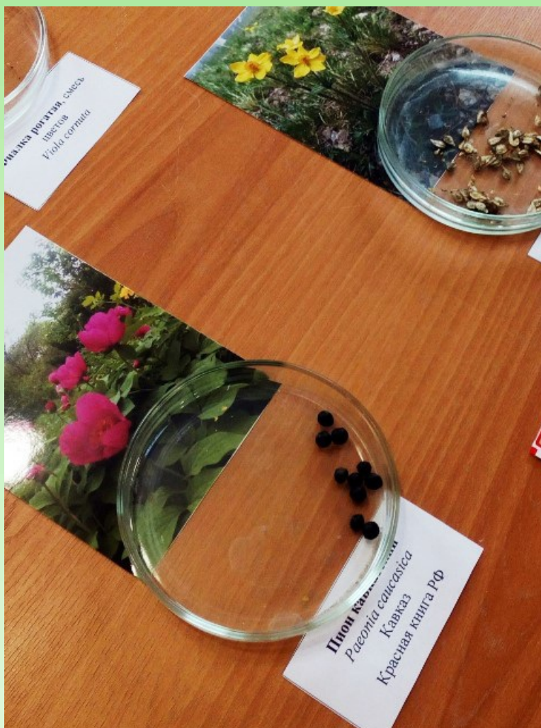
Рис. 2. Мастер-класс по посеву семян.

В ходе проведения тематической экскурсии, посвященной раннецветущей флоре, посетители знакомятся с коллекцией луковичных растений Кавказа, большинство из которых внесены в Красную книгу региона или РФ. На примере данных растений объясняется важность семенного размножения для сохранения вида и поддержания его генетического разнообразия, так как именно раннецветущие растения чаще всего становятся объектами сбора на букеты (рис. 1).