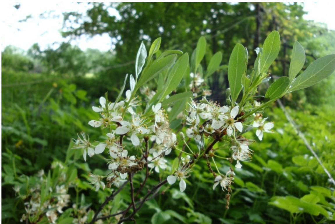
Рис. 5. Вишня карликовая, территория Главного ботанического сада имени Н. В. Цицина РАН.