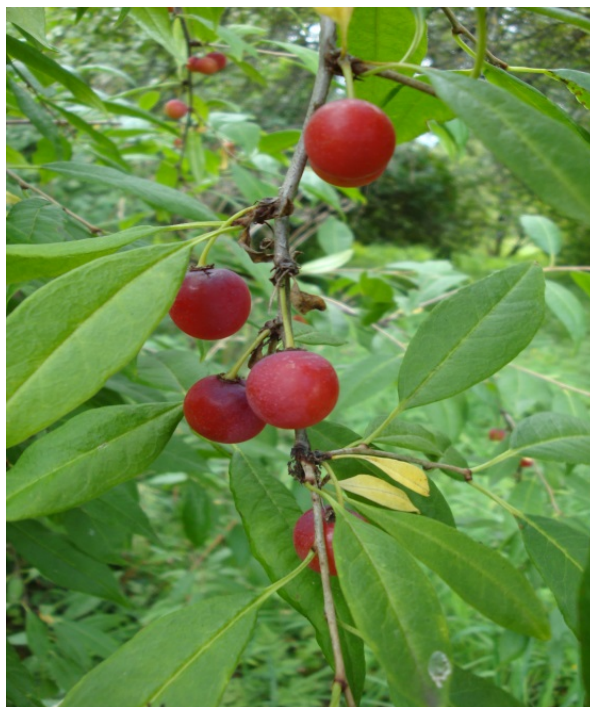
Рис. 3. Принсепия китайская, территория Главного ботанического сада имени Н. В. Цицина РАН.

Принсепия китайская (происхождение – семена получены из Алма-Аты) выращивается в экспозиции 'Дикие сородичи плодовых и ягодных растений' с 1965 г. (Горбунов и др., 2011).