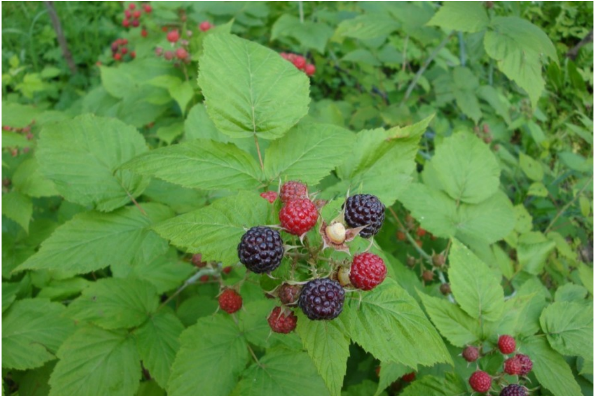
Рис. 8. Малина черная, территория Главного ботанического сада имени Н. В. Цицина РАН.