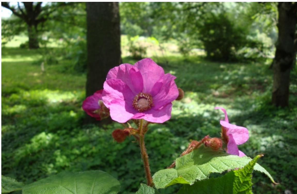
Рис. 7. Малина душистая, территория Главного ботанического сада имени Н. В. Цицина РАН.