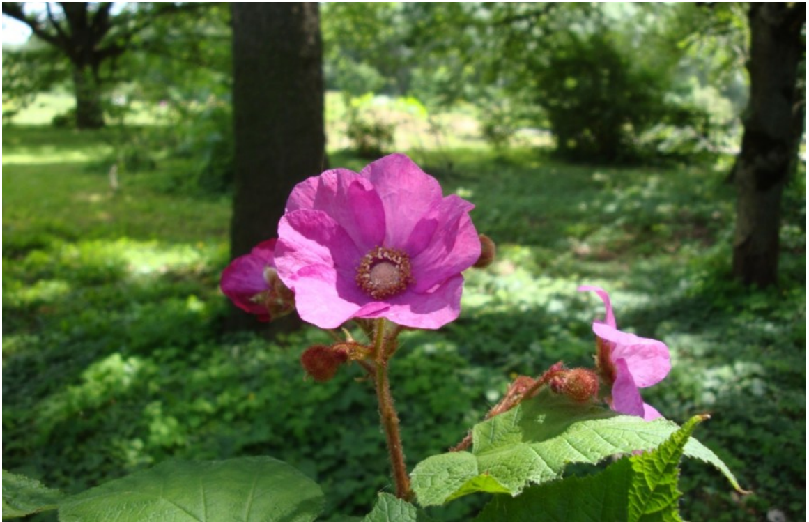
Рис. 7. Малина душистая, территория Главного ботанического сада имени Н. В. Цицина РАН.