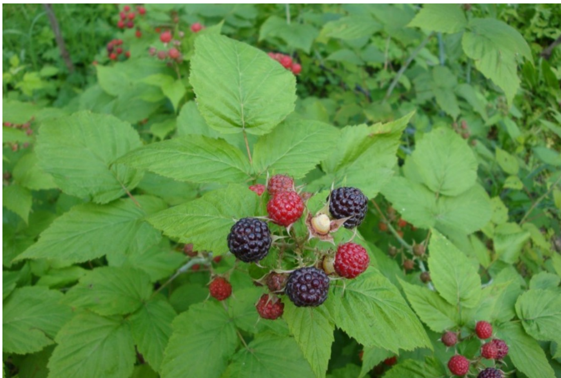
Рис. 8. Малина черная, территория Главного ботанического сада имени Н. В. Цицина РАН.