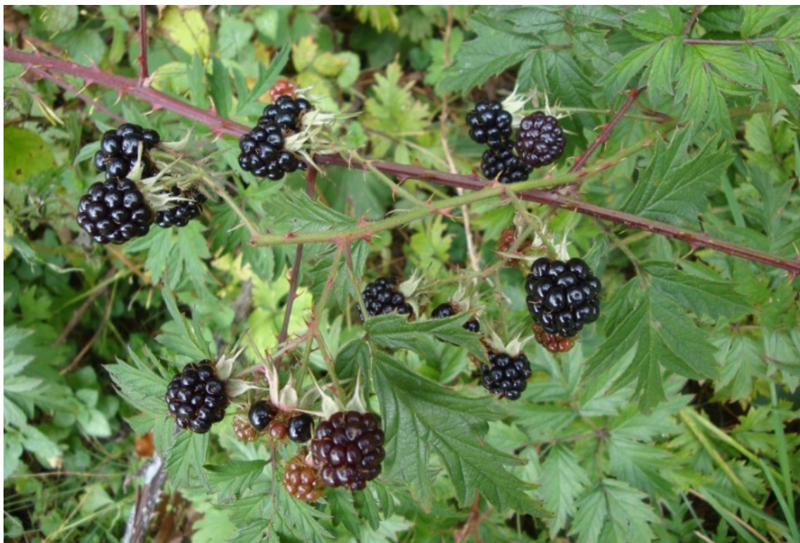
Рис. 9. Ежевика разрезная, территория Главного ботанического сада имени Н. В. Цицина РАН.