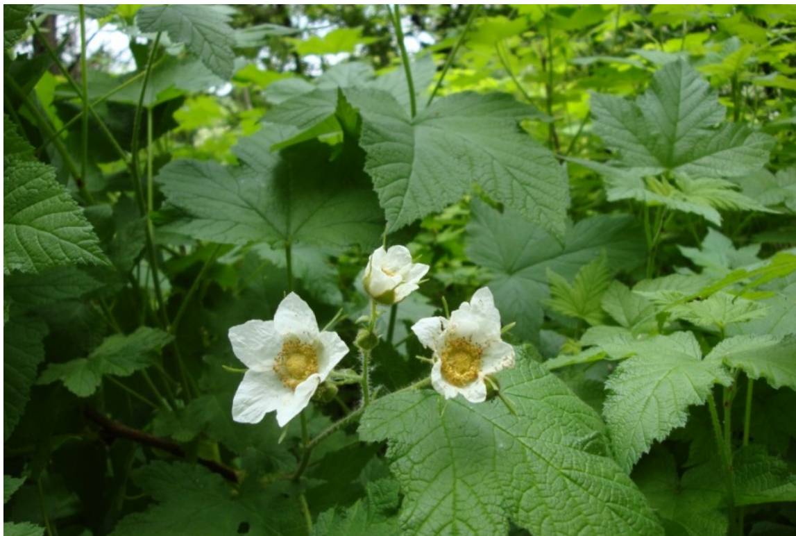
Рис. 6. Малина прекрасная, территория Главного ботанического сада имени Н. В. Цицина РАН.

Малина прекрасная очень декоративна – до цветения куст обращает на себя внимание крупными ярко-зелёными очень своеобразными и многочисленными листьями, но особенно она хороша в период цветения, когда обильно покрывается большими белыми цветками и становится понятно, за что малина получила свое видовое название.