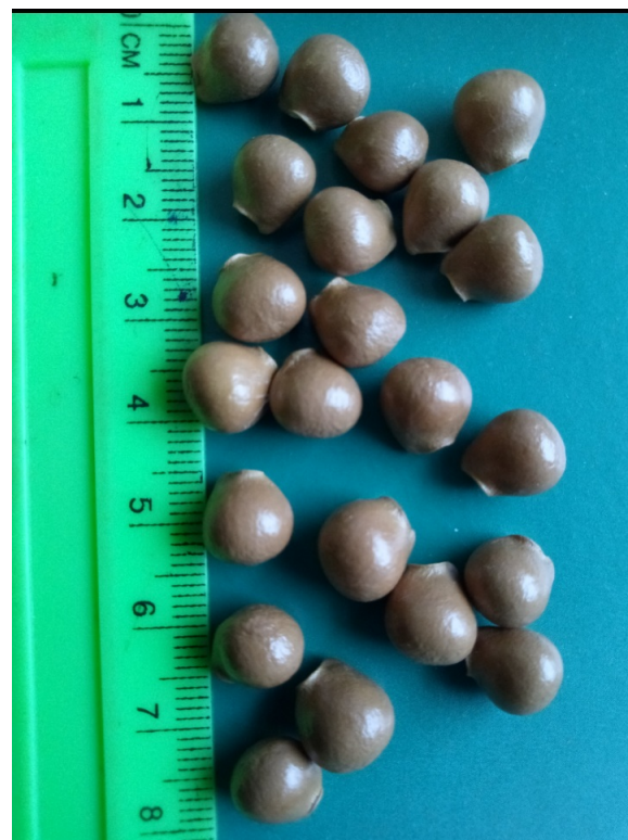
Рис. 2. Семена клекачки перистой.

Fig. 1. Staphylea pinnata L., the territory of the Main Botanical garden n. a. N. V. Tsitsin RAS.