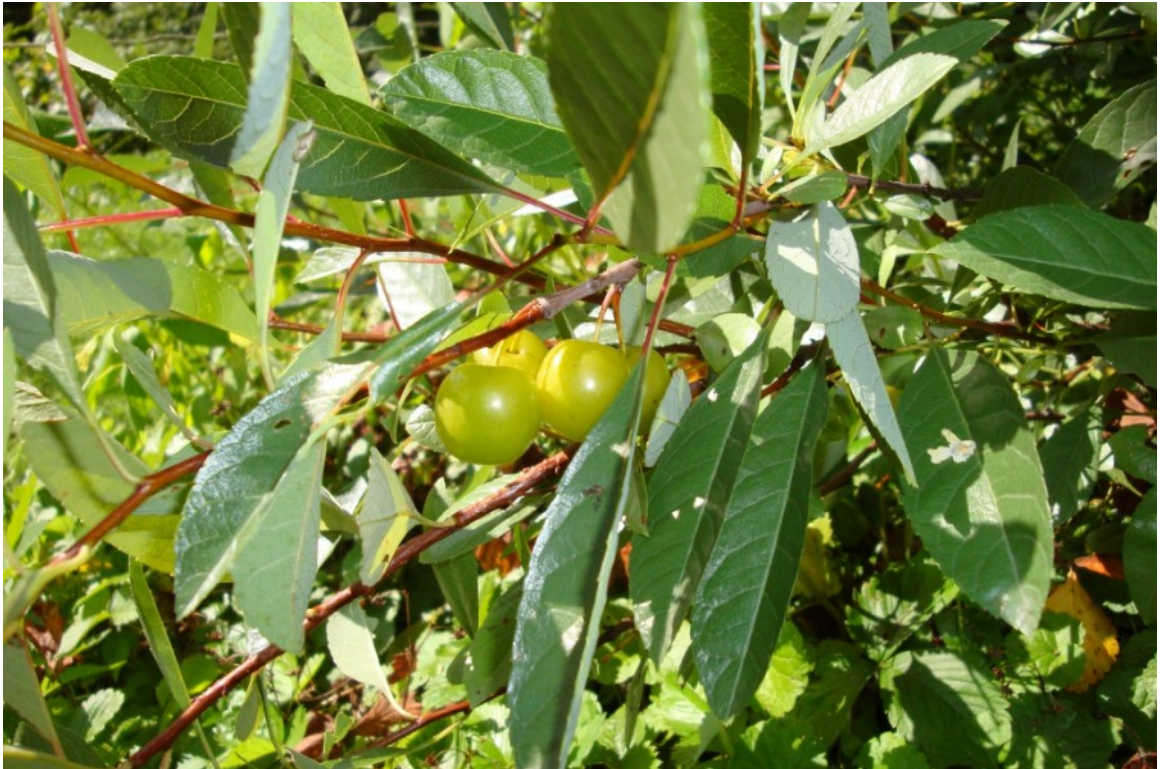
Рис. 4. Вишня Бессея, желтоплодная форма, территория Главного ботанического сада имени Н. В. Цицина РАН.

Вишня Бессея - Cerasus besseyi (Bailey) Sok. (рис. 4).