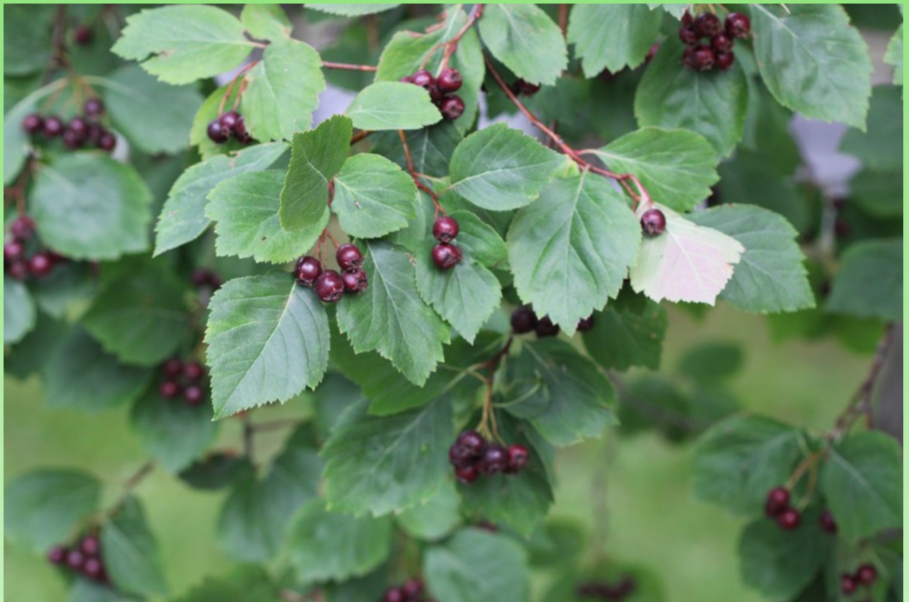
Рис. 11. Crataegus douglasii Lindl. в сквере недалеко от фонтана близ главного корпуса Политехнического университета.

ПУ; редко. На Северо-Западе культивируется в садах и парках, на улицах насел. пунктов, у дорог, одичавшее в лесах, среди кустарников; дов. часто (Ленинградская, Псковская и Новгородская обл.). – Интродуцент из Европы и Зап. Азии; европейско-западноазиатско-североафриканский. – Декоративное.