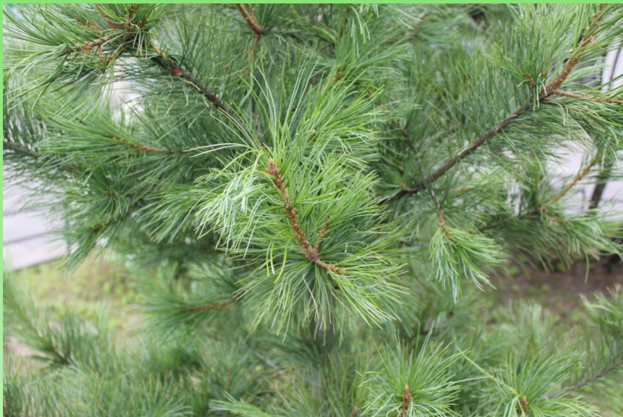
Рис. 2. Молодое дерево Pinus sibirica Du Tour, растущее перед входом в стадион «Политехник».

Fig. 2. Young tree of Pinus sibirica Du Tour growing in front of the entrance to the stadium "Polytechnic".