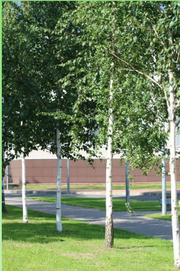
Рис. 3. Молодые посадки Betula papyrifera Marsh. около Технополиса Политехнического университета.

Fig. 3. Young plantings of Betula papyrifera Marsh. near the Technopolis of the Polytechnic University.