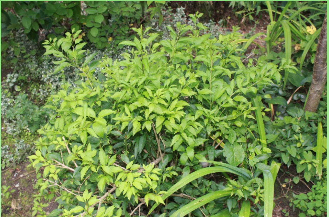
Рис. 9. Forsythia x intermedia 'Paulina' культивируется в садике у жилого дома.