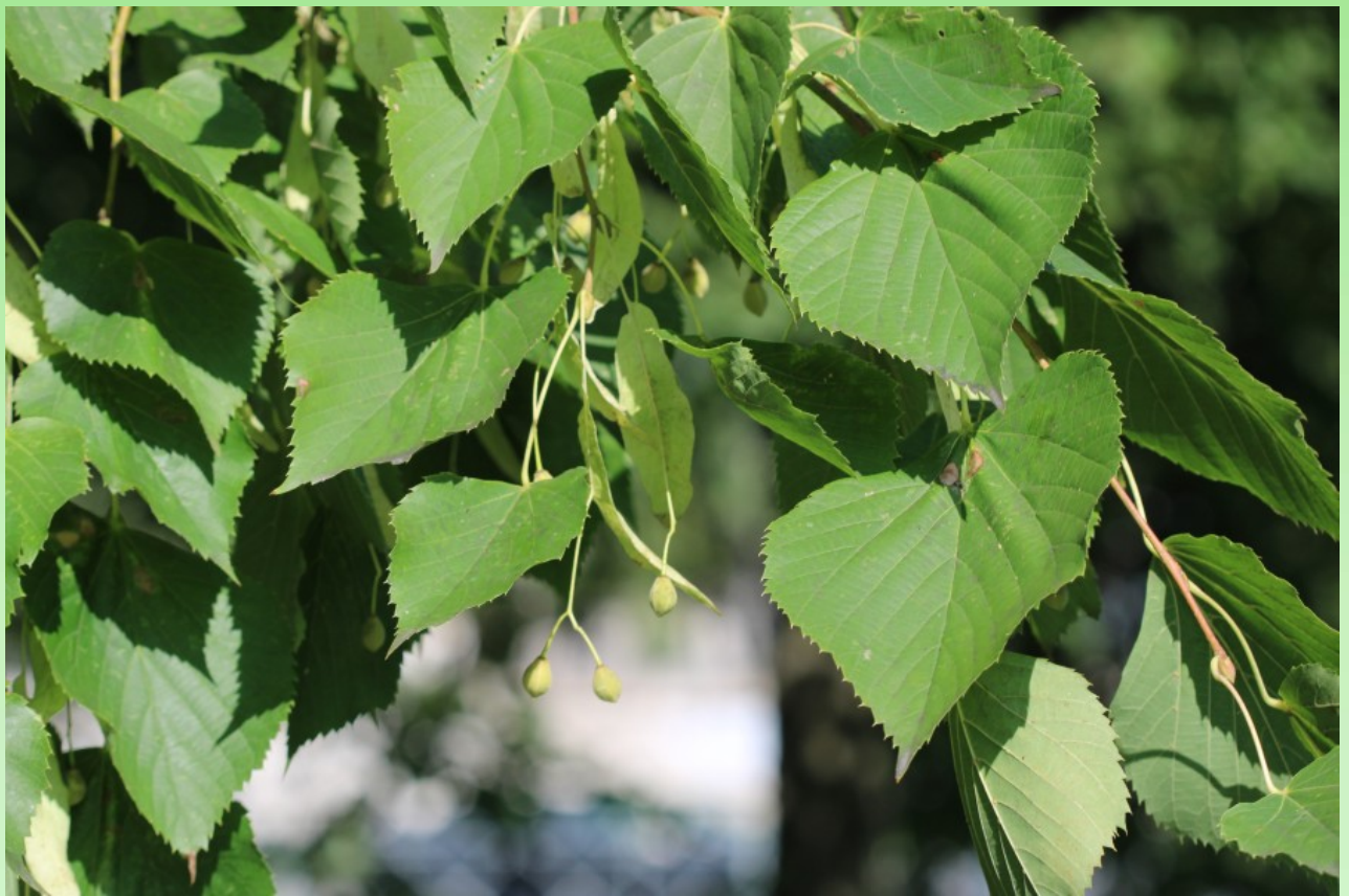
Рис. 8. Tilia platyphyllos Scop. в посадках вдоль ул. Гидротехников около учебного корпуса № 3 Политехнического университета.

Цветёт VII. Высокое дерево до 40 м выс. (Д1). Культивируется в окультуренной части Политехнического парка, самые старые деревья растут у корпусов ПУ; дов. редко. На Северо-Западе культивируется в населённых пунктах и парках; дов. редко (Ленинградская, Псковская и Новгородская обл.). – Интродуцент из Украины, Молдавии, Кавказа, Западной, Центральной и Южной Европы; европейско-югозападноазиатский. – Декоративное, медоносное (рис. 8).