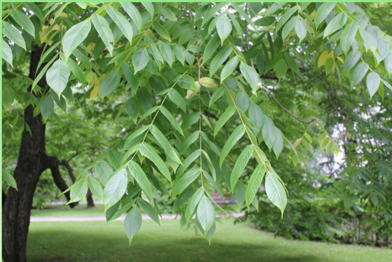
Рис. 7. Juglans cinerea L. культивируется около главного здания Политехнического университета.

Цветёт V–VI. Невысокое дерево до 15 м выс. (Д4). Старые деревья культивируются около главного корпуса ПУ, молодые посадки в других частях парка и у других корпусов ПУ, одичавшее в южной части парка у забора на мусорном месте (уже плодоносит) (Бялт и др., 2019а, b). На Северо-Западе культивируется в садах и парках; редко (Ленинградская обл.). – Интродуцент из Северной Америки; североамериканский. – Декоративное, пищевое, лекарственное (рис. 7).