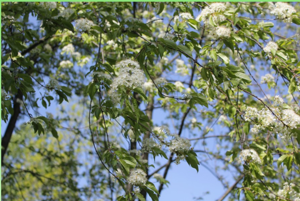
Рис. 12. Групповые посадки Prunus pensylvanica L. f. (= Padellus pensylvanica (L. f.) Eremin et Yushev) в сквере около стадиона «Политехник».