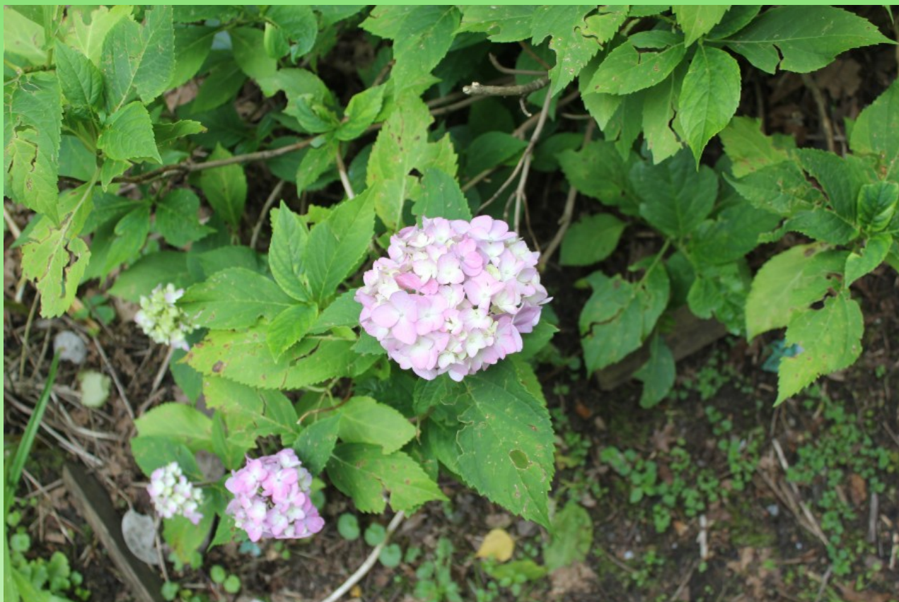
Рис. 6. Hydrangea macrophylla (Thunb.) Ser. в садике около жилого дома на территории парка.