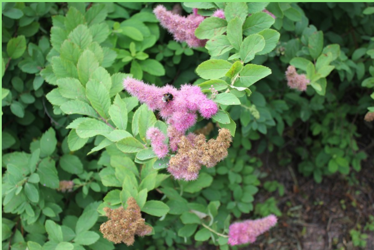
Рис. 13. Spiraea douglasii Hook. – посадки около ограды стадиона «Политехник».