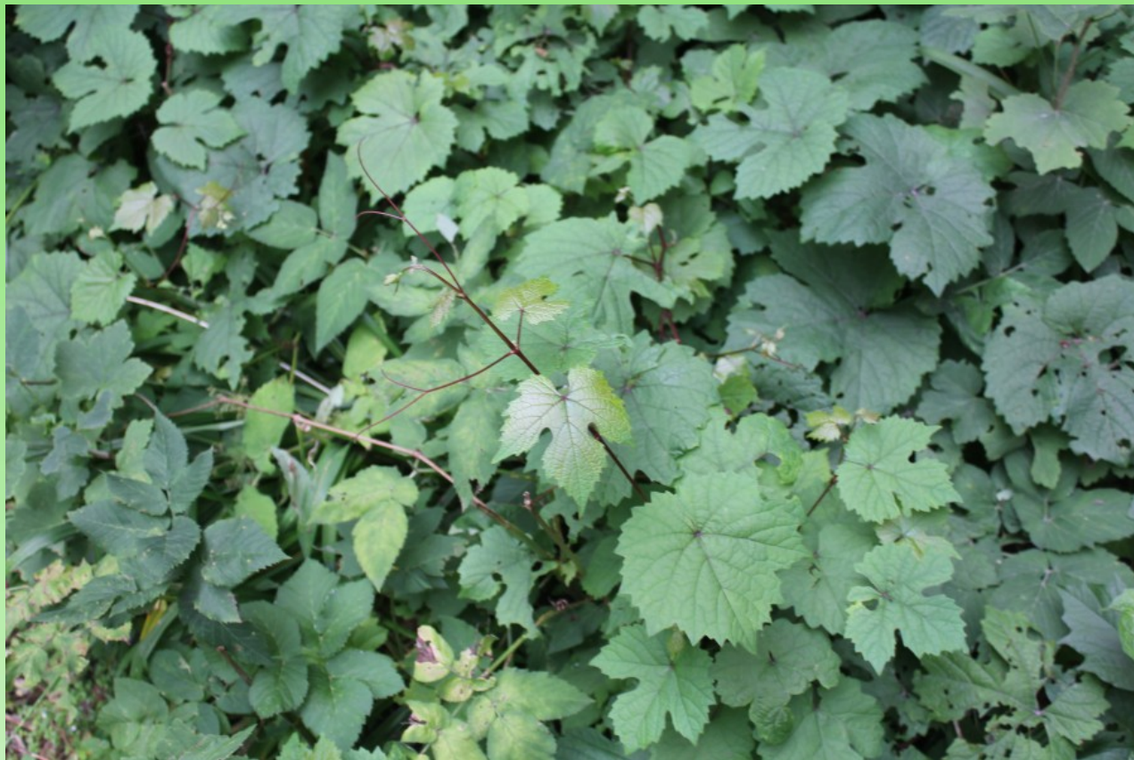
Рис. 14. Vitis amurensis Rupr. – растёт около стенки жилого дома на территории парка.

восточноазиатский. – Пищевое, декоративное, техническое (масляное), медоносное, пергоносное (рис. 14).