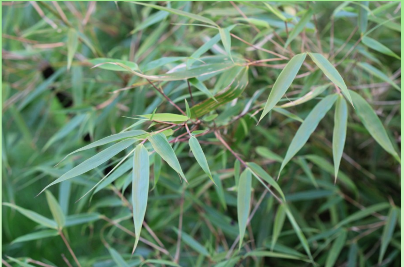
Рис. 10. Бамбук Fargesia murielae (Gamble) T. P. Yi – растёт в открытом грунте около жилого дома в парке.

Fig. 10. The bamboo Fargesia murielae (Gamble) T. P. Yi - grows outdoors near a dwelling building in a park.