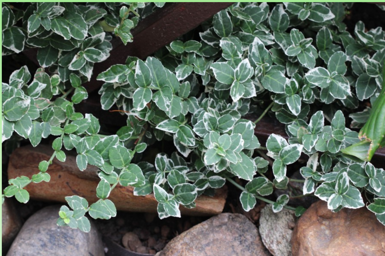
Рис. 4. Euonymus fortunei (Turcz.) Hand.-Mazz. f. picta Dipp. в цветнике около Бюро пропусков Политехнического университета.

Цветёт VI. Кустарник (К3–4). В ПП найден один плодоносящий куст на центральной аллее близ водонапорной башни; оч. редко. – На Северо-Западе России культивируется в парках и лесах, иногда дичает; редко (Лен.: С. Кар.: о. Мюллюсаари в окр. Выборга, окр. Отрадного; Центр.), Пск.: Пск.-Изб., Верх.-Лов.). – Интродуцент; европейско-югозападноазиатский. – Декоративное, техническое, лекарственное, ядовитое.