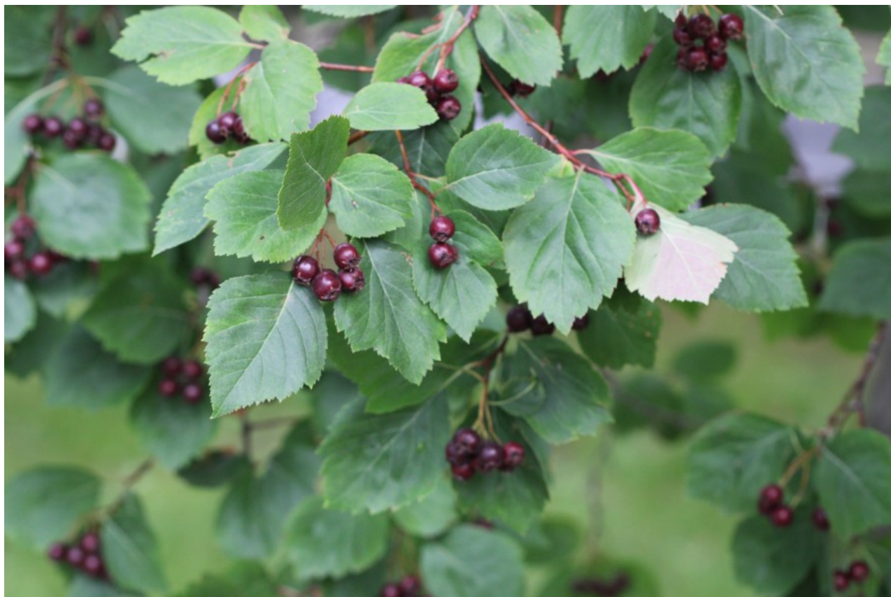
Рис. 11. Crataegus douglasii Lindl. в сквере недалеко от фонтана близ главного корпуса Политехнического университета.

ПУ; редко. На Северо-Западе культивируется в садах и парках, на улицах насел. пунктов, у дорог, одичавшее в лесах, среди кустарников; дов. часто (Ленинградская, Псковская и Новгородская обл.). – Интродуцент из Европы и Зап. Азии; европейско-западноазиатско-североафриканский. – Декоративное.