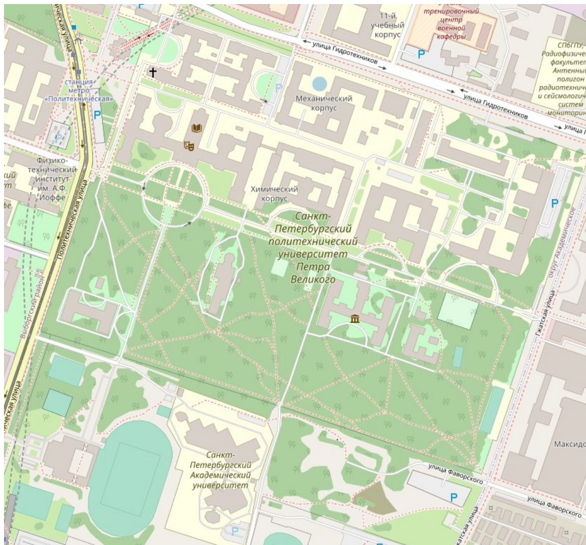
Рис. 1. Карта парка Политехнического университета и его ближайших окрестностей.

Парк Политехнического университета расположен в северной части Санкт-Петербурга, являющейся частью Калининского района города, 60°0'14.1" с.ш., 30°22'4263" в.д. (60.003915' N, 30.378408' E) (рис. 1). С востока парк ограничен Гжатской ул., с севера ул. Гидротехников (корпусами ПУ), с запада – Политехнической ул. и с юга – Стадионом ПУ и отчасти, ул. Фаворского (рис. 1).