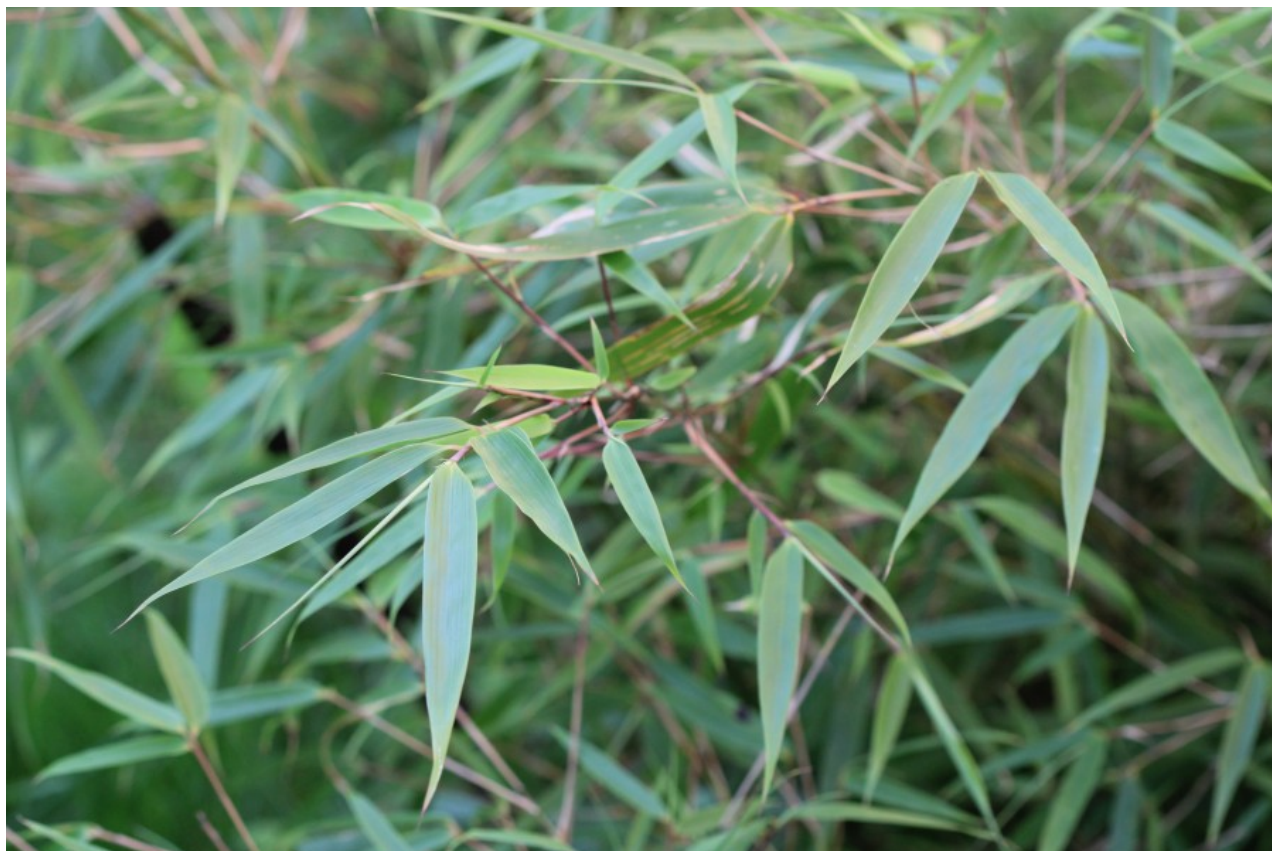
Рис. 10. Бамбук Fargesia murielae (Gamble) T. P. Yi – растёт в открытом грунте около жилого дома в парке.

Fig. 10. The bamboo Fargesia murielae (Gamble) T. P. Yi - grows outdoors near a dwelling building in a park.