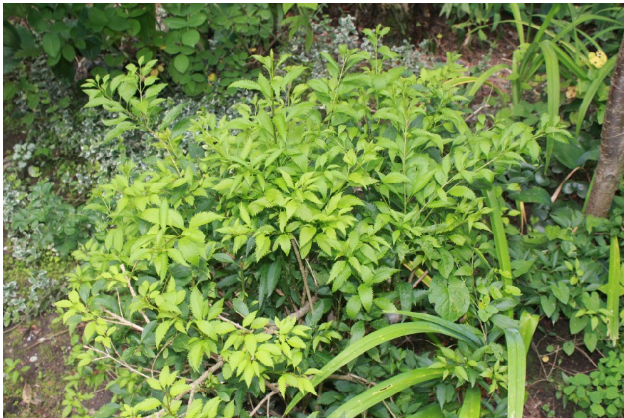
Рис. 9. Forsythia x intermedia 'Paulina' культивируется в садике у жилого дома.