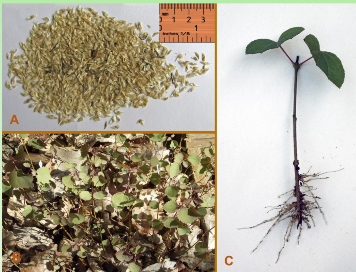
Рис. 3. А - Семена Cercidiphyllum magnificum . В - Сеянцы Cercidiphyllum japonicum в начале июня 2 года выращивания. С - Укорененный черенок Cercidiphyllum japonicum .