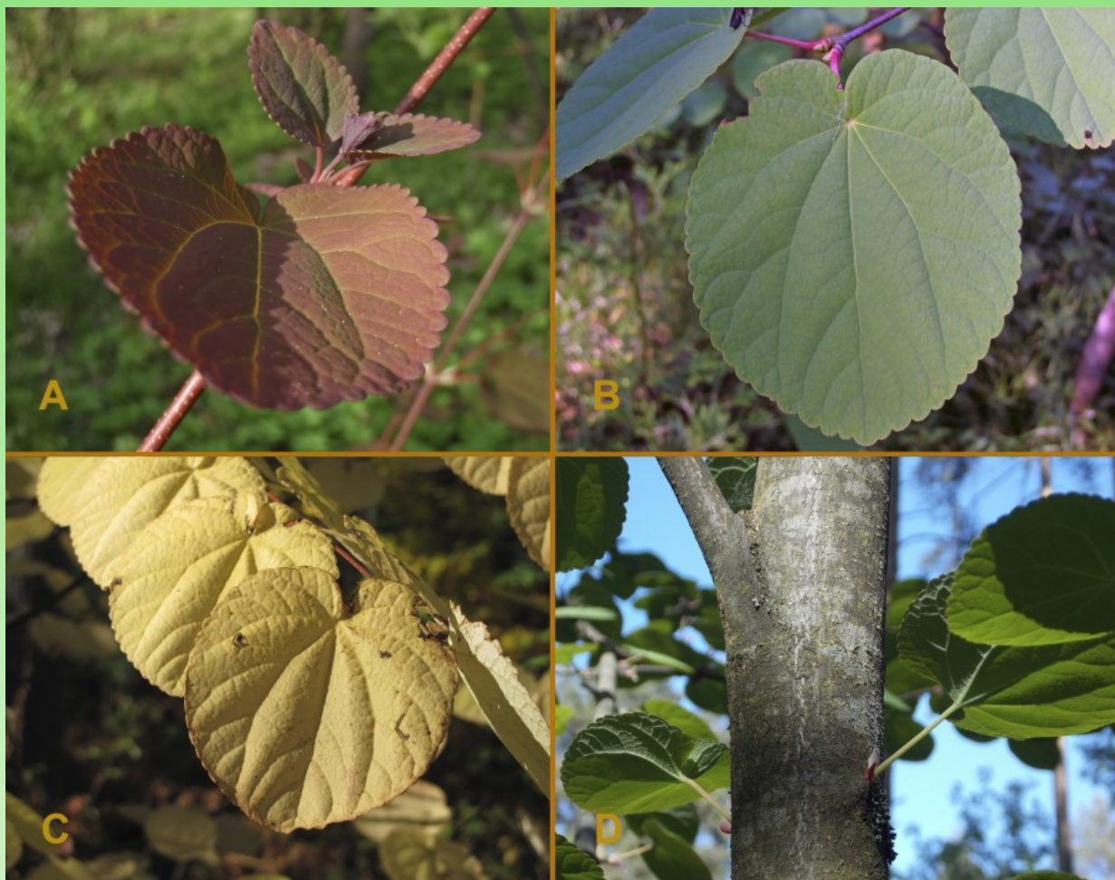
Рис. 1. Cercidiphyllum japonicum в Ботаническом саду Петра Великого. А - Листья в весенней окраске в конце мая. В - Листья в середине июля. С - Листья в осенней окраске в конце сентября. D - Ствол молодого дерева.

В Ботаническом саду БИН в условиях Санкт-Петербурга самосев багрянника японского отмечен в июле 2021 г. на дендропитомнике, на гряде Ж-12, в посевах горшков, всходы этого года.