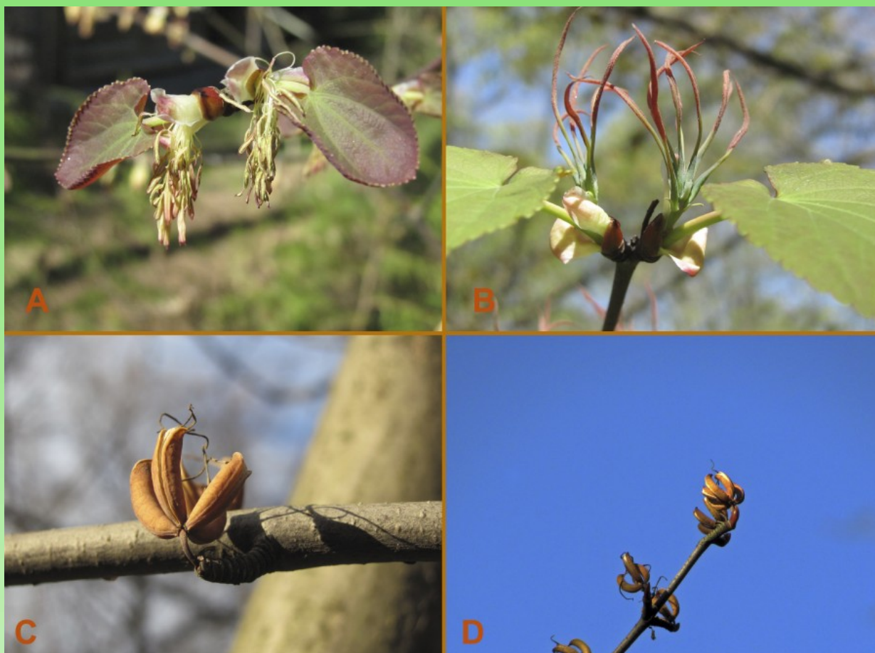
Рис. 2. А - Мужские соцветия у Cercidiphyllum japonicum . В - Женские соцветия у Cercidiphyllum magnificum . С - Плоды Cercidiphyllum magnificum . D - Плоды Cercidiphyllum japonicum .