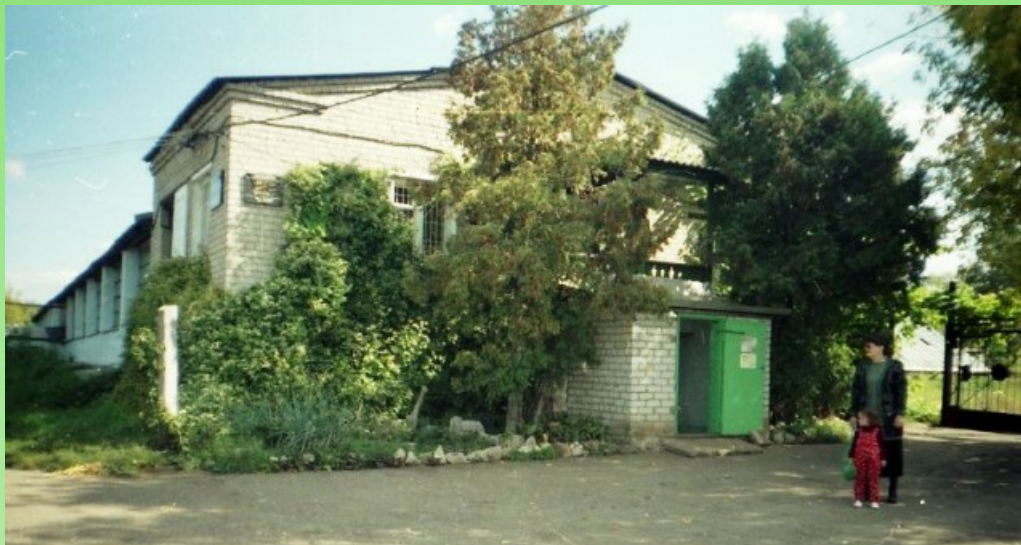
Рис. 5. Оранжерея Ботанического сада Куйбышевского государственного университета, конец 90-х годов.

помещений». Сотрудниками оранжереи были созданы зелёные уголки в цехах нескольких заводов г. Куйбышева.