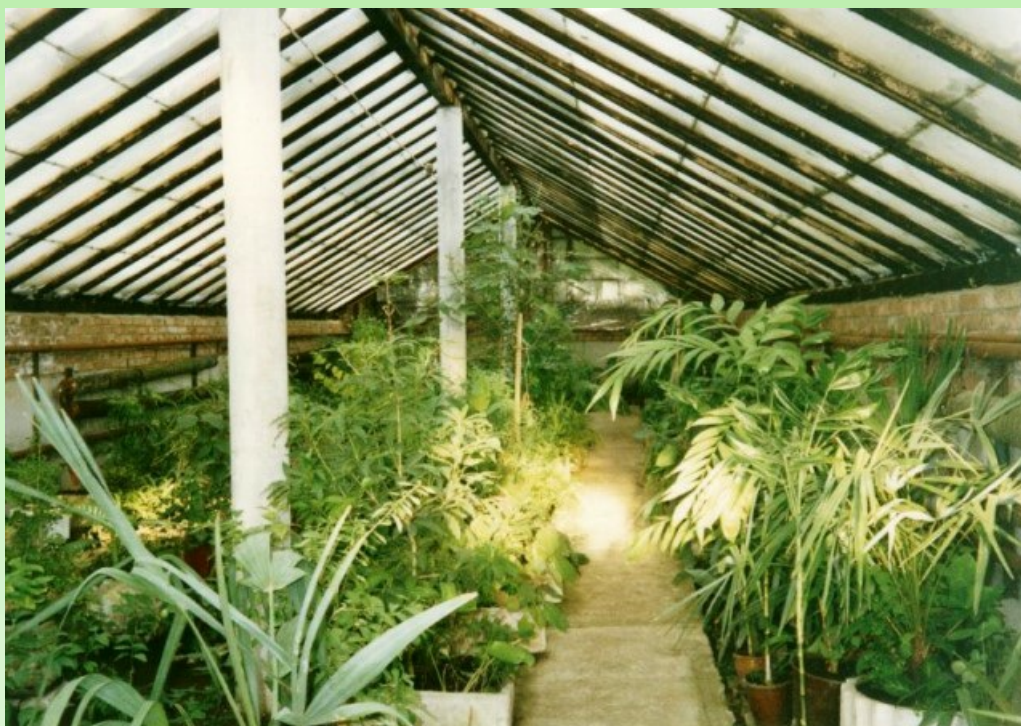
Рис. 6. Четвертая разводочная теплица, начало 2000-х годов.

Pic. 5. Greenhouse of the Botanical Garden of the Kuibyshev State University, late 90s.