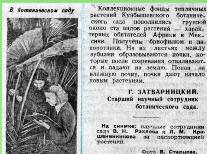
Рис. 2. Заметка в газете "Волжская коммуна" от 12.02.1950 г.