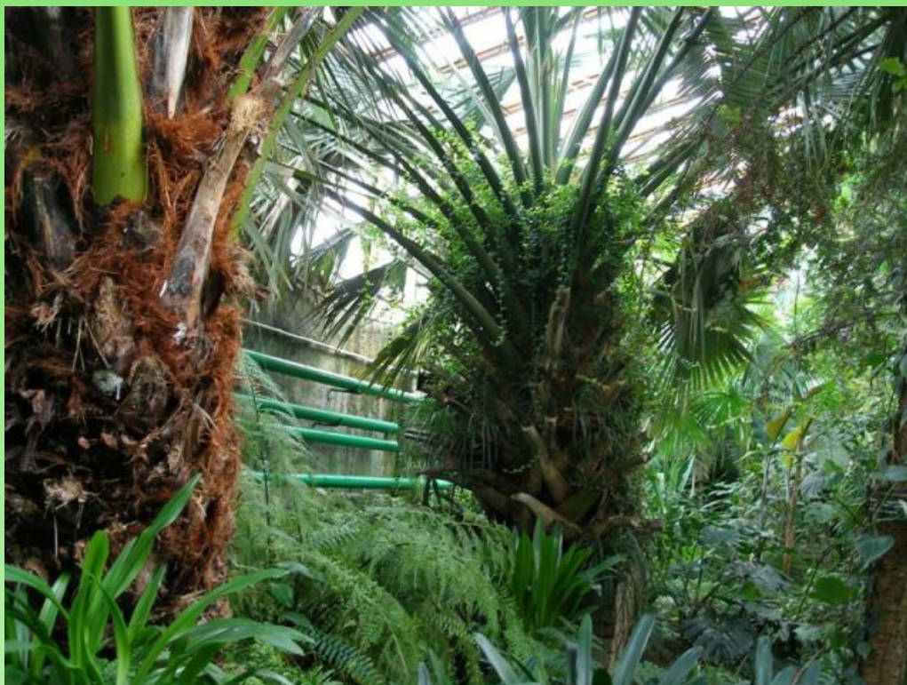
Рис. 10. Тропический зал, 2007 г.