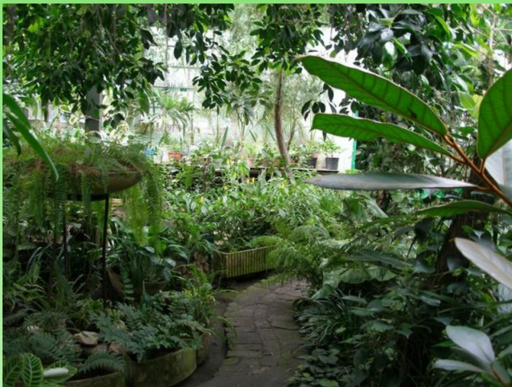
Рис. 8. Субтропический зал, 2007 г.