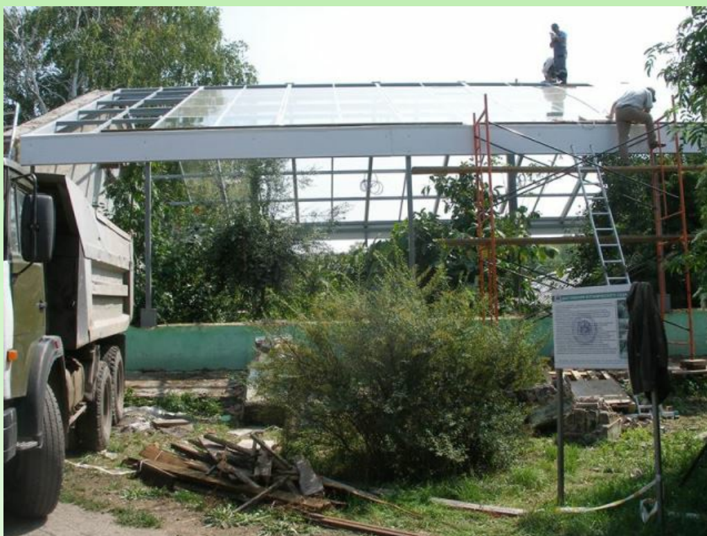
Рис. 11. Ремонт оранжереи, 2016 г.