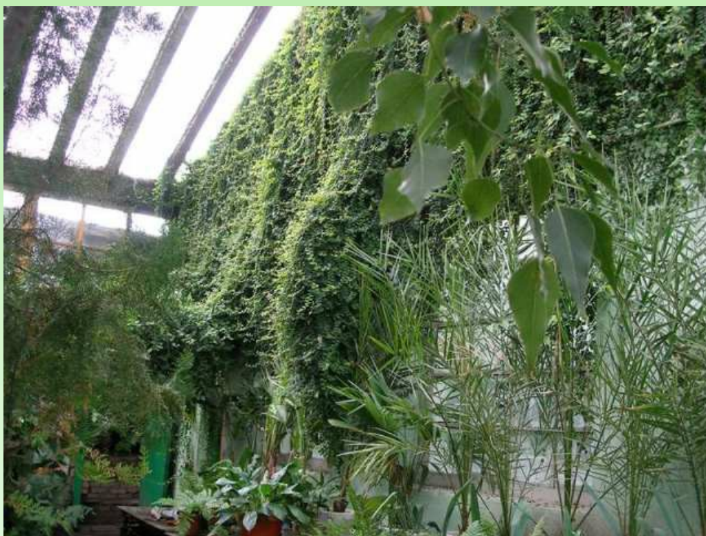
Рис. 9. Субтропический зал, 2007 г.