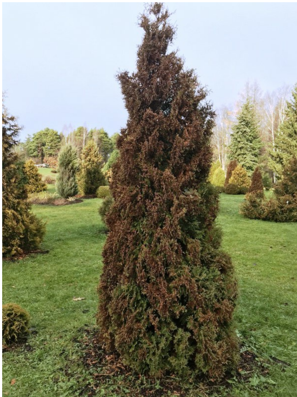
Рис. 4. Усыхание побегов у культивара 'Холмструп', осень 2019 года.