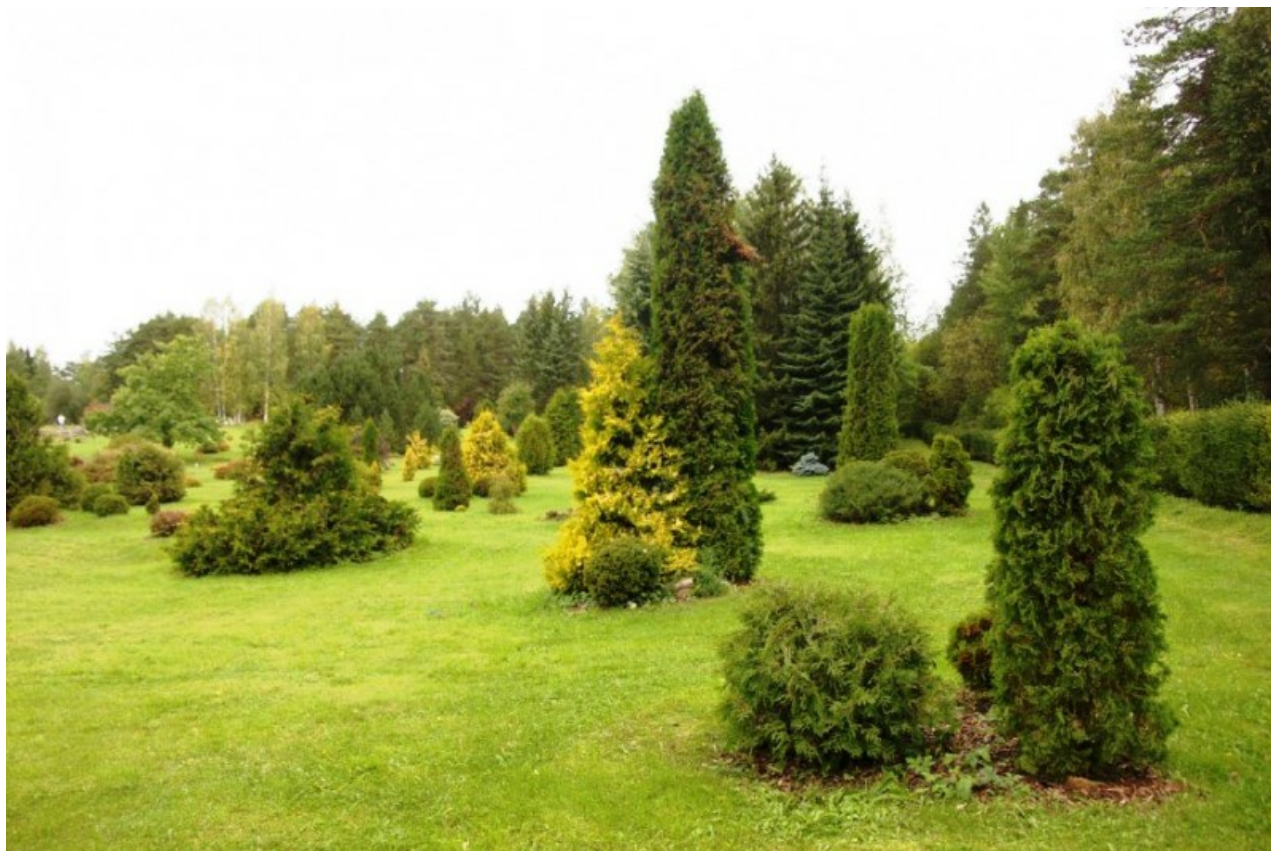
Рис. 1. Коллекция культиваров туи западной в Ботаническом саду ПетрГУ.

Формирование коллекции культиваров туи западной началось в конце 1990-х гг. и продолжается по настоящее время. Сейчас в экспозиции «Декоративный арборетум» представлены 45 культиваров туи западной (рис. 1). Возраст большей части растений превышает 15 лет.