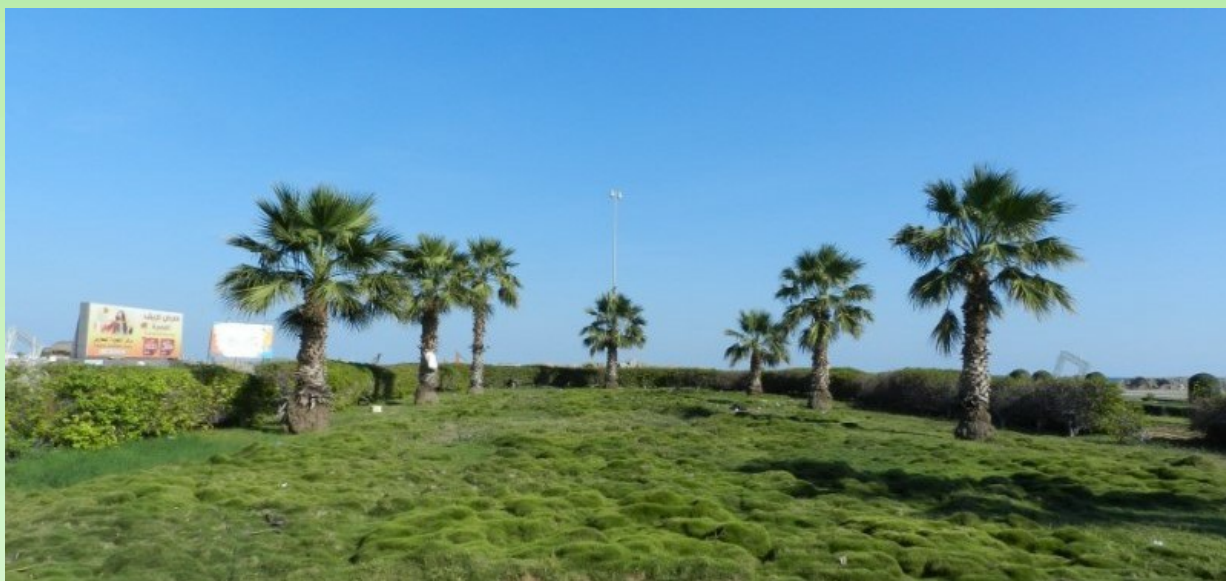
Рис. 5. Вашингтония нитеносная в городских посадках в г. Фуджейра.

Rice 5. Washingtonia filifera in urban plantings in the Fujairah city.