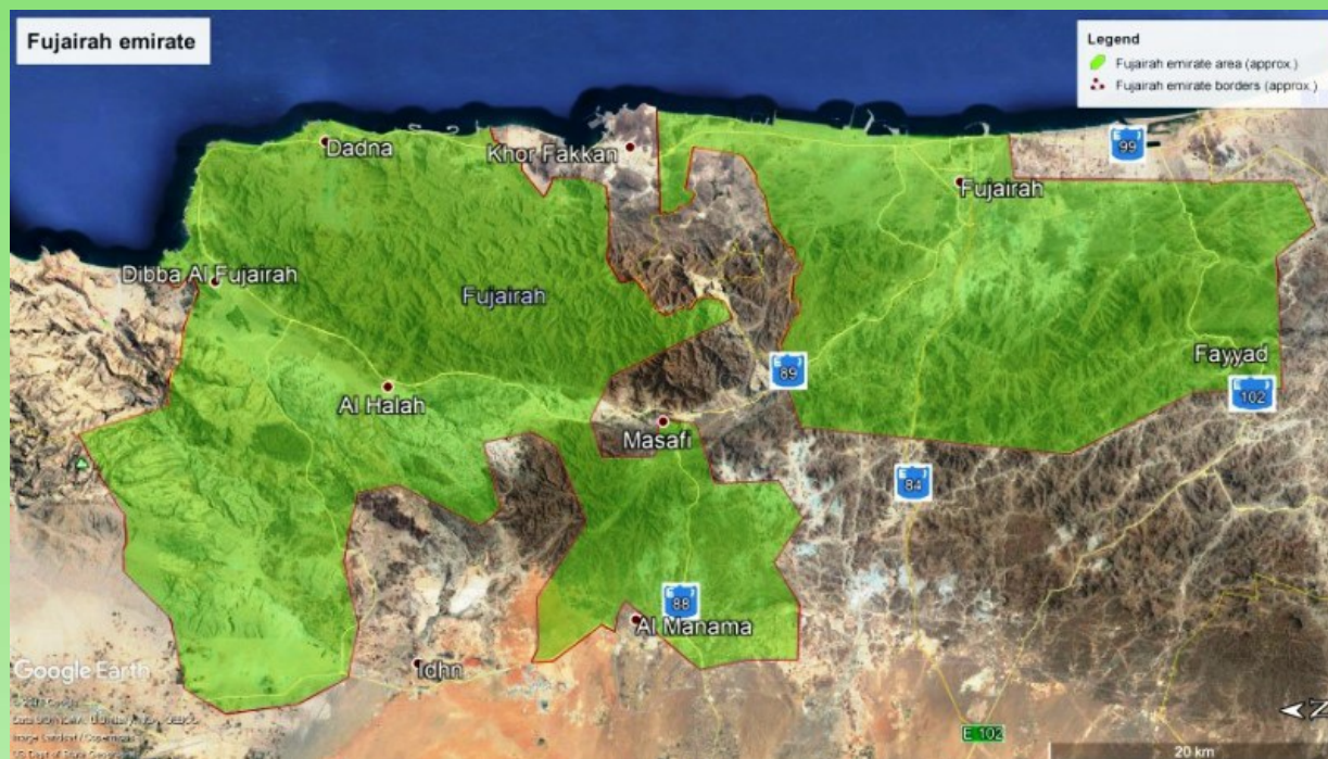
Рис. 1. Карта эмирата Фуджейра (взято и модифицировано из Google Maps).