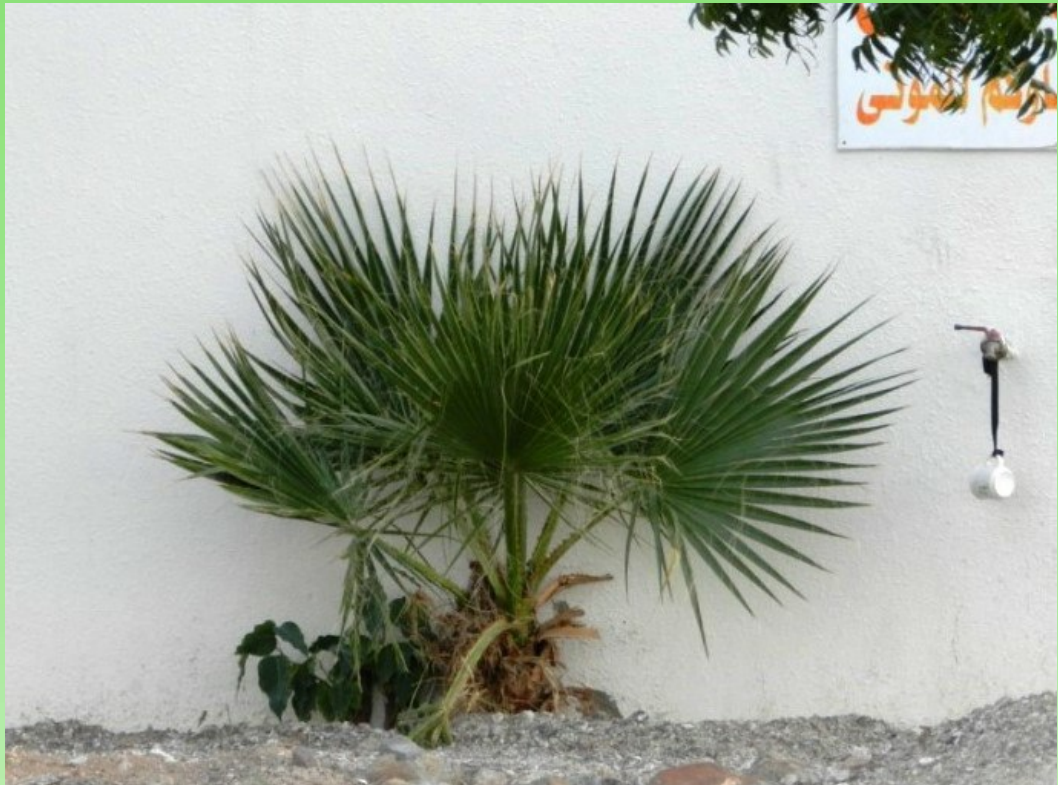
Рис. 6. Одичавшая Вашингтония около стены сада в Хор-Факкане.