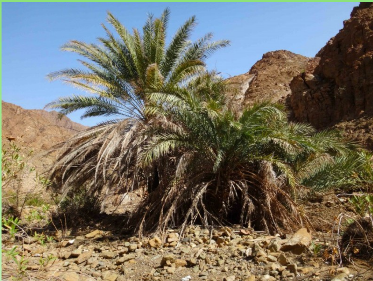
Рис. 4. Одидавшая финиковая пальма в вади в горах Хаджар.