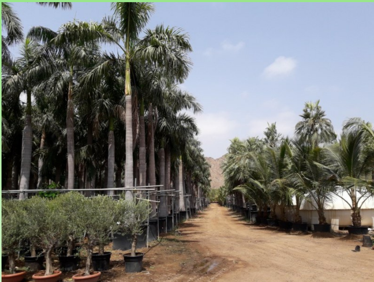
Рис. 2. Пальмы, культивируемые в горшках в питомнике растений в Диббе.

Fig. 2. Palm trees cultivated in pots in the plant nursery in Dibba town.