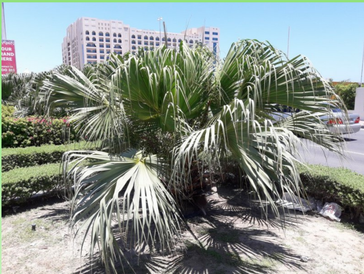
Рис. 3. Livistona chinensis (Jacq.) R. Br. ex Martius в посадках в г. Фуджейра.