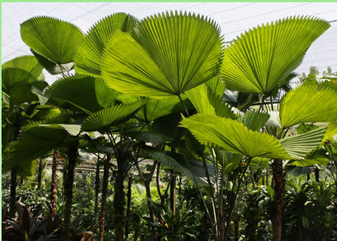
Рис. 10. Licuala grandis H. Wendl. ex Linden культивируется в питомнике растений в Бидии

Прим. Гофрированная веерная пальма, пожалуй, одна из самых интересных и элегантных из всех маленьких пальм. Её глянцевые, складчатые, веерообразные листья просто фантастические, как и свисающие грозди красных плодов, которые созревают в конце сезона. Это небольшая подлесковая пальма, которая идеально подходит для небольших тропических пейзажей, а также для интерьеров (Palmweb, 2011).