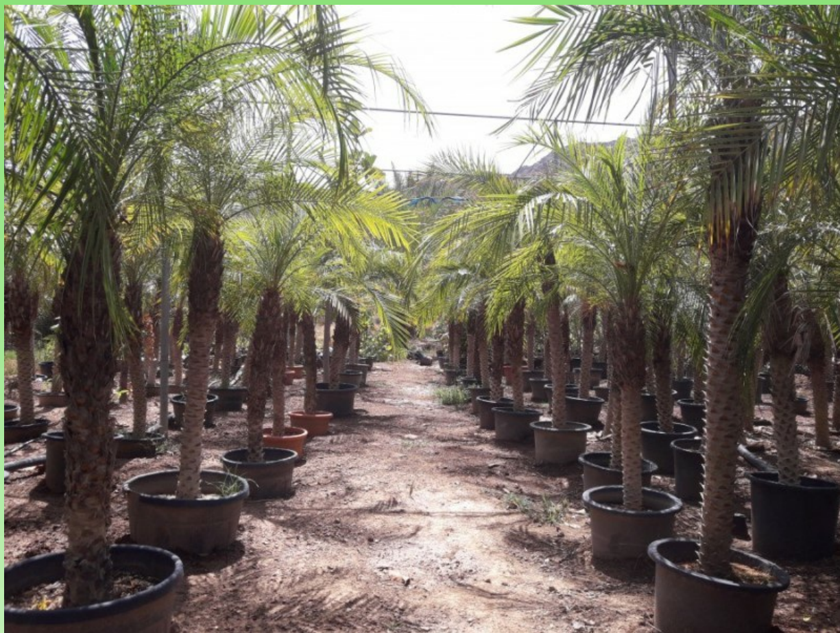
Рис. 11. Карликовая финиковая пальма выращивается на продажу в питомнике растений.