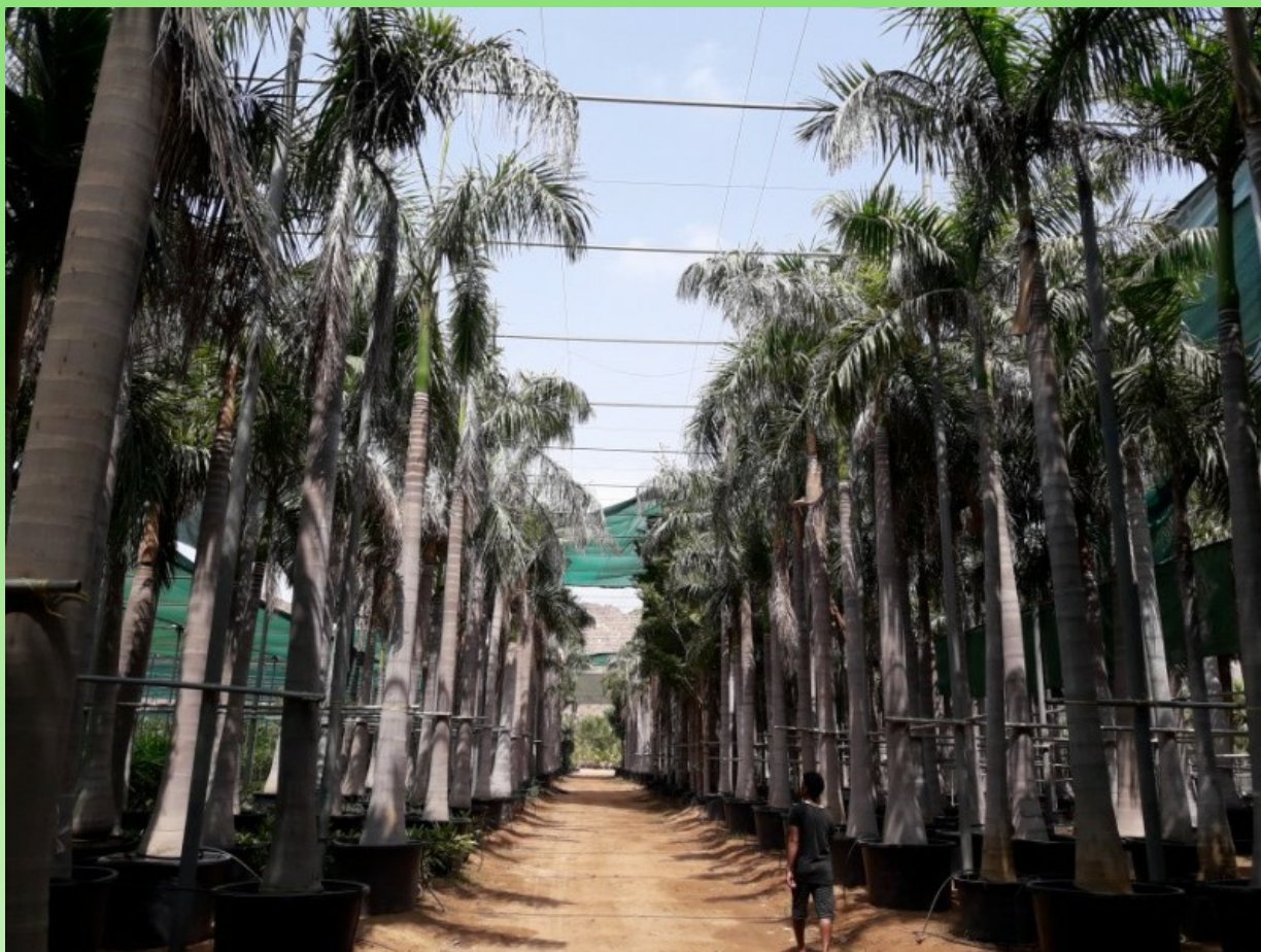
Рис. 13. Roystonea regia (Kunth) O.F. Cook в питомнике растений в Рул Дадне.