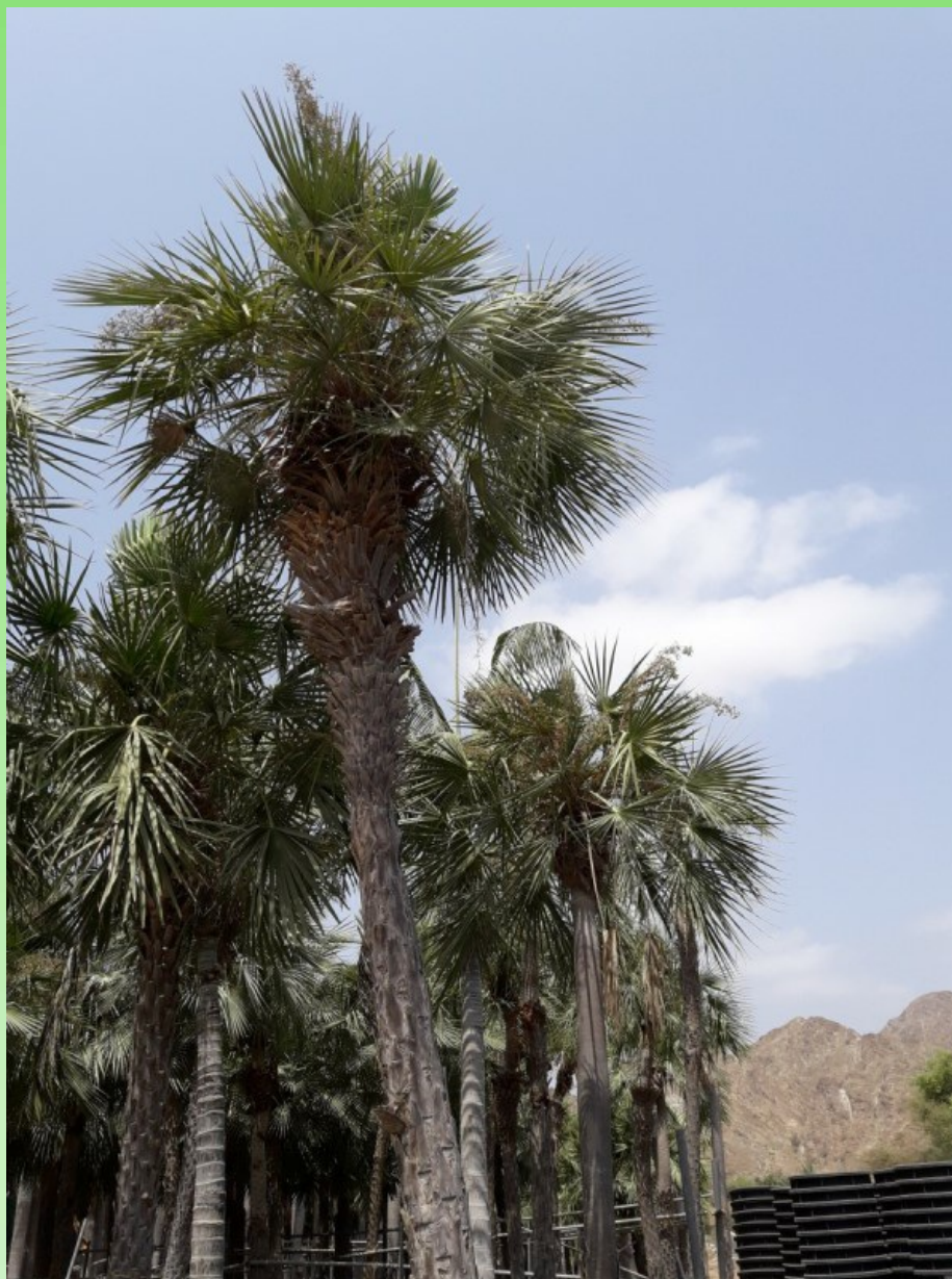
Рис. 9. Copernicia alba Morong. культивируемая в питомнике в Бидии.