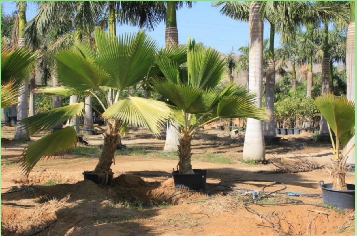
Рис. 12. Pritchardia pacifica Seem. & H.Wendl. вместе с королевской пальмой культивируется в питомнике растений в Бидии