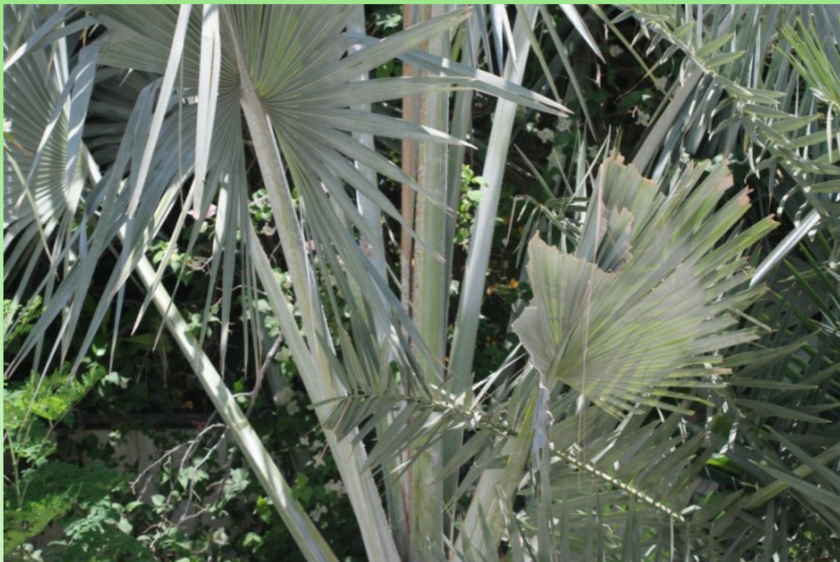
Рис. 8. Культивируемая в питомнике растений Bismarckia nobilis Hildebrandt & H. Wendl. (фото М. В. Коршунова).

черепитчатые, округлые, в основании сросшиеся; лепестки мельче чашелистиков, по 3, треугольные, при основании коротко сросшиеся; стаминодии, соединенные своими уплощенными треугольными нитями в кольцо с 6 зубцами, на конце которых находятся уплощенные пустые стреловидные пыльники; гинецей трехплодный, округлый, на конце с 3 низкими, слегка загнутыми рыльцами, имеются также септальные нектарники. Плоды образуются на женских растениях и представляют собой коричневую яйцевидную костянку, каждая из которых содержит одно семя. Костянки б. м. эллипсоидальные, яйцевидные или округлые; эпикарпий гладкий, блестящий, насыщенно-коричневый, несколько испещренный светло-коричневыми пятнами, мезокарпий волокнистый, б. м. ароматный, эндокарпий толстый. Семя базальное, эндосперм однородный (Dransfield et al., 2008).