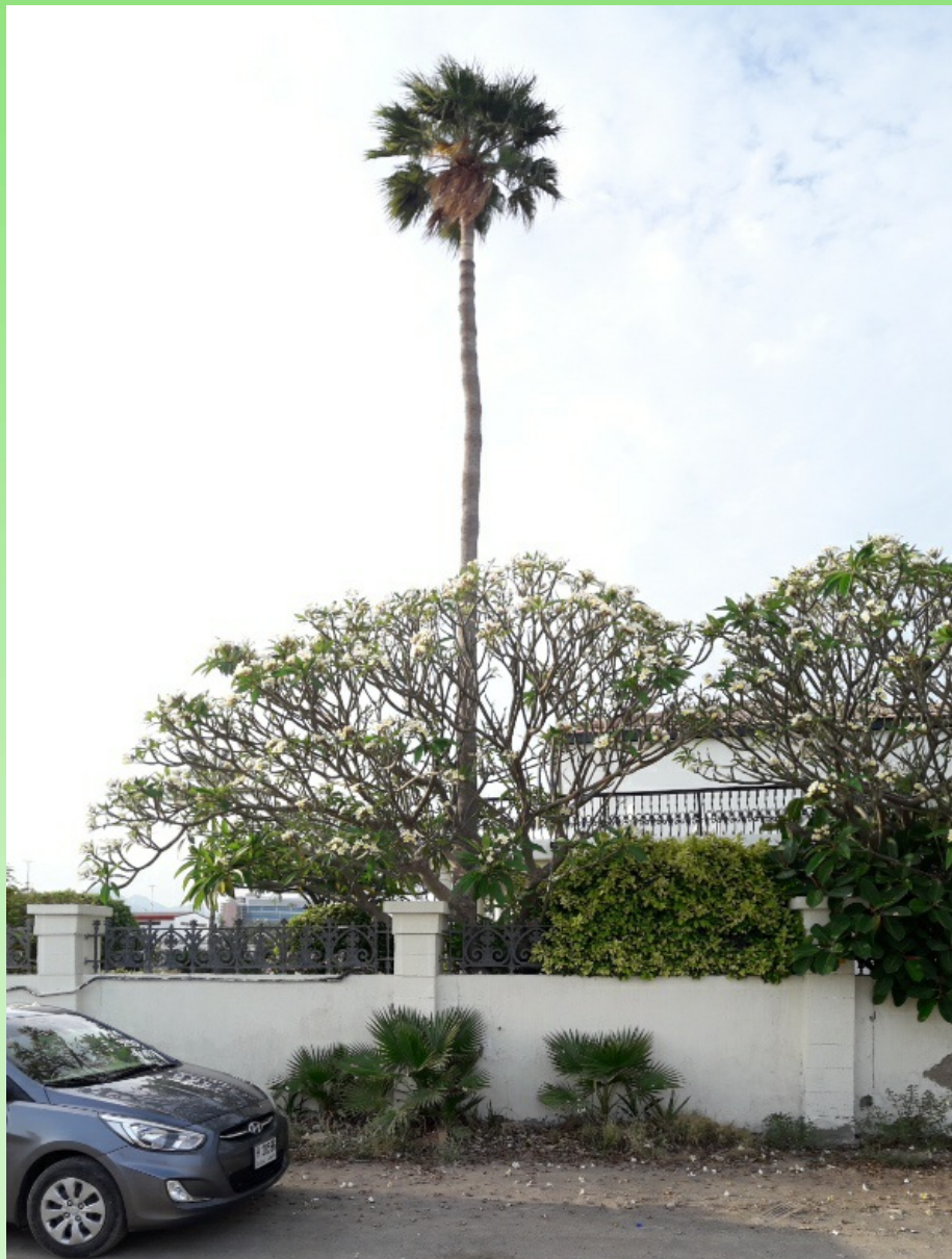
Рис. 7. Washingtonia robusta H. Wendl. культивируется около виллы и её самосев-подрост вдоль ограды сада.

6. ** Washingtonia robusta H. Wendl. 1883, Garten-Zeitum (Berlin), 2: 198. – Mexican fan palm or Mexican washingtonia (англ.).