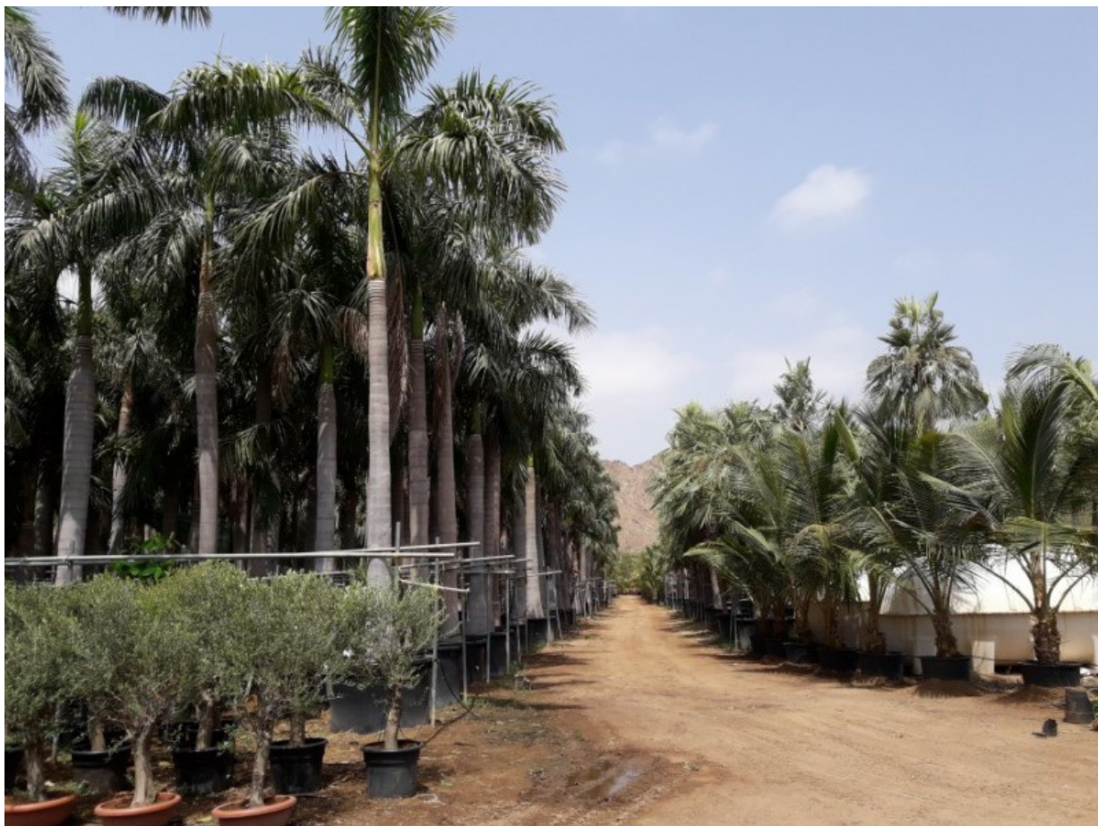
Рис. 2. Пальмы, культивируемые в горшках в питомнике растений в Диббе (фото В. В. Бялта).

Fig. 2. Palm trees cultivated in pots in the plant nursery in Dibba town (photo by V. Byalt).