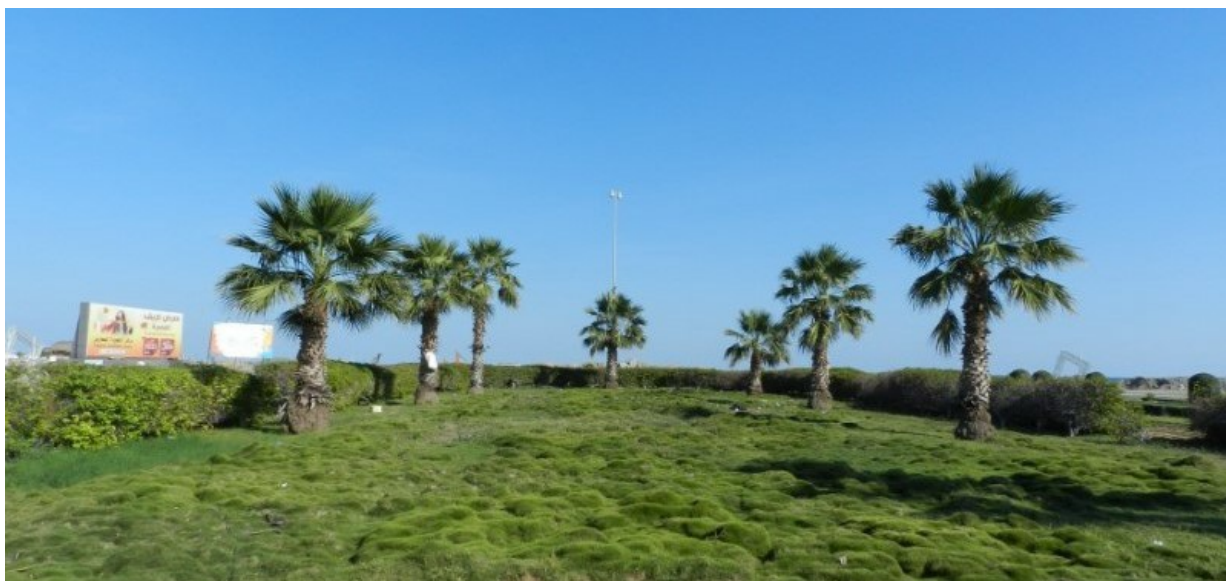
Рис. 5. Вашингтония нитеносная в городских посадках в г. Фуджейра.

Rice 5. Washingtonia filifera in urban plantings in the Fujairah city.