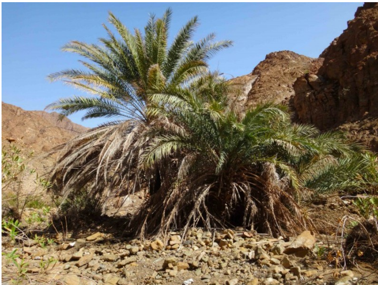
Рис. 4. Одичавшая финиковая пальма в вади в горах Хаджар.