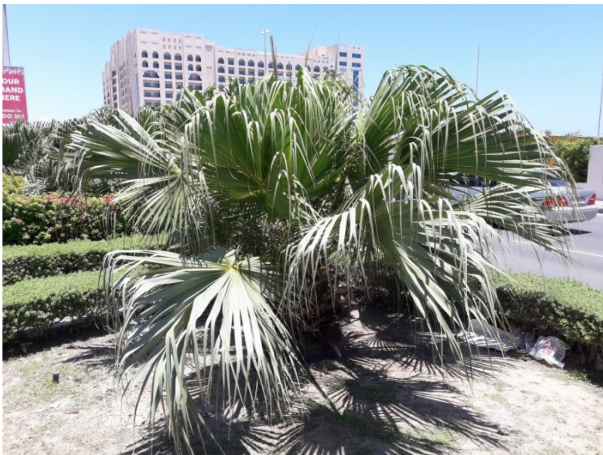
Рис. 3. Livistona chinensis (Jacq.) R. Br. ex Martius в посадках в г. Фуджейра.