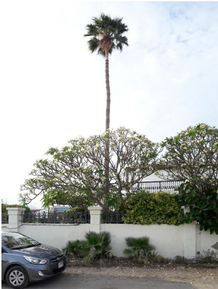
Рис. 7. Washingtonia robusta H. Wendl. культивируется около виллы и её самосев-подрост вдоль ограды сада.

6. ** Washingtonia robusta H. Wendl. 1883, Garten-Zeitum (Berlin), 2: 198. – Mexican fan palm or Mexican washingtonia (англ.).