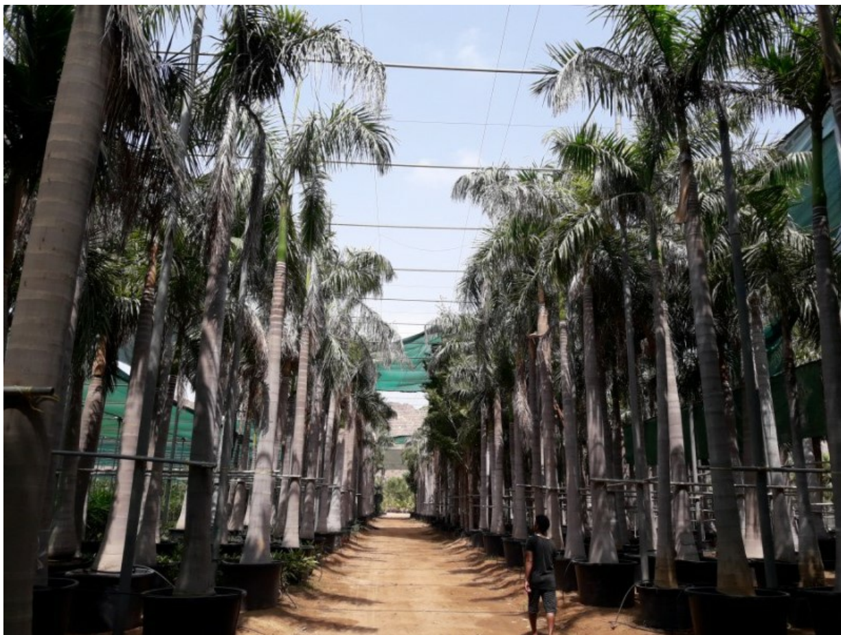
Рис. 13. Roystonea regia (Kunth) O.F. Cook в питомнике растений в Рул Дадне.