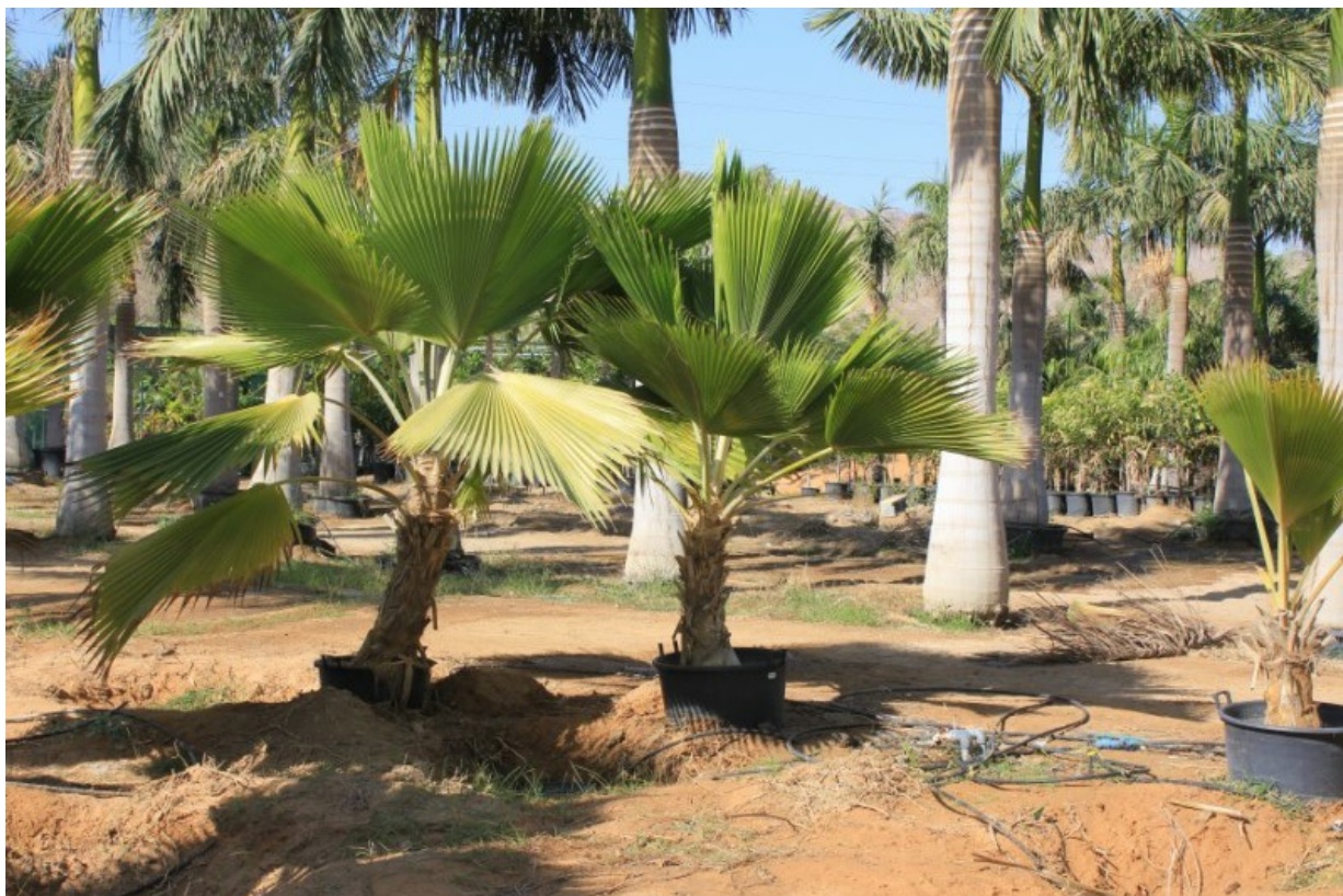
Рис. 12. Pritchardia pacifica Seem. & H.Wendl. вместе с королевской пальмой культивируется в питомнике растений в Бидии