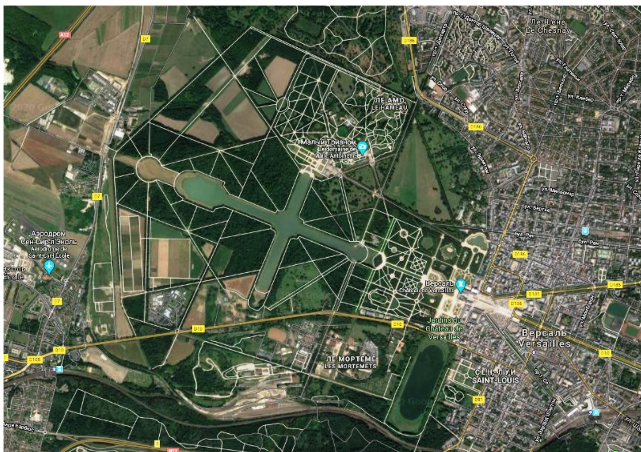
Рис.4. Вид на Версаль с Гугла.