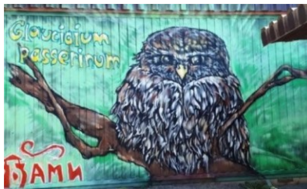
Рис. 7. Воробьиный сычик.

Fig. 7. Pygmy owl ( Glaucidium passerinum ).