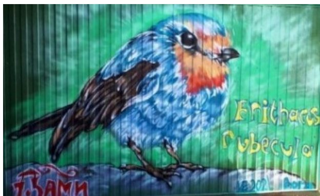
Рис. 6. Зарянка (малиновка).

В том же году художник Илья Ершов создал орнитограффити (рис. 6-8) на стенах учебных корпусов базы практик ПетрГУ.