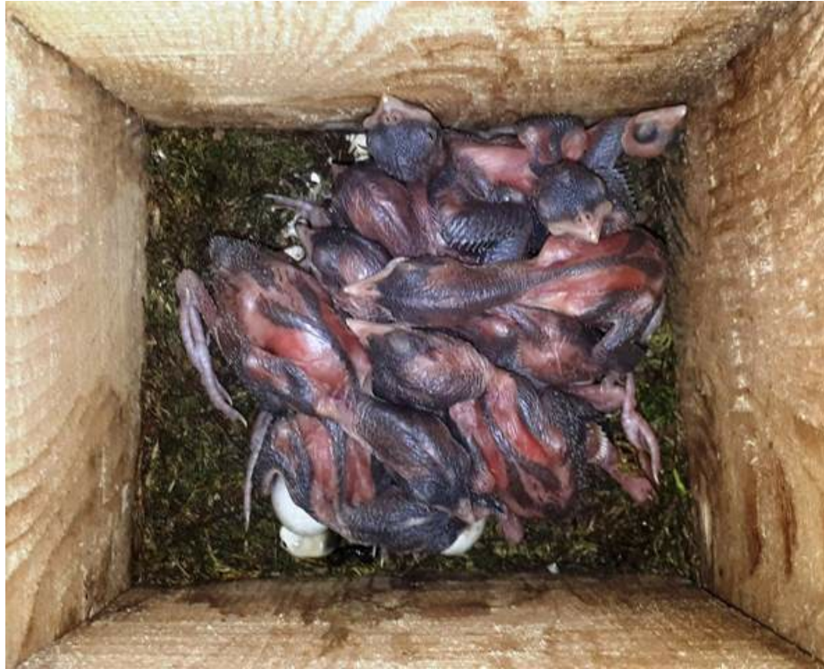
Рис. 1. Десятидневные птенцы вертишейки в искусственном гнездовье на территории Ботанического сада. 20.06.2019

Красной книги, - черного коршуна (вероятно гнездившегося поблизости) а в зимний период – воробьиного сыча, использующего ИГ в качестве кладовых для своих запасов корма. Обычна на гнездовании вертишейка, – малочисленный представитель дятлов, включенный в список видов, нуждающихся в особом внимании к состоянию их популяций.