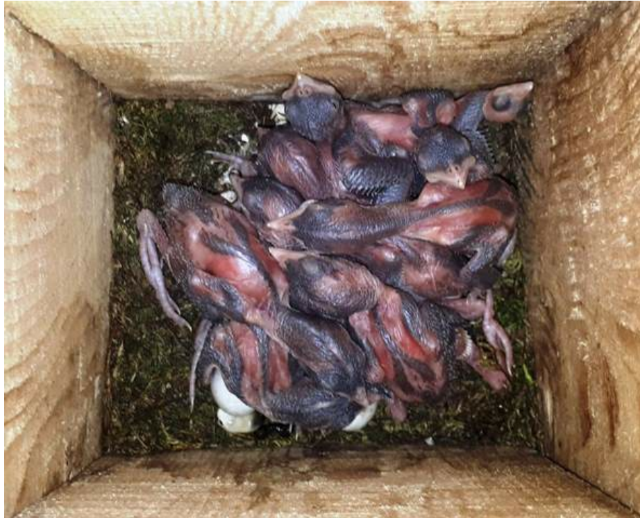
Рис. 1. Десятидневные птенцы вертишейки в искусственном гнездовье на территории Ботанического сада. 20.06.2019

Красной книги, - черного коршуна (вероятно гнездившегося поблизости) а в зимний период – воробьиного сыча, использующего ИГ в качестве кладовых для своих запасов корма. Обычна на гнездовании вертишейка, – малочисленный представитель дятлов, включенный в список видов, нуждающихся в особом внимании к состоянию их популяций.