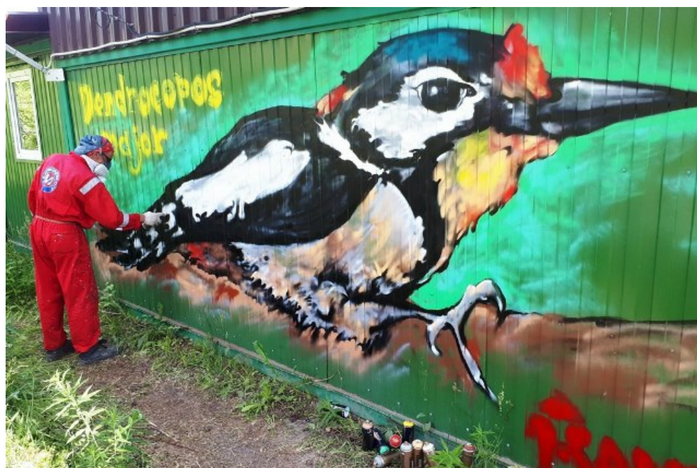
Рис. 8. Илья Ершов и большой пестрый дятел.

Fig. 7. Pygmy owl ( Glaucidium passerinum ).