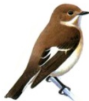
Мухоловка-пеструшка (самец и самка)

Мухоловка – пеструшка ( Ficedula hypoleuca ) – перелетная птица. Прилетает в Карелию в первой декаде мая, ищет подходящее дупло и поселяется в нем. Гнездо строит с включением березовой коры и тонких сухих стебельков злаков. В конце мая появляются первые кладки (3-9 яиц), птенцов кормят оба родителя. В конце августа происходит осенний отлет птиц к местам зимовки – в Северную Африку.