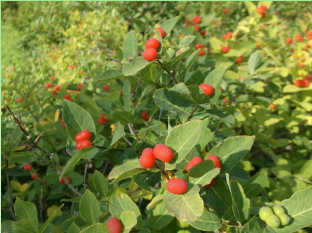
Рис. 1 Образец 15K L. chamissoi .

I группа (вполне жизнеспособные / вполне перспективные) включает в себя 12 образцов (рис. 1). Растения из указанной группы произрастают как в г. Кировск (4 образца), так и г. Апатиты (8 образцов). Растения жимолости в группе I характеризуются ежегодным приростом в высоту, полным одревеснением годичных побегов, высокой зимостойкостью, благодаря этому, образцы сохраняют жизненную форму. Крона правильно сформирована, в незначительном количестве присутствуют сухие ветви. Цветение и плодоношение наблюдается ежегодно, длительность цветения 5-10 дней, плоды удовлетворительного вида с гладкой поверхностью, без повреждений, семена вызревают нерегулярно, требуется искусственный посев семян, возможно размножение черенкованием.