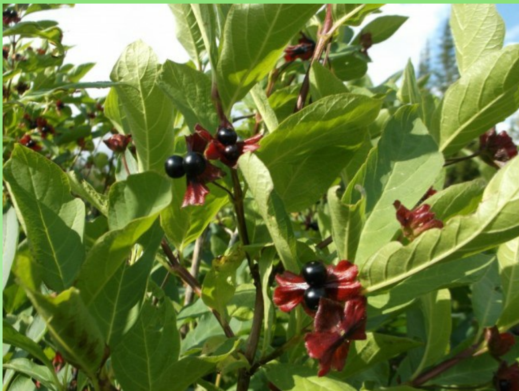
Рис. 2 Образец 26K L. involucrata .