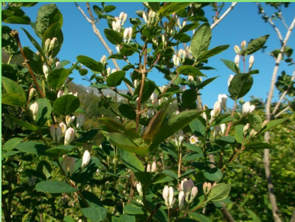
Рис. 3. Образец 29К L. korolkowii var. zabelii .