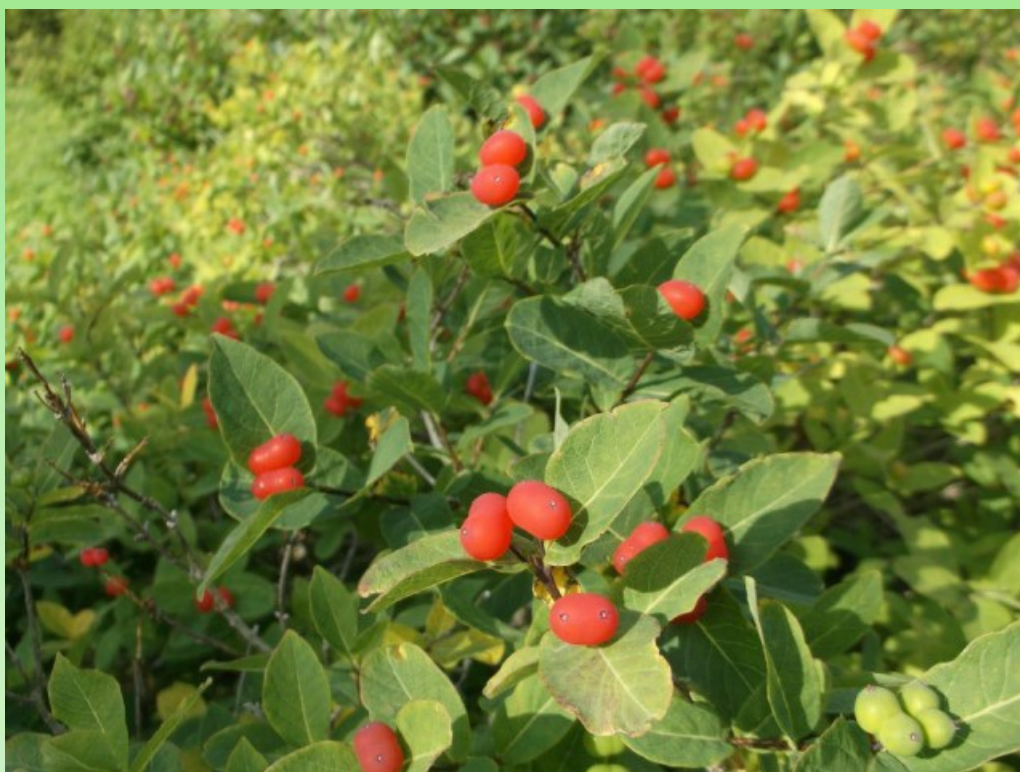
Рис. 1 Образец 15K L. chamissoi .

I группа (вполне жизнеспособные / вполне перспективные) включает в себя 12 образцов (рис. 1). Растения из указанной группы произрастают как в г. Кировск (4 образца), так и г. Апатиты (8 образцов). Растения жимолости в группе I характеризуются ежегодным приростом в высоту, полным одревеснением годичных побегов, высокой зимостойкостью, благодаря этому, образцы сохраняют жизненную форму. Крона правильно сформирована, в незначительном количестве присутствуют сухие ветви. Цветение и плодоношение наблюдается ежегодно, длительность цветения 5-10 дней, плоды удовлетворительного вида с гладкой поверхностью, без повреждений, семена вызревают нерегулярно, требуется искусственный посев семян, возможно размножение черенкованием.