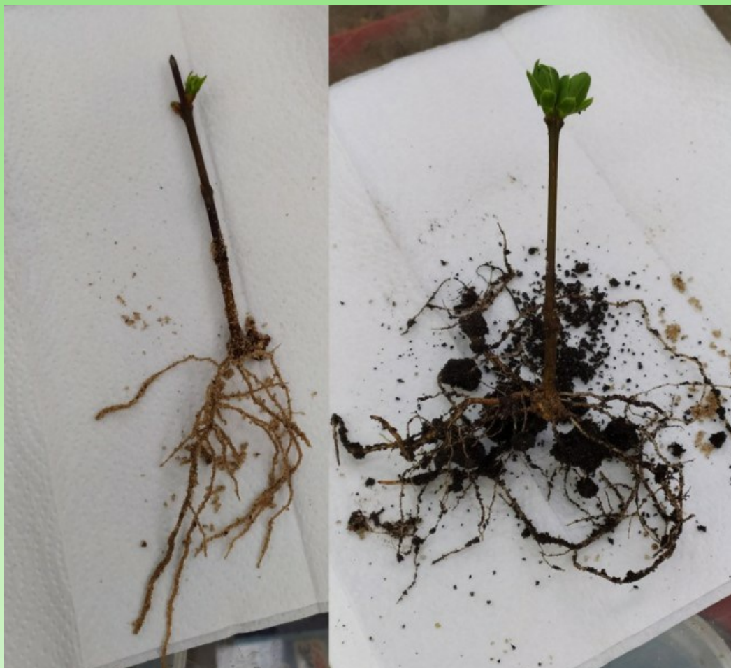
Рис. 7. Развитые корни черенков.

начинают активно использовать стимуляторы роста и удобрения, способом внесения по листу. Агромастер 15-11-15 (д.в. NPK + микроэлементы ) 0,2 % раствором, через 10 дней, Powerful Amino Вегетативный (N-16,5 %, P 2 O 5 -7,6 %, K 2 O-11,7 %) 0,1 % раствором, через 10 дней Powerful Amino Calmag SL (Аминокислоты - 33,5 %, MgO - 2,7 %, CaO - 6,7 %) 0,2 %, Агромастер 3-37-37 (д.в. NPK + микроэлементы ) 0,2 % по листу, силиплант (д.в. кремнийсодержащее минеральное удобрение) 0,2 % раствором. В конце сентября проводим подкормку монофосфатом калия 0,2 % (д.в. K 2 O =25-33 %, P 2 O 5 =23-50 %).