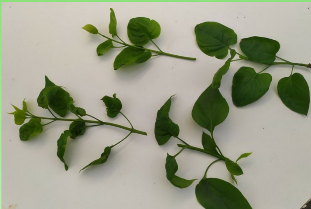
Рис. 2. "Мягкие" верхушки удаляют, используют только нижнюю часть побега.