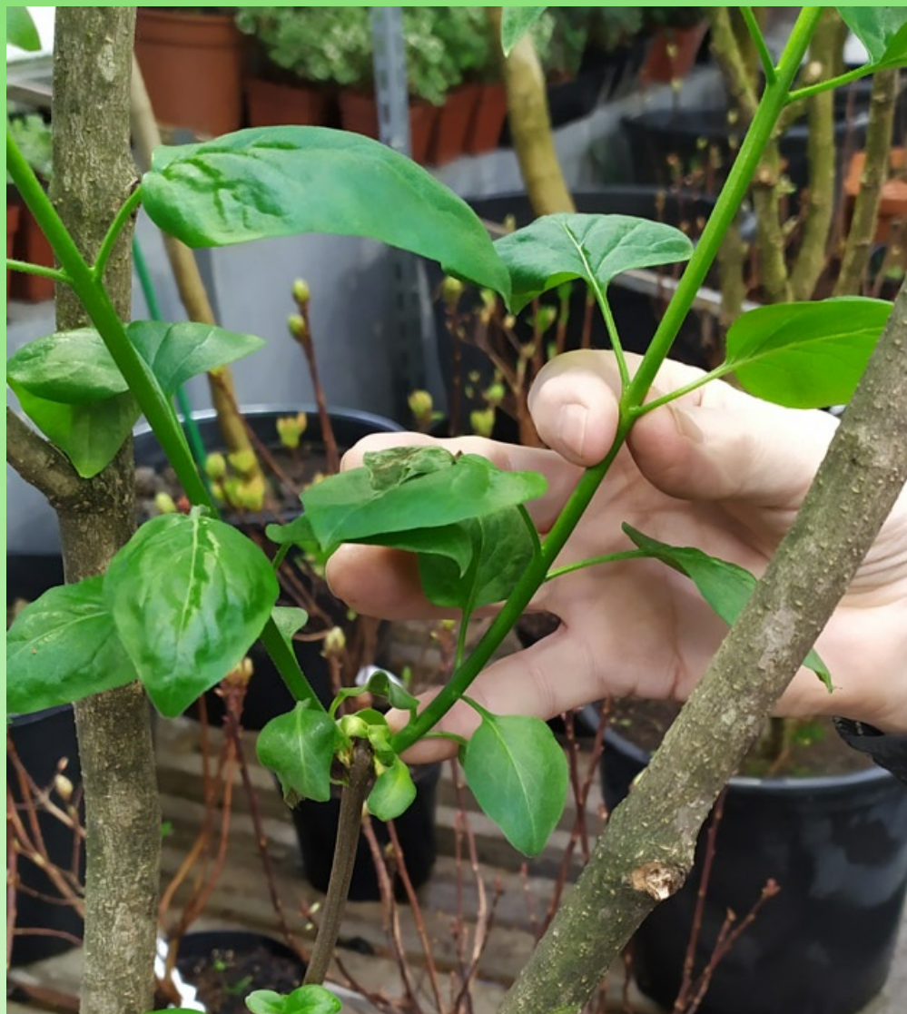
Рис. 1. Черенки сирени берут с одним-двумя междоузлиями.