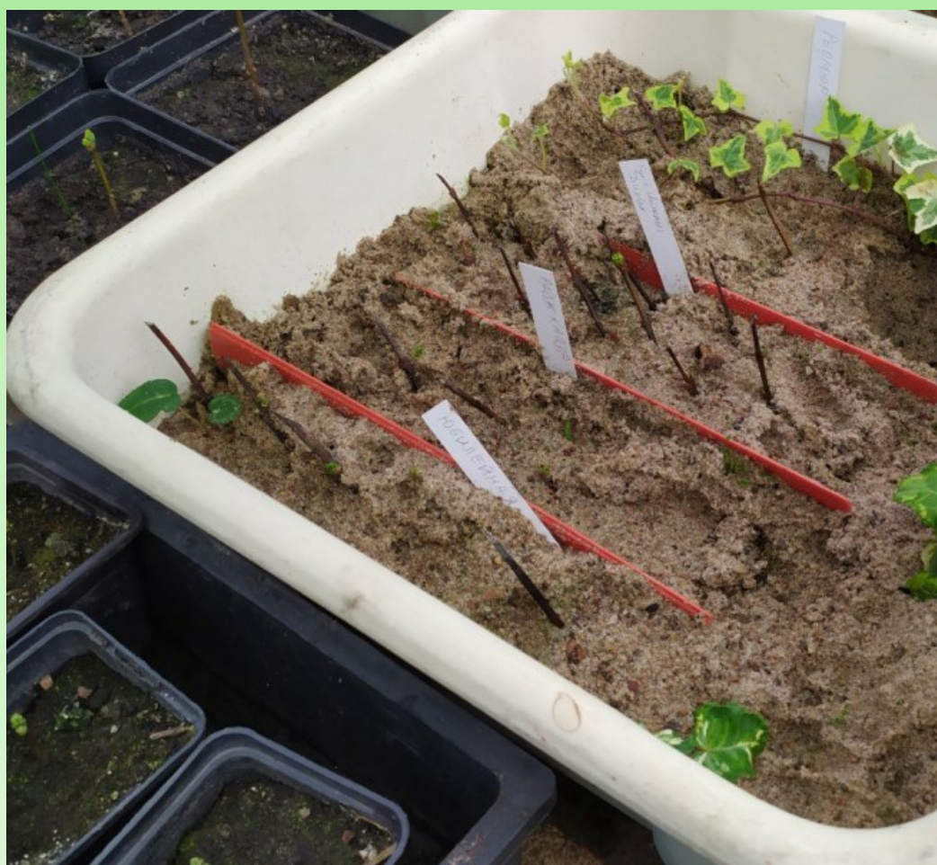
Рис. 5. Посаженные черенки сирени.