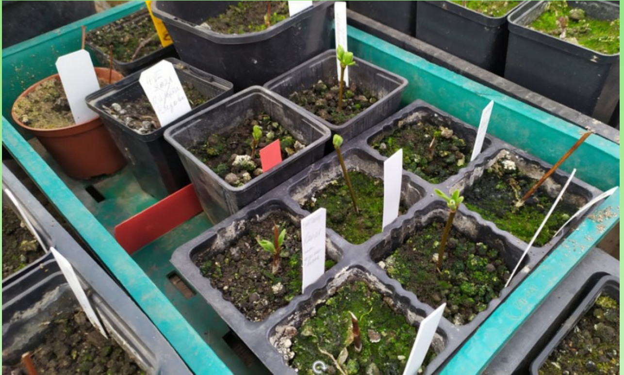
Рис. 6. Черенки, посаженные в горшки.

этом важно и не заливать песок постоянно. За состоянием черенков важно наблюдать каждый день или через день, в зависимости от солнечных дней и температуры. Для усиления развития корневой системы черенков проводят пролив Рибав-экстра 0.1 мл/1 л воды (действующее вещество (д.в.): 0,00152 г/л L-аланина + 0,00196 г/л L-глутаминовой кислоты).