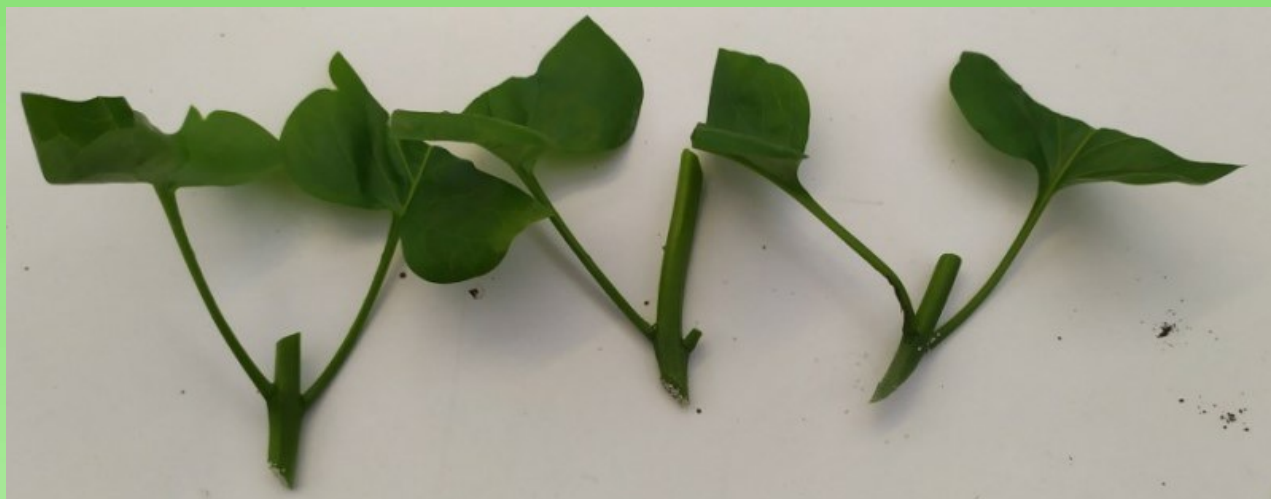
Рис. 4. Заготовленные черенки сирени, готовые для посадки.