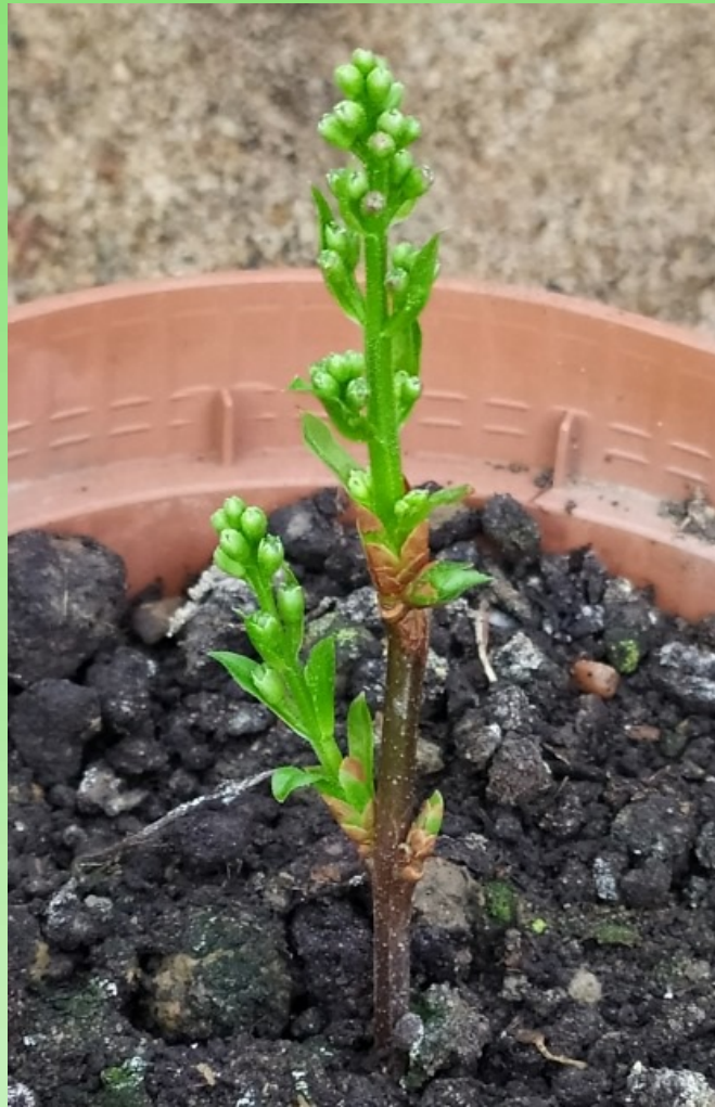
Рис. 9. Перерождение вегетативной почки в генеративную.