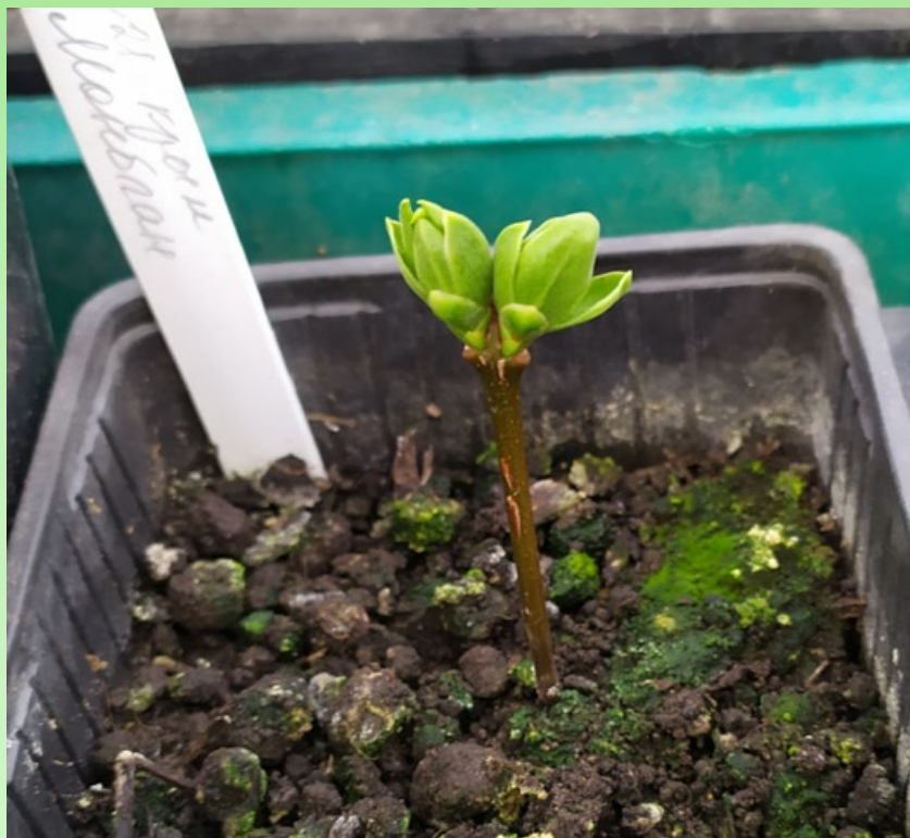
Рис. 8. Черенок сирени сорт Монблан, готовый для перемещения в открытый грунт.

Зимой неплохо черенкуются многие сорта сирени обыкновенной. Но наиболее успешно – белоцветковые сорта.