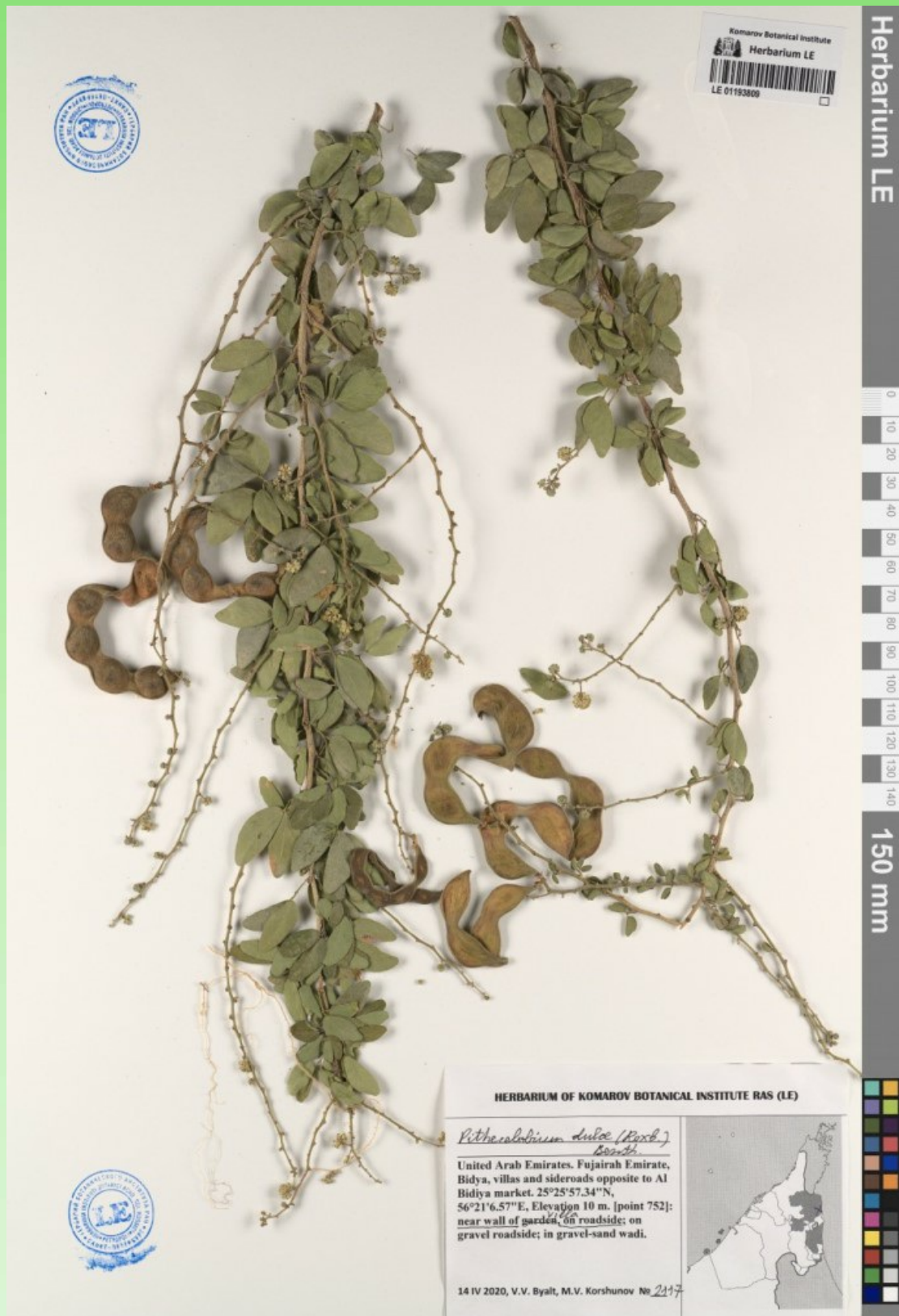
Рис. 10. Гербарный образец Pithecellobium dulce (Roxb.) Benth. хранящийся в LE