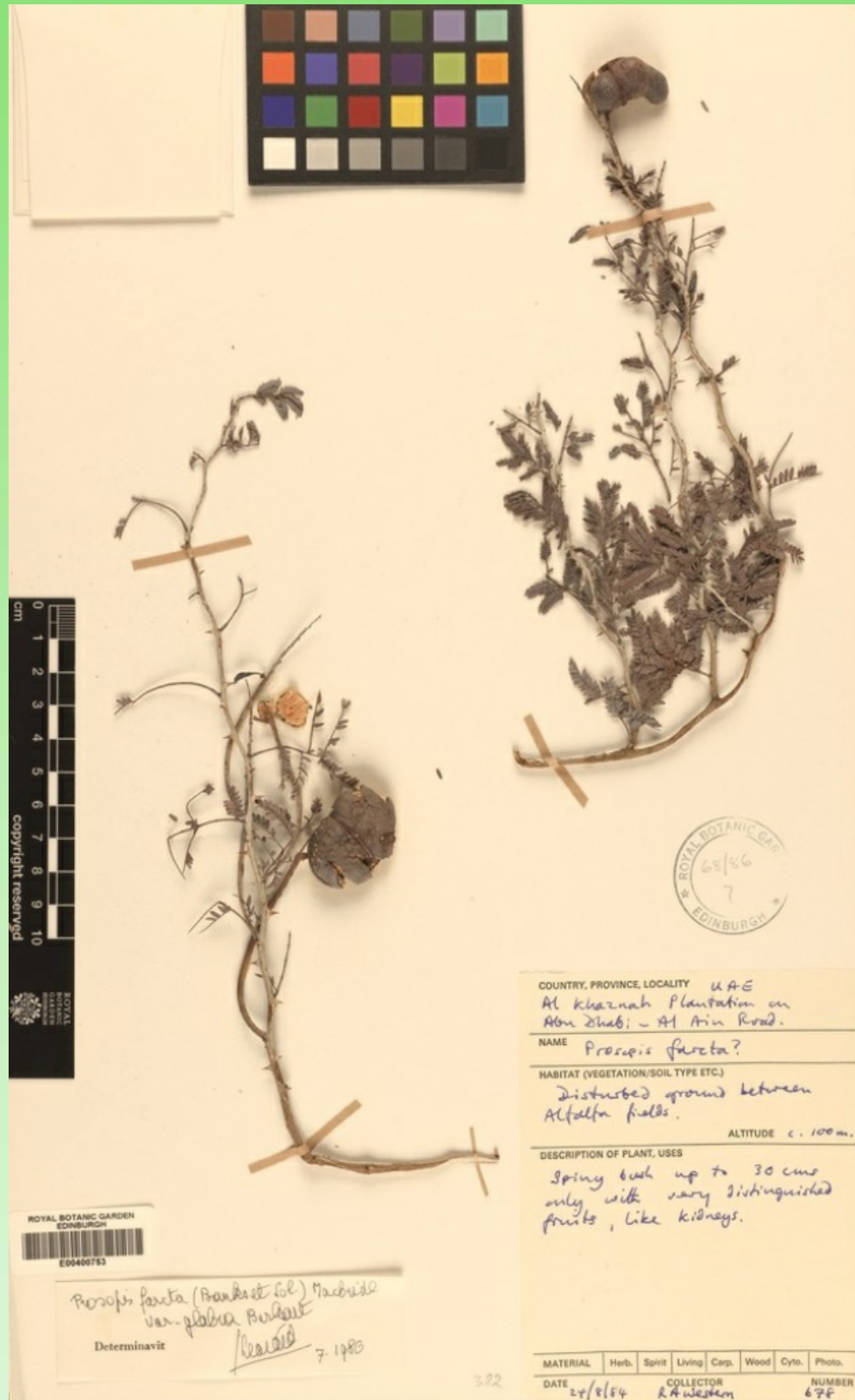
Рис. 11. Гербарный образец Prosopis farcta (Banks & Sol.) Macbr. из ОАЭ в Гербарии Е (E00400753)