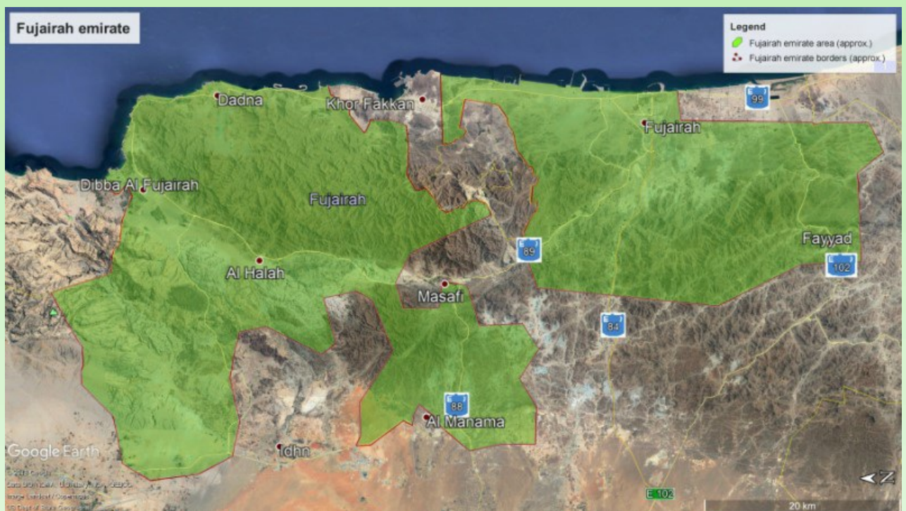
Рис. 2. Карта эмирата Фуджейра (Google Maps, с изменениями)