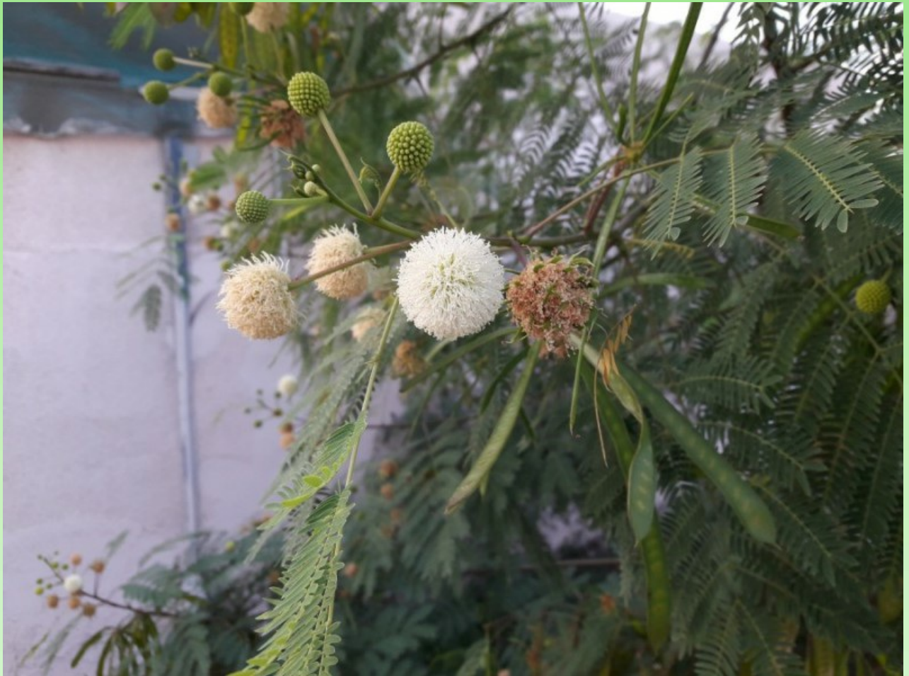
Рис. 8. Одичавшая в переулке Leucaena leucocephala (Lam.) de Wit

Цветение: март-июль, плодоносит: август-октябрь. Рис. 8.