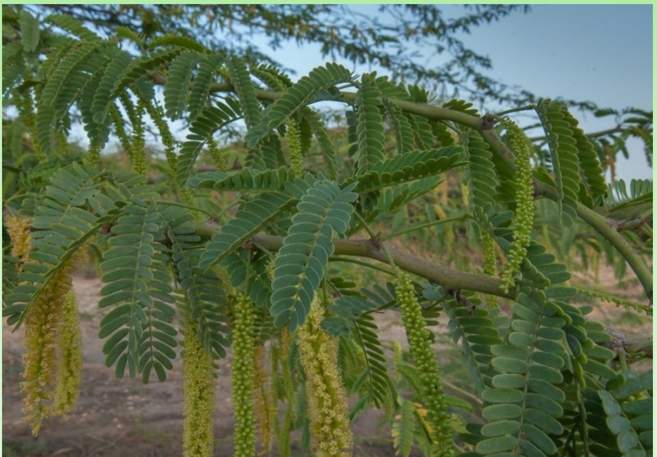
Рис. 12. Prosopis juliflora (Sw.) DC. в полном цвету

Цветение: октябрь–январь и март–июнь. Рис. 12.