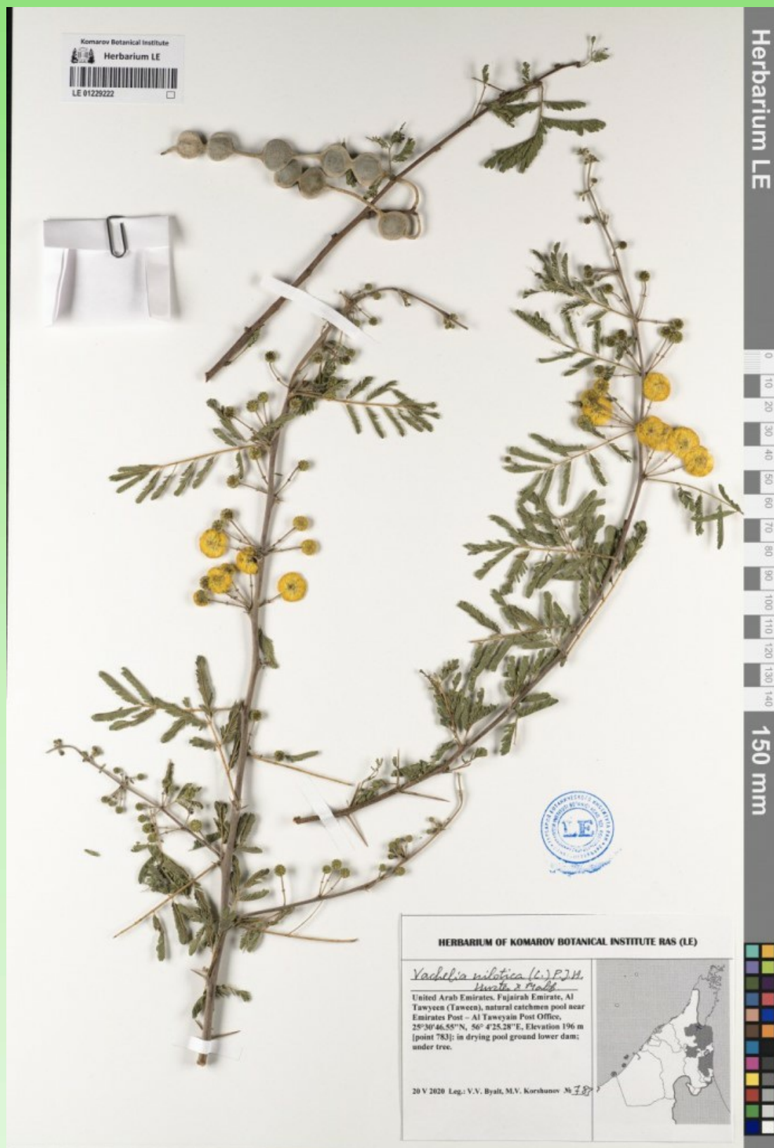
Рис. 4. Гербарный образец Acacia nilotica (L.) Delile ( Vachellia nilotica ) в Гербарии LE.

качестве корма для животных, в народной медицине и корма для беспозвоночных, а также в качестве топлива и для получения некоторых продуктов питания (POWO, 2022).