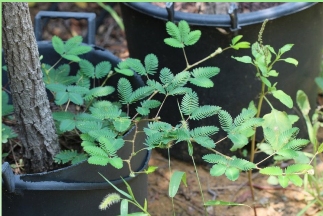
Рис. 9. Сорная Mimosa pudica L. в горшке с культивируемым для продажи деревом в питомнике растений в Аль Бидии

Lectotypus (Brenan, 1955: 208): «Herb. Clifford: 208, Mimosa 3, excl. inflorescences» (BM).