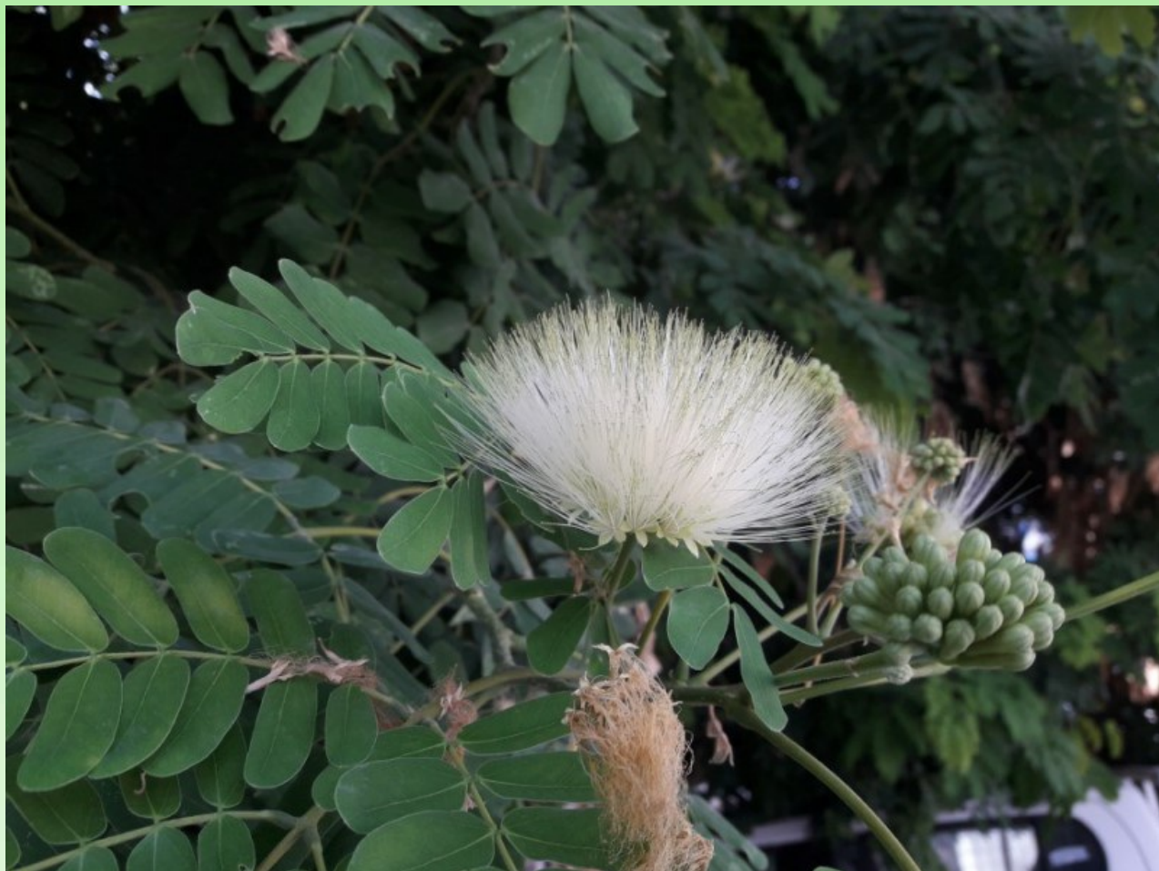
Рис. 6. Цветки Albizia lebeck (L.) Benth.

Чужеродный культивируемый и адвентивный вид (эргазиофигофит, эпёкофит, неофит). – В природе растет в основном в сезонно засушливых тропических биомах. Он используется в качестве корма для животных, яда и лекарства в народной медицине, а также в качестве топлива и для получения продуктов питания (POWO, 2022). Это растение часто выращивают как придорожное дерево, используют в рекреационных и декоративных целях (быстрорастущее растение дает отличную тень на улицах, в садах и парках, красиво цветёт), и для производства древесины. Древесина напоминает грецкий орех и отлично подходит для изготовления мебели, рам для картин, строительства домов, каноэ и т. д. Она также используется для дробилок тростника, маслобойных заводов и колес (Ali, 1973; http://www.efloras.org/florataxon.aspx?flora_id=5&taxon_id=200011877 ). Хорошо переносит засоление (Karim, Dakheel, 2006) и периодические сильные засухи, при этом сбрасывает листья.