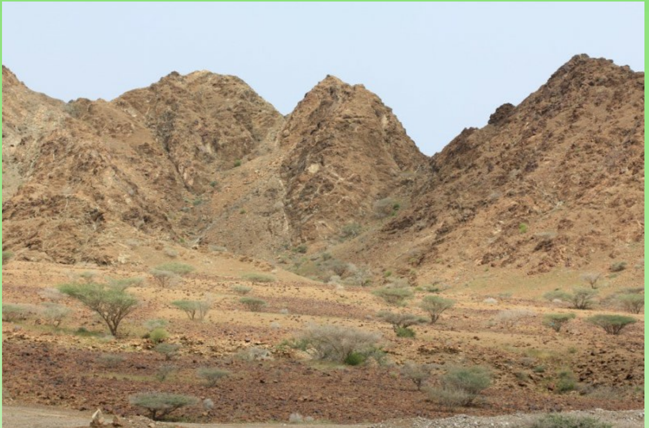
Рис. 1. Акациевое редколесье из Acacia tortilis в подножии гор Ходжар.