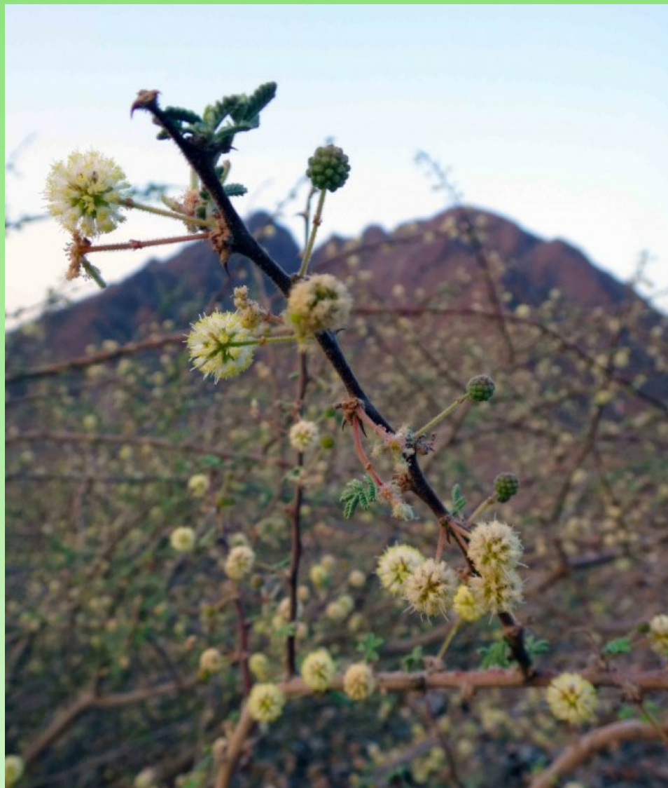
Рис. 5. Цветущая Acacia tortilis (Forssk.) Hayne

Цветение и плодоношение: март– начало июня, плоды созревают в июне– июле. Рис. 1.