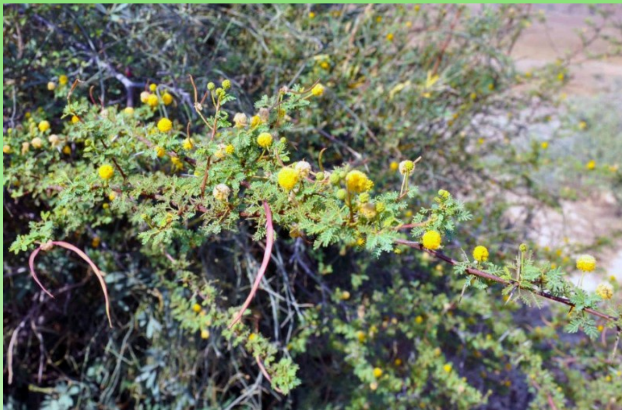
Рис. 3. Цветущая Acacia ehrenbergiana Hayne в Фуджейре.