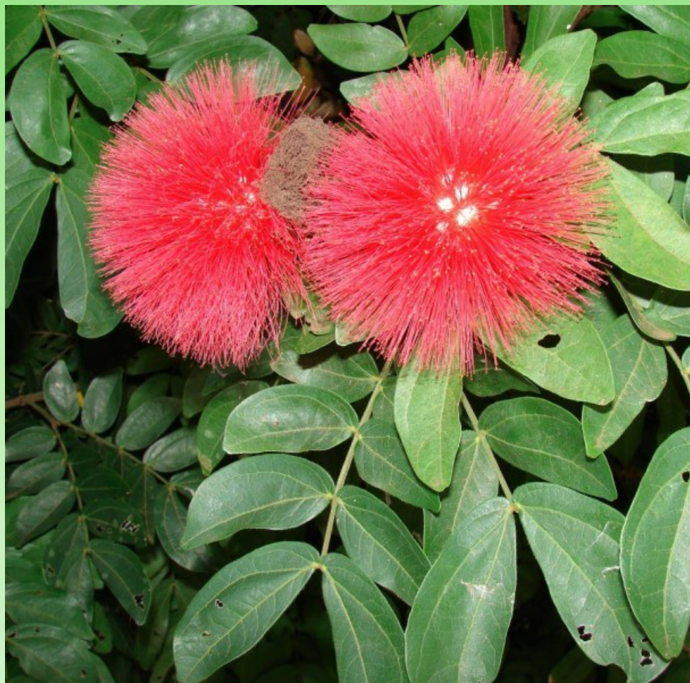
Рис. 7. Цветки Calliandra haematocephala Hassk.

8. * Calliandra haematocephala Hassk. 1855, in Retzia 1: 216. – Feuilleea haematocephala (Hassk.) Kuntze, 1891, Revis. Gen. Pl. 1: 188. – Anneslia haematocephala (Hassk.) Britton & P. Wilson, 1926, Sci. Surv. Porto Rico & Virgin Islands, 6: 348. – Прекраснотычиночник кровавоголовый, red powder puff (англ.), Pomprón (исп.).