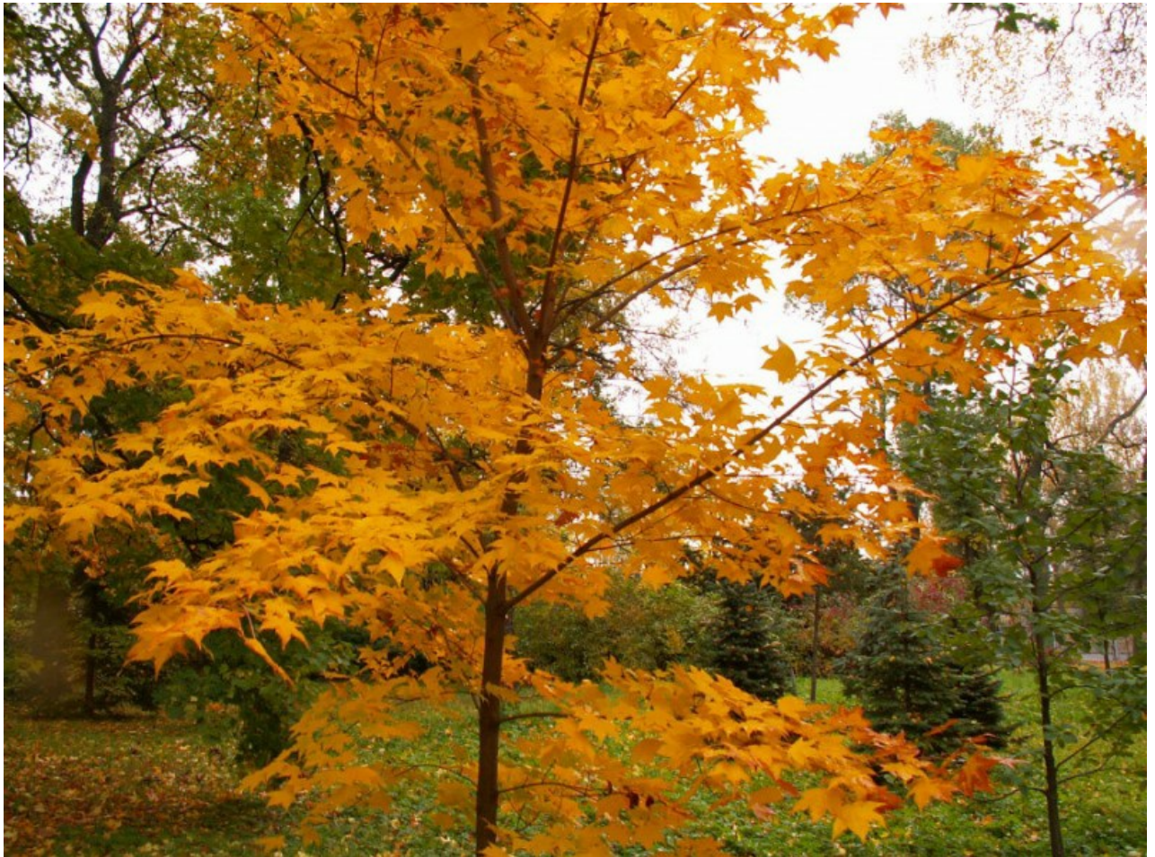
Рис. 3. Acer mono Maxim. f. mono в парке БИН РАН осенью.

7) На участке 94: растение из экспедиции Сада в Приморский край в сентябре 1997 г., Надеждинский район, р. Нежинка, ~350 м н.у.м., горная тайга (недалеко от китайской границы), посадка 2005 г. Только этот экземпляр имеет яркую пурпурно-красную окраску осенью (так повторяется каждый год), все остальные жёлтые (Рис. 3).