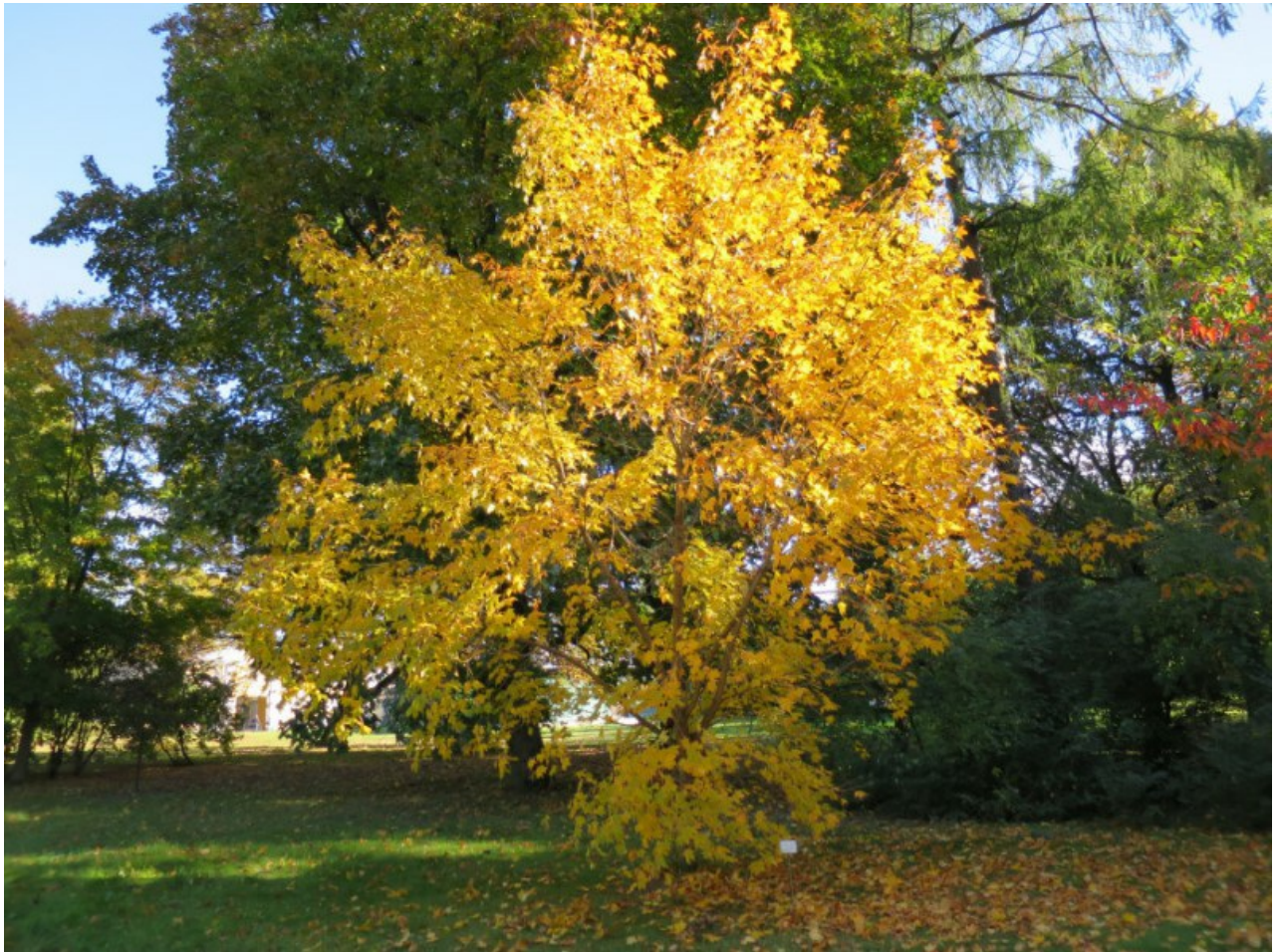
Рис. 2. Acer mono Maxim. f. mono в парке БИН РАН на уч. 145 осенью.

отличается высокими физико-механическими свойствами, мало коробится, стоит наравне с древесиной клёна остролистного, используется для изготовления фанеры и мебели. Морозобойные трещины встречаются редко. Хороший медонос. Красивое парковое дерево, устойчивое к болезням и вредителям, заслуживает более широкого распространения в наших парках. В городских насаждениях Санкт-Петербурга почти не встречается. Например, в городе растёт "Дерево Арескина", экземпляр клёна мелколистного из природы российского Дальнего Востока, которое было посажено Г. А. Фирсовым и Н. В. Лаврентьевым вместе с местными жителями Петроградского района во дворе дома на Съезжинской улице 15 мая 2010 г. в память о Роберте Карловиче Арескине, основателе Ботанического сада Петра Великого.