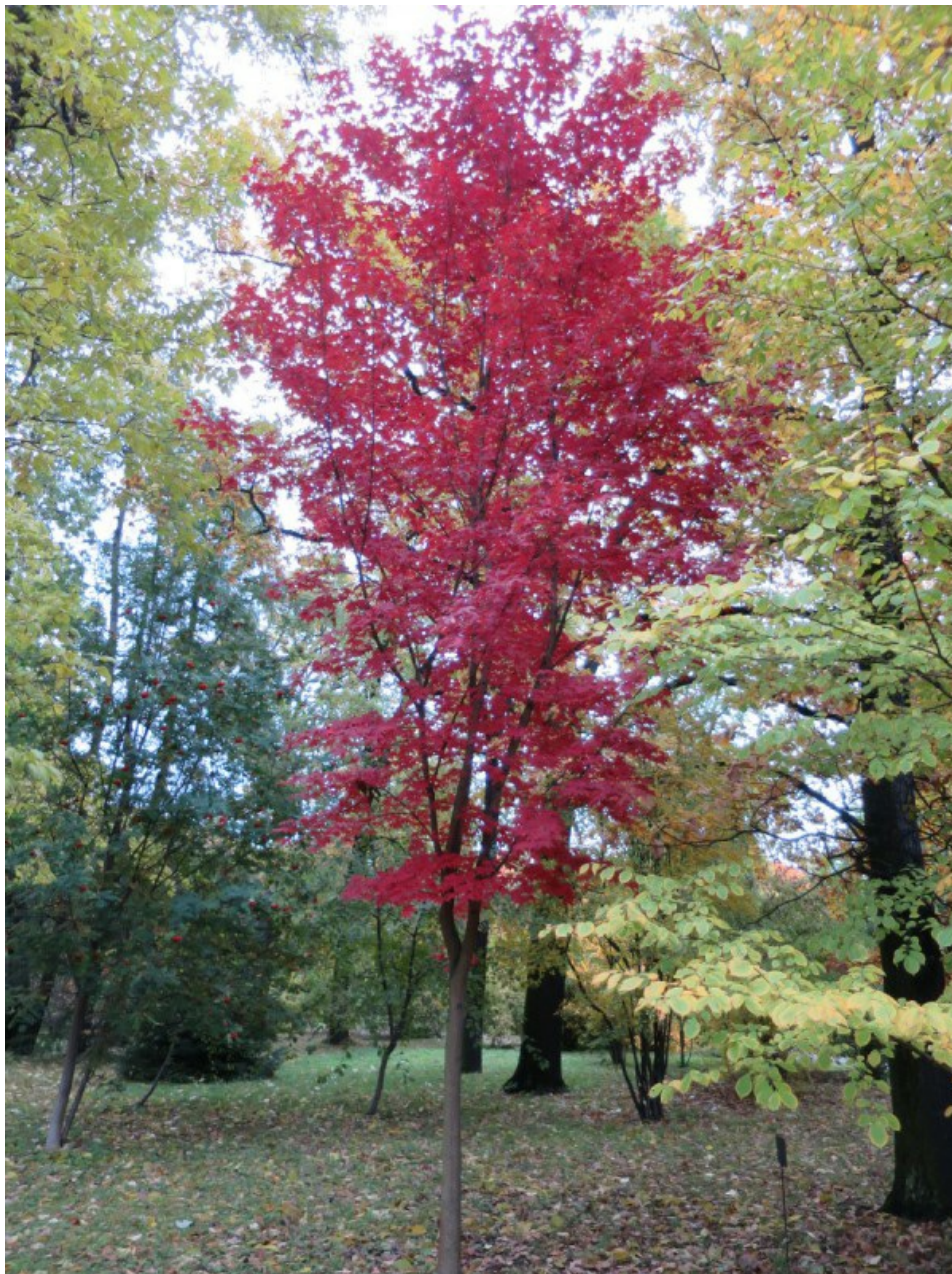
Рис. 5. Acer mono Maxim. f. purpureum Byalt & Firsov в парке БИН РАН на уч. 94 осенью.

как Acer platanoides 'Royal Red' и, в отличие от них, устойчиво к мучнистой росе листьев. Сезонная динамика развития синхронизирована с динамикой времён года на Северо-Западе России, каждый год дерево успевает закончить вегетацию и подготовиться к зимовке. Случаи обмерзания отсутствуют. Весной и летом окраска листьев обычная зелёная, как у других деревьев этого вида.