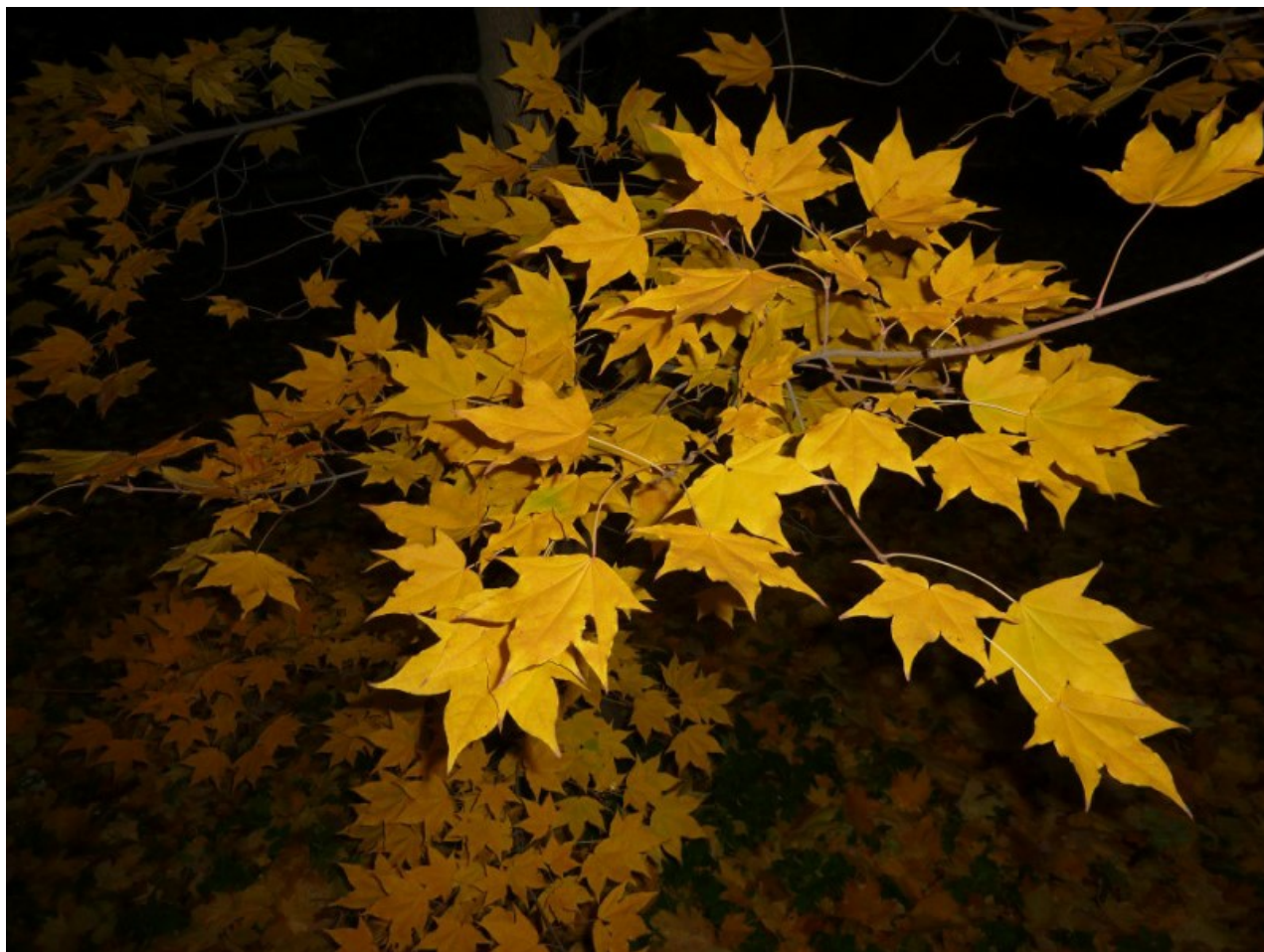
Рис. 4. Acer mono Maxim. f. mono в парке БИН РАН осенью (фото со вспышкой).