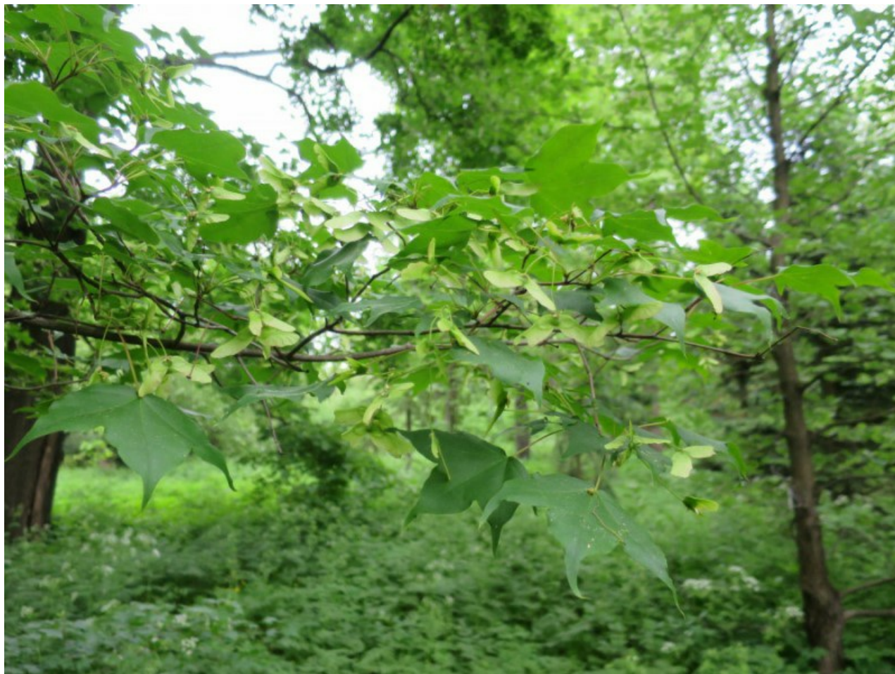
Рис. 1. Мелколистный клён ( Acer mono Maxim.) в парке БИН РАН летом.

В Саду выращивался с перерывами, начиная с 1861 г.: 1861-1870, 1889-1939, 1954 - по настоящее время (Связева, 2005). Введён в культуру Ботаническим садом БИН (Липский, Мейсснер, 1913-1915; Рис. 1).