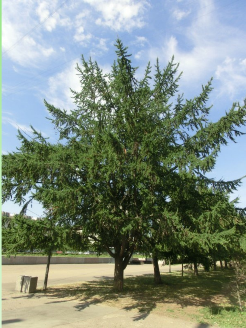
Рис. 2. Larix sibirica Ledeb. f. candelabriformis L. V. Orlova, V. V. Byalt et G. A. Firsov в июне 2023 г..

семеносят и не обмерзают, образуют нормальный прирост. Ближайшее соседнее дерево в ряду – в 5 метрах от этого дерева. Это необычное дерево было обнаружено нами несколько лет назад. Попытка привить его почки на типовую лиственницу оказалась вполне успешной, и молодые растения уже начали формировать канделябровидную крону как и материнское дерево. Это свидетельствует о том, что признак канделябровидной кроны закреплён генетически, а не является случаем уродливого формирования кроны при повреждении верхушечной почки.