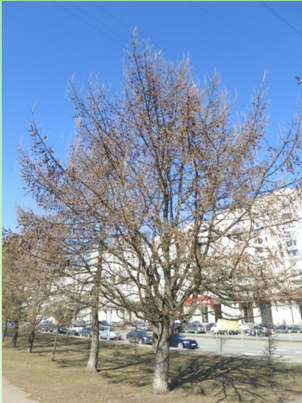
Рис. 3. Larix sibirica Ledeb. f. candelabriformis L. V. Orlova, V. V. Byalt et G. A. Firsov в апреле 2019 г..

результате мы предлагаем назвать эту форму Larix sibirica Ledeb. f. candelabriformis L. V. Orlova, V. V. Byalt et G. A. Firsov forma nova. Сейчас это дерево высотой 10,5 м, диаметр ствола 45 см (на высоте 88 см, у развилки и ответвления первой крупной скелетной ветви), крона 10×12,5 м. Возраст около 40 лет. Близ верхушки главный ствол почти не выражен. Крона широко-яйцевидная, почти правильная, ширина превосходит высоту дерева, за счёт отдельных, далеко выдающихся ветвей. Верхушки их торчат преимущественно вверх. Штамб 88 см (как уже сказано) и далее, на протяжении двух метров вверх по стволу, образуется 12 крупных скелетных ветвей, диаметром у основания от 10 до 21 см. Эти ветви растут в разные стороны света, они дуговидно изогнуты при основании, направлены косо вверх и немного в стороны и образуют почти правильную шаровидную крону. На дереве много шишек. Так же, как и опавших под деревом.