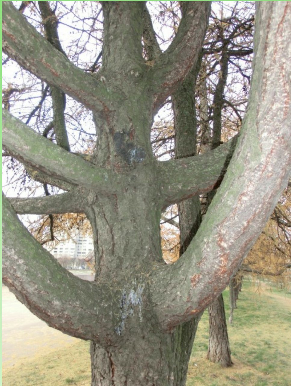
Рис. 5. Нижняя часть ствола Larix sibirica Ledeb. f. candelabriformis L. V. Orlova, V. V. Byalt et G. A. Firsov на уровне основных скелетных ветвей.