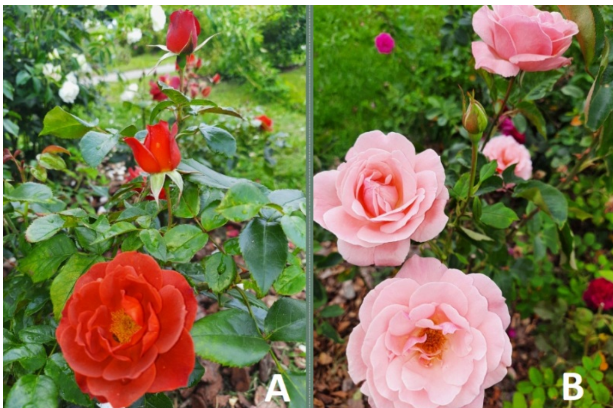
Рис.3. Сорта роз, изменяющие окраску цветков: А - ' Hot Chocolate '; В - ' Lacre '.

Розы, изменяющие цвет лепестков в процессе цветения, представлены 2-мя сортами (рис. 3).