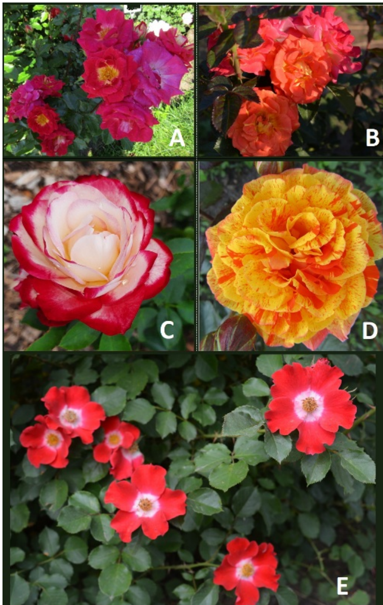
Рис. 2. Сорта роз группы флорибунда с двухцветной окраской: А - ' Attraction '; В - ' Oranges Rumba '; С - ' Jubile du Prince de Monaco '; D - ' Oranges and Lemons '; E - ' Eye Paint '.

Окраска цветков у роз флорибунда самая разнообразная, что достигнуто в результате многочисленных скрещиваний. Среди исследованных нами роз, были сорта с красным, розовым, белым, желтым и оранжевым окрасом цветков.