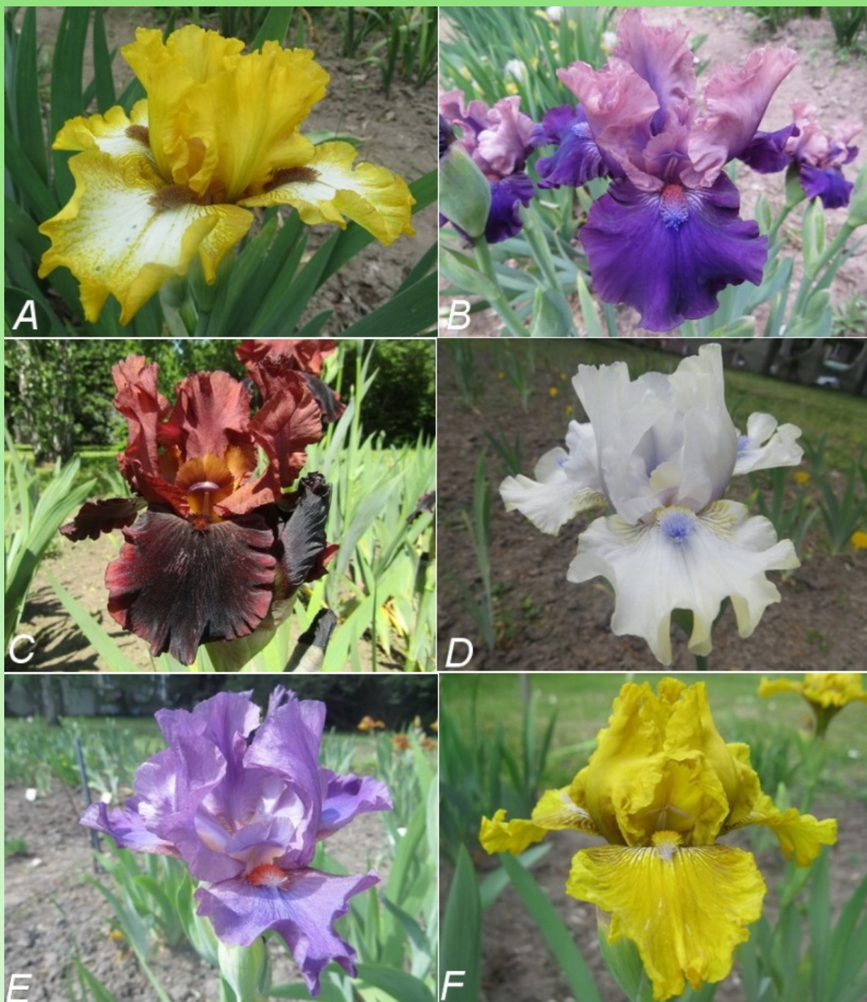
Рис. 2. Среднерослые сорта: А – 'Local Hero', В – 'Nod Yes', С – 'Plasma', D – 'Tickle the Ivories', E – 'Wind Spirit', F – 'Yallah'.

красные с синими кончиками. Аромат приятный (рис. 2B).