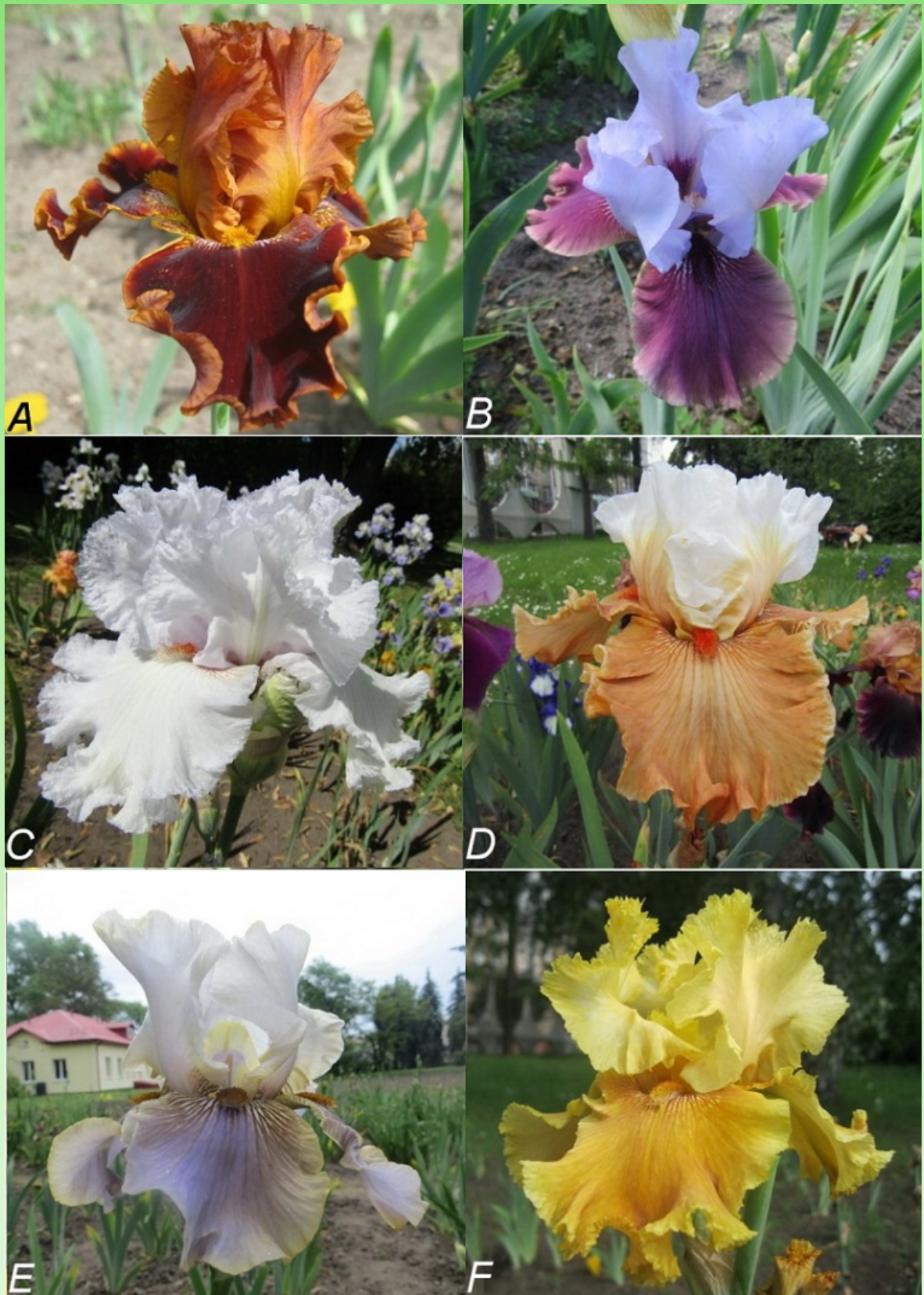
Рис. 3. Высокорослые сорта: А – ‘Copatonic’, В – ‘Electrique’, С – ‘Feather Boa’, D – ‘Ginger Ice’, E – ‘Green and Gifted’, F – ‘Honey House’.