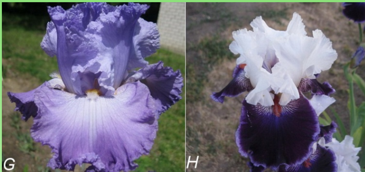
Рис. 3. Высокорослые сорта: G – ‘Our House’, H – ‘Royal Orders’.