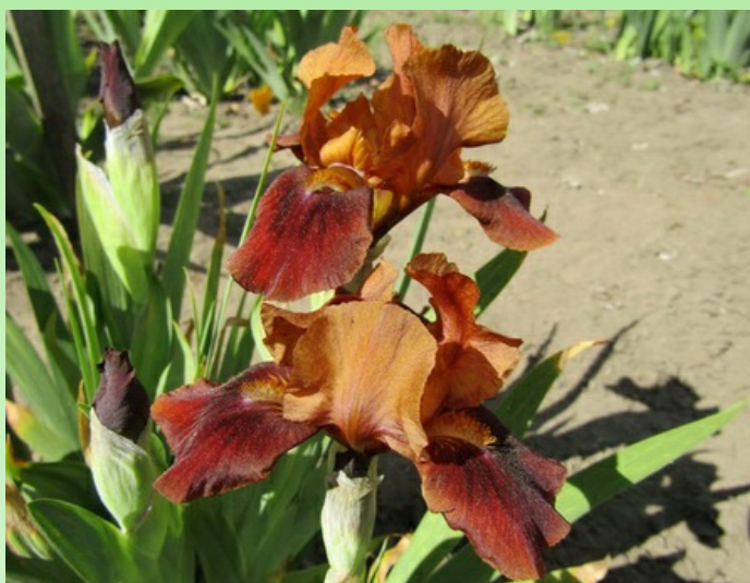
Рис. 1. Стандартные карликовые сорта: 'Spice Sister'.

' Spice Sister ' (2003, В. Blyth). Раннесредний. Цветки с волнистыми долями. Внутренние доли образуют полусвод, светло-коричневые (медовые), наружные – полуопущенные, бордово-коричневые, окраска сгущается к центру, бархатистые, основание бордовое с желтыми и белыми жилками. Ветви столбика темно-желтые с коричневыми надрыльцевыми гребнями и лиловой зоной вдоль центральной жилки. Бородки темно-желтые с белой основой. Аромат средний, приятный (рис. 1).