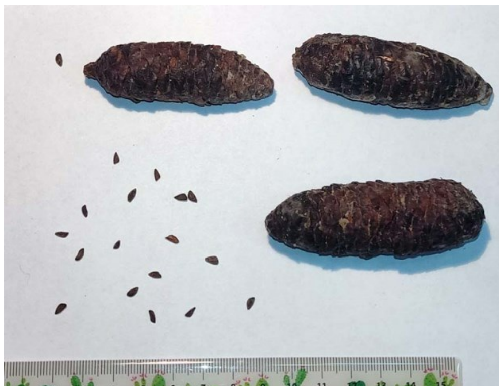
Рис. 5. Шишки и семена Picea schrenkiana Fisch. et C.A. Mey.

В настоящее время в коллекции Сада есть 4 экз. на участках 77 и 127 (два образца, из 3 шт.). Уч. 127 № 23 (2 экз.): семена из Киевского ботанического сада, Украина, всх. 20.05.1954 г., пос. 4.05.1966 г. (Головач, 1980). Деревья посажены близко одно к одному, и одно из них явно отстало в росте от другого. Само место посадки хорошее, достаточно светлое, у края широкой дорожки. Другими соседними деревьями не затеняются и не угнетаются.