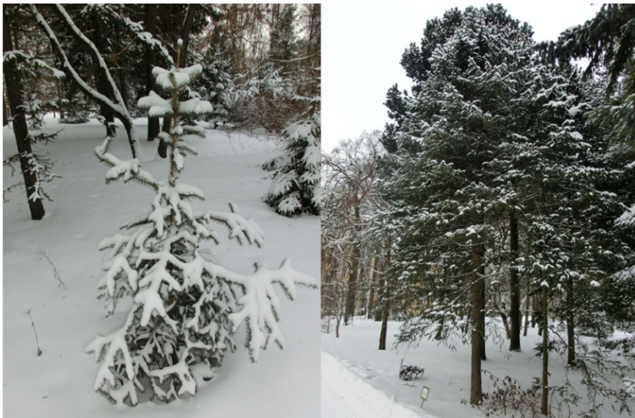
Рис. 3, 4. Picea schrenkiana Fisch. et C.A. Mey. (Pinaceae) в Ботаническом саду Петра Великого