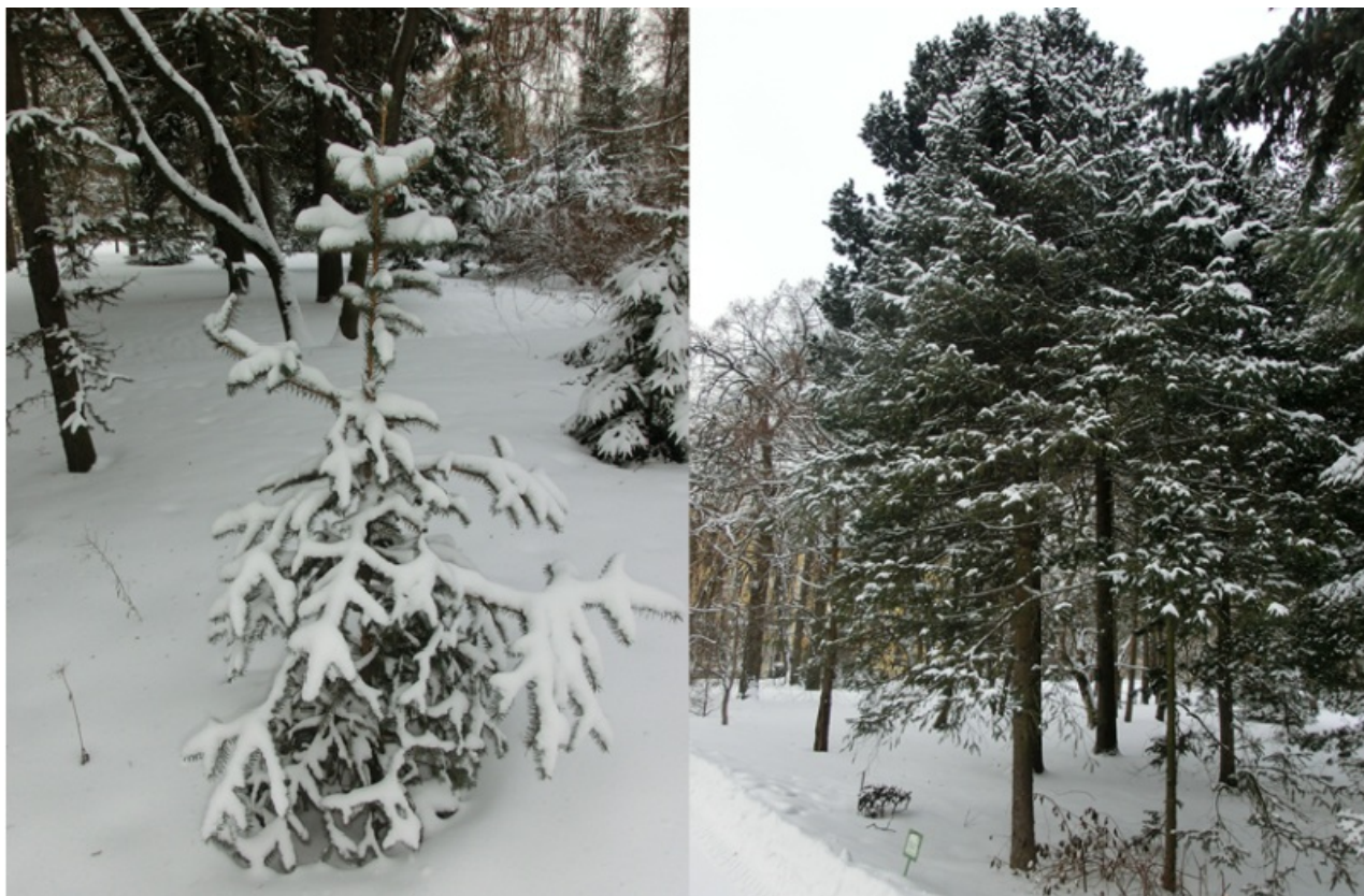
Рис. 3, 4. Picea schrenkiana Fisch. et C.A. Mey. (Pinaceae) в местах Ботаническом саду Петра Великого