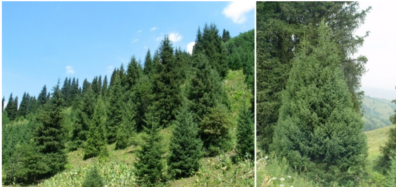
Рис. 1, 2. Picea schrenkiana Fisch. et C.A. Mey. (Pinaceae) в местах естественного произрастания (Заилийский Алатау, Казахстан)

Ель Шренка – Picea schrenkiana Fisch. et C.A. Mey. (семейство Сосновые, Pinaceae) была описана ботаниками Императорского Санкт-Петербургского Ботанического сада Ф.Б. Фишером и К.А. Мейером по гербарным сборам известного путешественника А.И. Шренка в Джунгарском Алатау (рис. 1, 2). Ареал вида охватывает значительные территории в Казахстане, Киргизии и Китае (Jin-Hua Ran et al., 2006; Auders, Spicer, 2012; Huo et al., 2017).