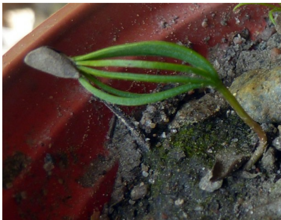
Рис. 8. Проросток Picea schrenkiana Fisch. et C.A. Mey.