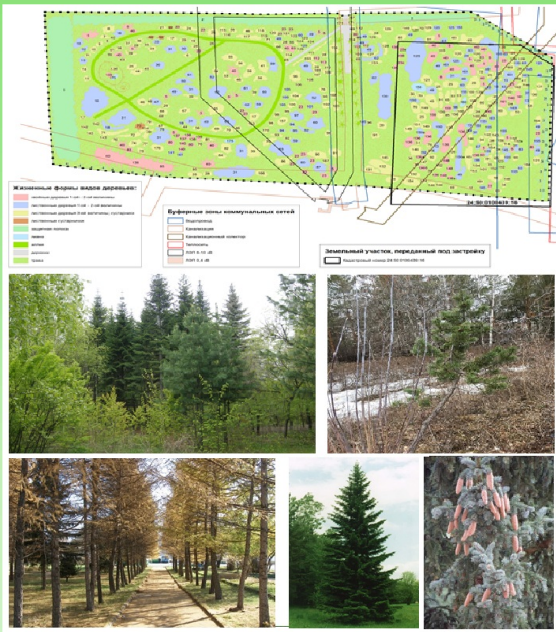
Рис. 1. Карта-схема Дендрария (а) и интродуцированные виды хвойных (б): A. sibirica Ledeb., P. sibirica Du Tour, L. sibirica Ledeb., P. obovata Ledeb., P. mugo Turra (широко распространена в горных системах Европы: в Пиринеях, Альпах, Апеннингах, Абрुццах, Балканах, Карпатах, на высотных уровнях от 200 до 2700м над ур. м., в Сибири вид проявляет высокую морозостойкость семеносит практически во всех интродукционных пунктах). Карта схема Дендрария создана сотрудниками лаборатории ГИС-технологий Института леса СО РАН (Михайлова И.А., Корец М.А.) на основе плана Р.А. Лоскутова и съемки М.И. Седаевой, М.А. Кириенко.

Fig. 1. Schematic map of the Arboretum (a) and introduced conifer species (b): Abies sibirica Ledeb., Pinus sibirica Du Tour, Larix sibirica Ledeb., Picea obovata Ledeb., Pinus mugo Turra (widely distributed in mountain systems of Europe: in the Pyreneae, Alps, Apennines, Abruzzes, Balkans, Carpathians, at altitudinal levels from 200 to 2700m above sea level, in Siberia the species shows high frost resistance seedlings in almost all introduced sites). The map of the Arboretum scheme was created by the staff of the laboratory of GIS-technologies of the Institute of Forestry SB RAS (I.A. Mikhailova, M.A. Korets) on the basis of maps and reconnaissance survey by R.A. Loskutov, M.I. Sedaeva, M.A. Kirienko.