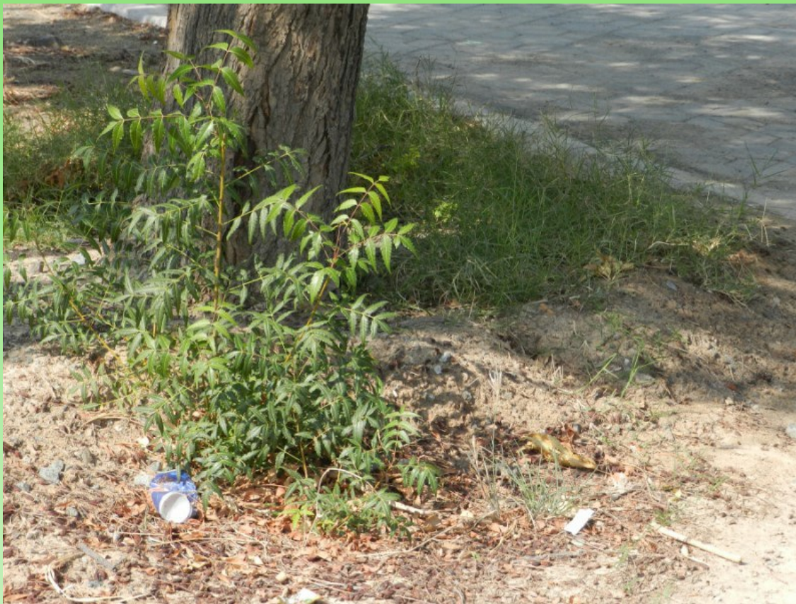
Рис. 9. Самосевный подрост Azadirachta indica (L.) A. Juss. в уличных посадках в Фуджейре.

произошло сильное засоление почв, убившее практически все финиковые пальмы и другие культивируемые растения, но деревья нима выжили.