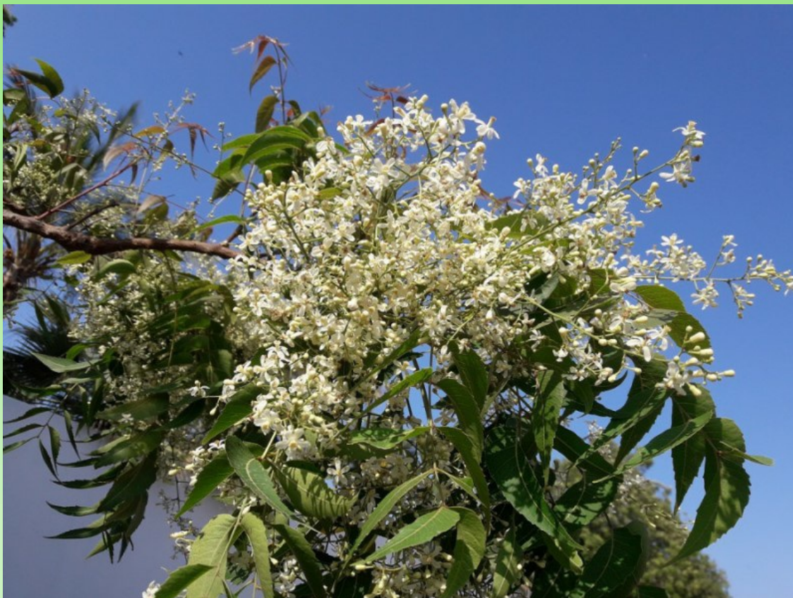
Рис. 7. Azadirachta indica (L.) A. Juss. в полном цвету весной.

Lectotype (Howard, 1988: 582): Herb. Hermann 2: 56, No. 161 (lectotype – BM (/A:000594618)). Т. О. Siddiqi (1983) неправильно указал материал в Herb. Hermann 1:10 (BM) как тип, видимо, перепутав это название с M. azedarach L.