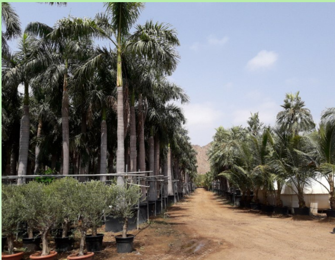
Рис. 2. Типичный питомник растений в Фуджейре (г. Дибба).