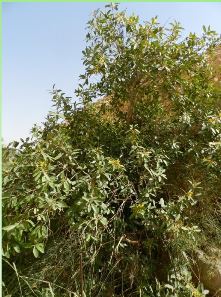
Рис. 3. Кусты Acridocarpus orientalis A. Juss. на склоне вади Тарабат на Джабал Хафите в окр. г. Аль-Айн (эмират Абу-Даби).

Цветение и плодоношение: с апреля по июнь (рис. 3, 4).