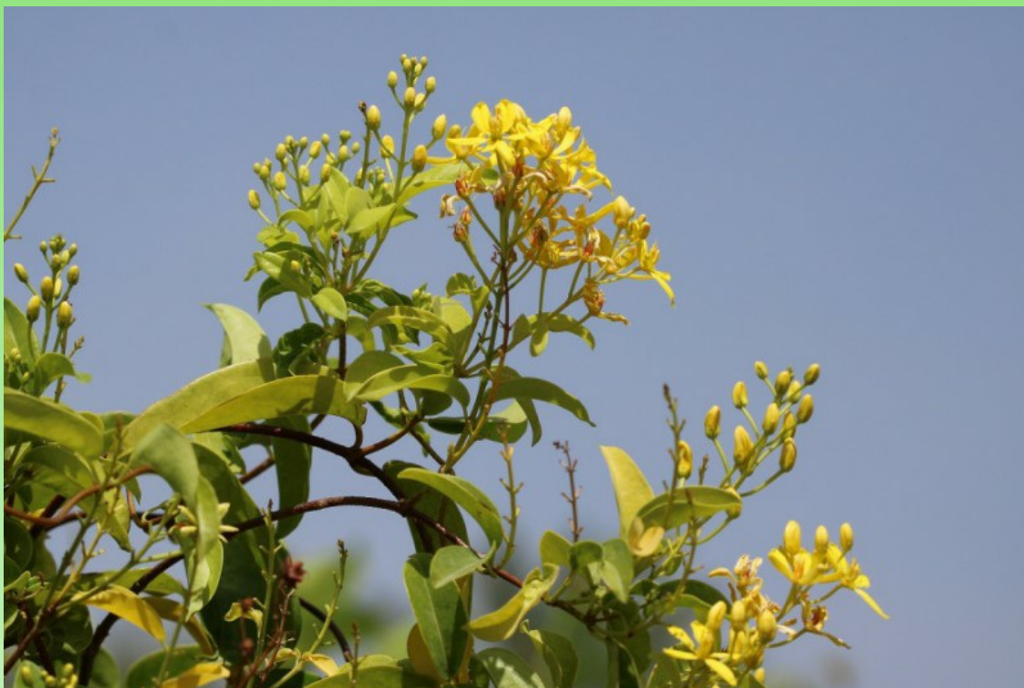
Рис. 6. Tristellateia australasiae A. Rich. в питомнике «Abu Khalid agricultural nursery» в Бидии.

Бидии). Тристеллатея южноазиатская изредка встречается в вертикальном озеленении около частных вилл и отелей. В озеленении улиц и парков мы его не встречали, так как эта лиана требует хорошего ухода и обильного полива. Мы не наблюдали её самосева вокруг посадок, и, видимо, она не является потенциально инвазивной в ОАЭ.