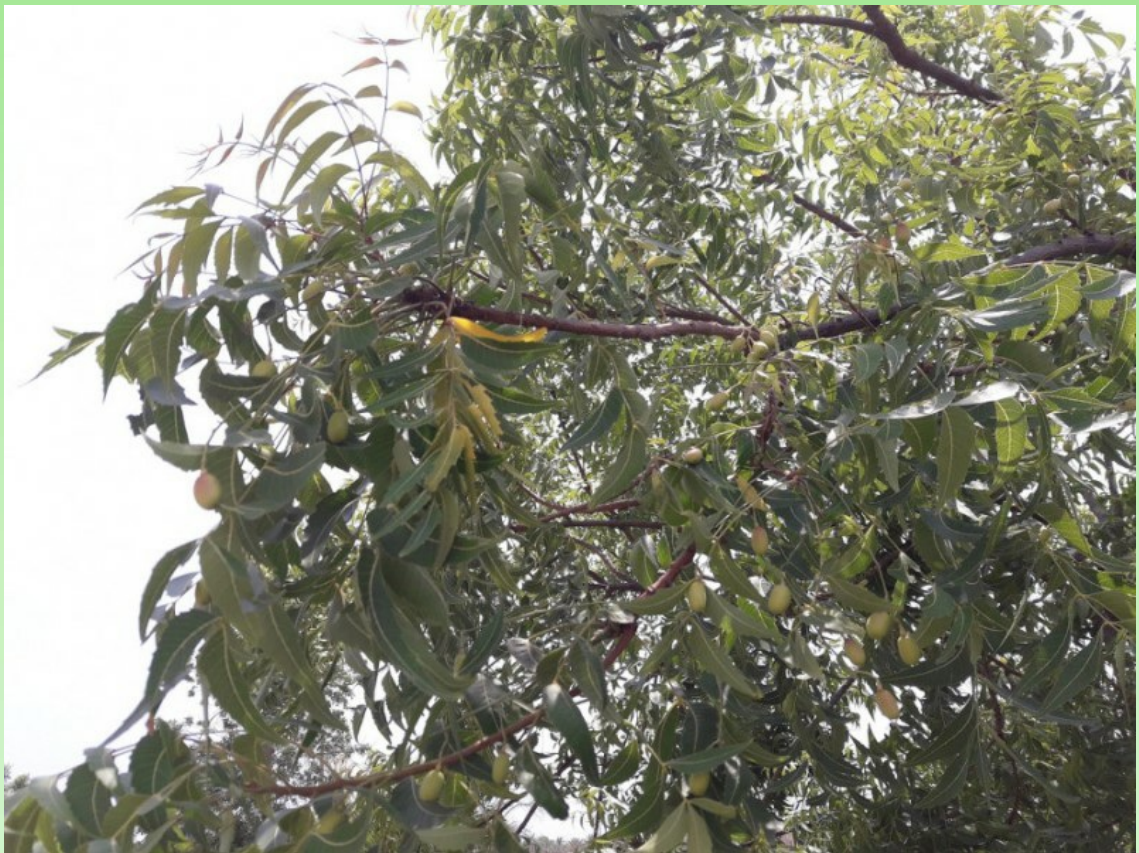
Рис. 8. Azadirachta indica (L.) A. Juss. в плодах летом.

Чужеродный культивируемый и дичающий вид (эргазиофигифит, колонофит/эпёкофит, эунеофит). – В природе встречается в смешанных лиственных и сухих лиственных диптерокарповых лесах, на обочинах дорог, по краям полей, в лесных культурах; обычно на высотах от 50 до 800 м над ур. моря. В Восточной Африке местами натурализовался в открытых зарослях и саванне, где даже начинает доминировать и менять растительные сообщества (Whitehouse et al., 2001).