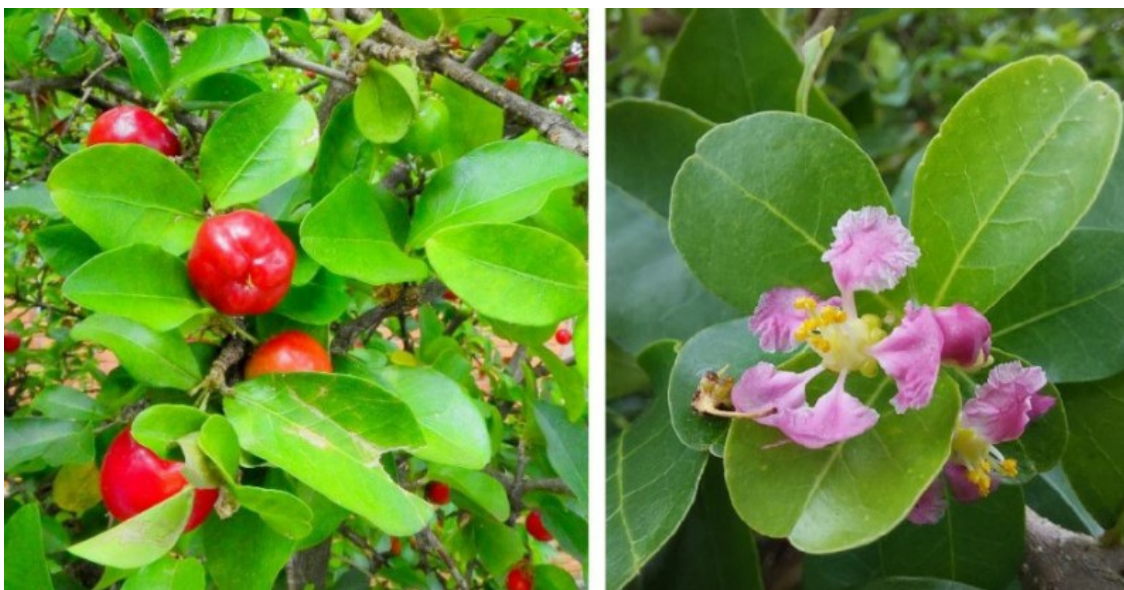
Рис. 5. Malpighia emarginata DC. в плодах и цветках.

Использование. Мальпигия окаймлённая имеет экологическое применение (декоративное, лесомелиоративное), а также используется как лекарственное и пищевое растение (POWO, 2024). Это дерево, известное своим обильным плодоношением, хорошо растёт в тропическом и субтропическом климате, при этом способно адаптироваться к самым разным местным условиям. Барбадосская вишня выделяется своими блестящими красными и сочными плодами. Помимо своей внешней привлекательности, этот фрукт является источником витамина С, часто превосходя по содержанию многие цитрусовые. Обладая сладким вкусом, подчеркнутым легкой терпкостью, он универсален для употребления в свежем виде или в качестве ингредиента в различных блюдах. А благодаря высокому содержанию витамина С, является популярным в качестве добавок к восстанавливающим средствам по уходу за кожей (Rare Fruit Trees, 2024).