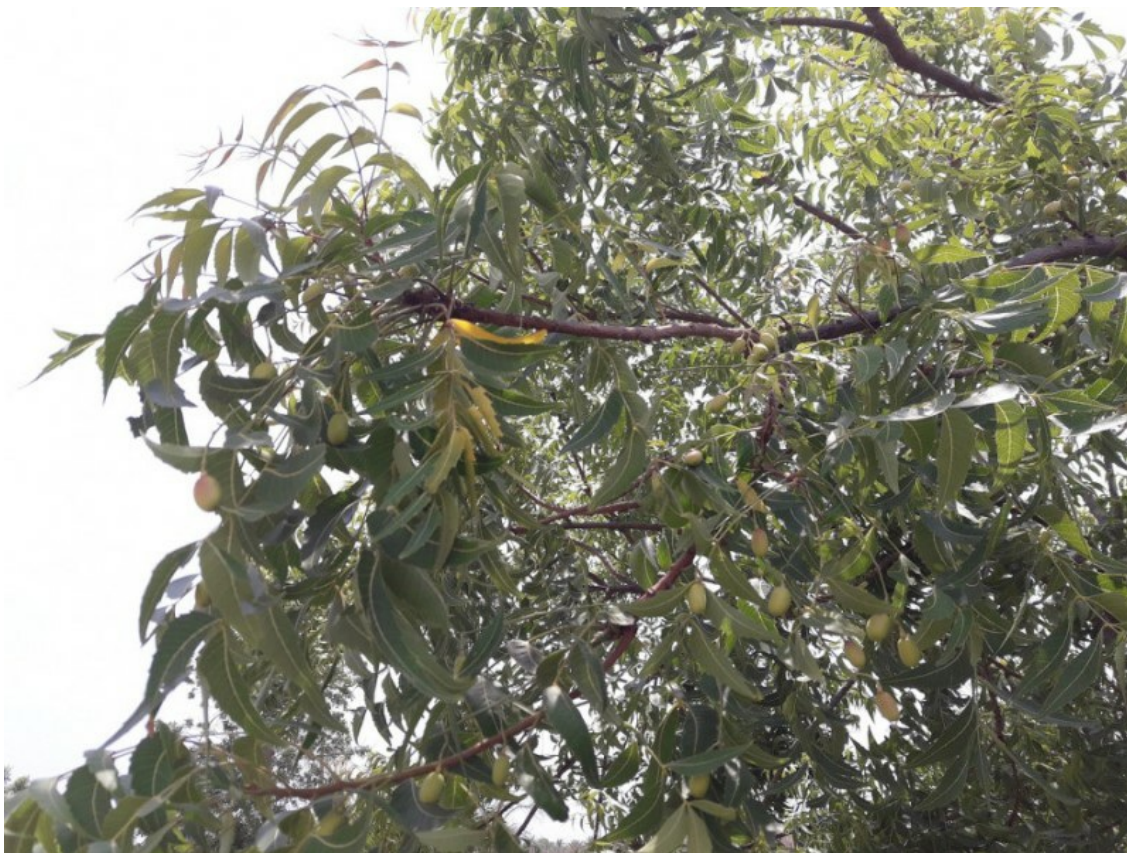
Рис. 8. Azadirachta indica (L.) A. Juss. в плодах летом.

Чужеродный культивируемый и дичающий вид (эргазиофигифит, колонофит/эпёкофит, эунеофит). – В природе встречается в смешанных лиственных и сухих лиственных диптерокарповых лесах, на обочинах дорог, по краям полей, в лесных культурах; обычно на высотах от 50 до 800 м над ур. моря. В Восточной Африке местами натурализовался в открытых зарослях и саванне, где даже начинает доминировать и менять растительные сообщества (Whitehouse et al., 2001).