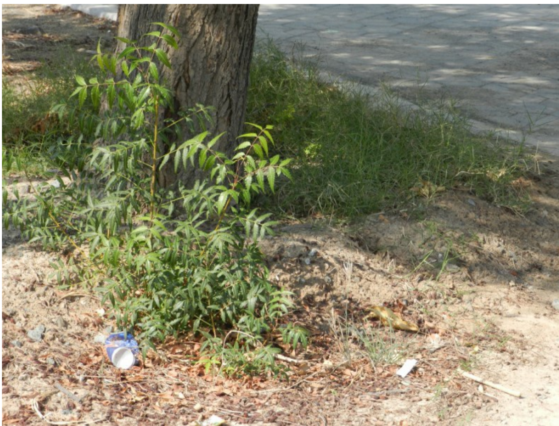
Рис. 9. Самосевный подрост Azadirachta indica (L.) A. Juss. в уличных посадках в Фуджейре.

произошло сильное засоление почв, убившее практически все финиковые пальмы и другие культивируемые растения, но деревья нима выжили.