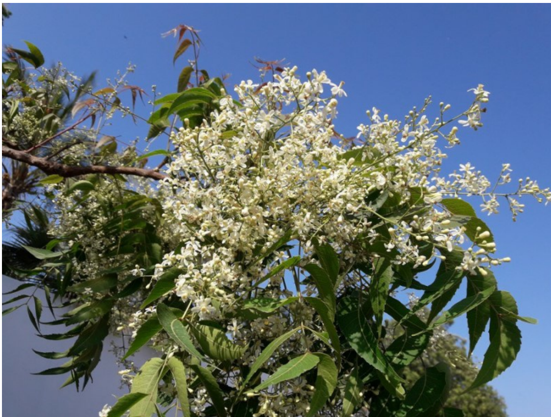
Рис. 7. Azadirachta indica (L.) A. Juss. в полном цвету весной.

Lectotype (Howard, 1988: 582): Herb. Hermann 2: 56, No. 161 (lectotype – BM (/A:000594618)). Т. О. Siddiqi (1983) неправильно указал материал в Herb. Hermann 1:10 (BM) как тип, видимо, перепутав это название с M. azedarach L.