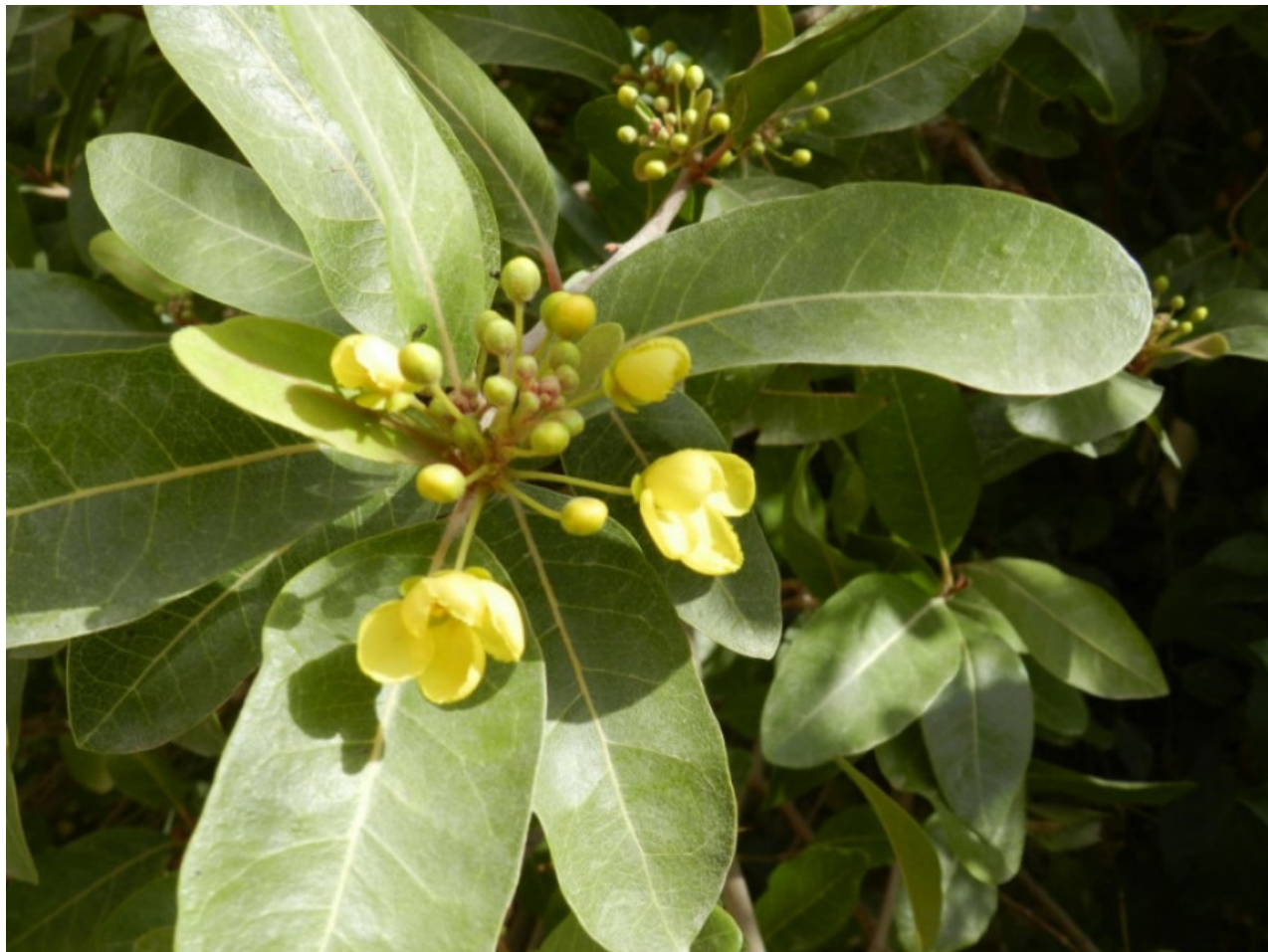
Рис. 4. Цветущий Acridocarpus orientalis A. Juss. в вадии Тарабат.

Использование. Масло, полученное из семян и экстракт листьев, используются в северном Омане в традиционной медицине при хронических головных болях, для массажа парализованных конечностей, а также при болях в мышцах и сухожилиях (Cronquist, 1981; Ghazanfar, Al-sabahi, 1993; Miller, Morris, 1988; Ghazanfar, 1994, 2007).