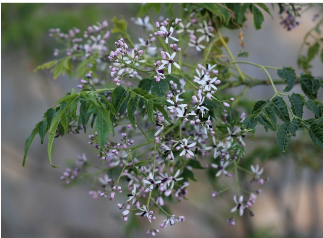
Рис. 10. Цветущая Melia azedarach L. в частном саду.

Использование. Мелия выращивается как декоративное и лесомелиоративное растение, в качестве корма для животных, для получения яда, лекарств и в корм для беспозвоночных, а также в качестве топлива и пищевое для людей (POWO, 2024). Её используют в Китае (Peng, Mabberly, 2008) в медицинских целях, для производства промышленного масла и древесины. В других странах она также достаточно широко используется.