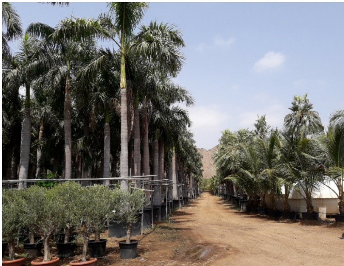
Рис. 2. Типичный питомник растений в Фуджейре (г. Дибба).