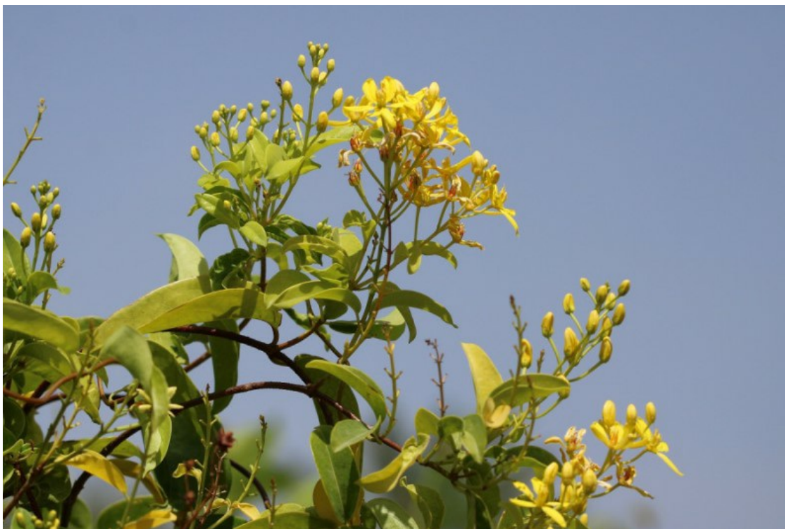
Рис. 6. Tristellateia australasiae A. Rich. в питомнике «Abu Khalid agricultural nursery» в Бидии.

Бидии). Тристеллатея южноазиатская изредка встречается в вертикальном озеленении около частных вилл и отелей. В озеленении улиц и парков мы его не встречали, так как эта лиана требует хорошего ухода и обильного полива. Мы не наблюдали её самосева вокруг посадок, и, видимо, она не является потенциально инвазивной в ОАЭ.