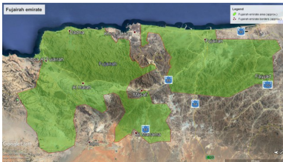
Рис. 1. Карта эмирата Фуджейра.

Omar, 2000; Abdel Bary, 2012; Richer et al., 2022 и др. и специализированных ( e-Flora of China , 2024; e-Flora of North America , 2024; e-Flora of Pakistan , 2024; Flora of Qatar , 2011–2026; UAE Flora, 2023 [ List of Fujairah Plants ]; Trees of Tropical Asia , 2009–2024; Plantarium , 2007–2024; GBIF , 2023; GreenInfo , 2003–2024 и мн. др.).