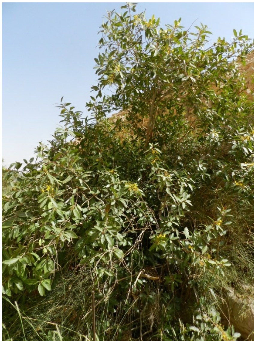
Рис. 3. Кусты Acridocarpus orientalis A. Juss. на склоне вади Тарабат на Джабал Хафите в окр. г. Аль-Айн (эмират Абу-Даби).

Цветение и плодоношение: с апреля по июнь (рис. 3, 4).