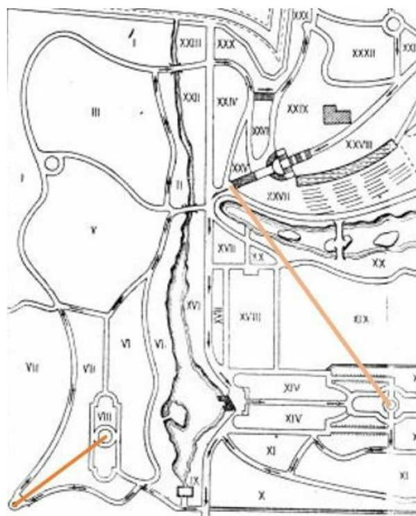
Рис. 3. Сочетание уравновешенности, соразмерности и гармоничности планировочных решений в парке «Южные культуры».