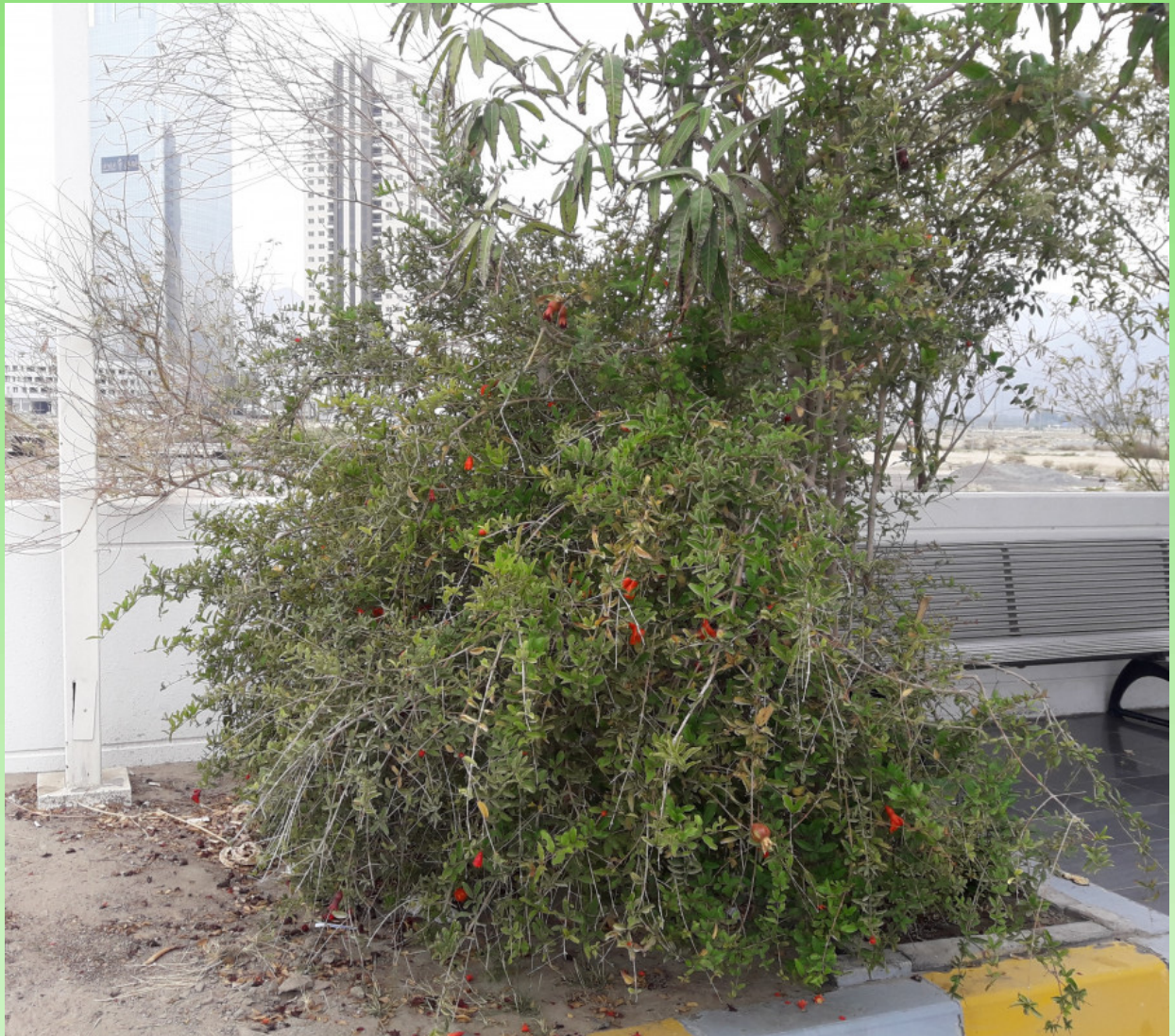
Рис. 8. Punica granatum в городских посадках в г. Фуджейра-Сити (ОАЭ).

приготавливают суррогат чайного напитка (Шипчинский, 1958).