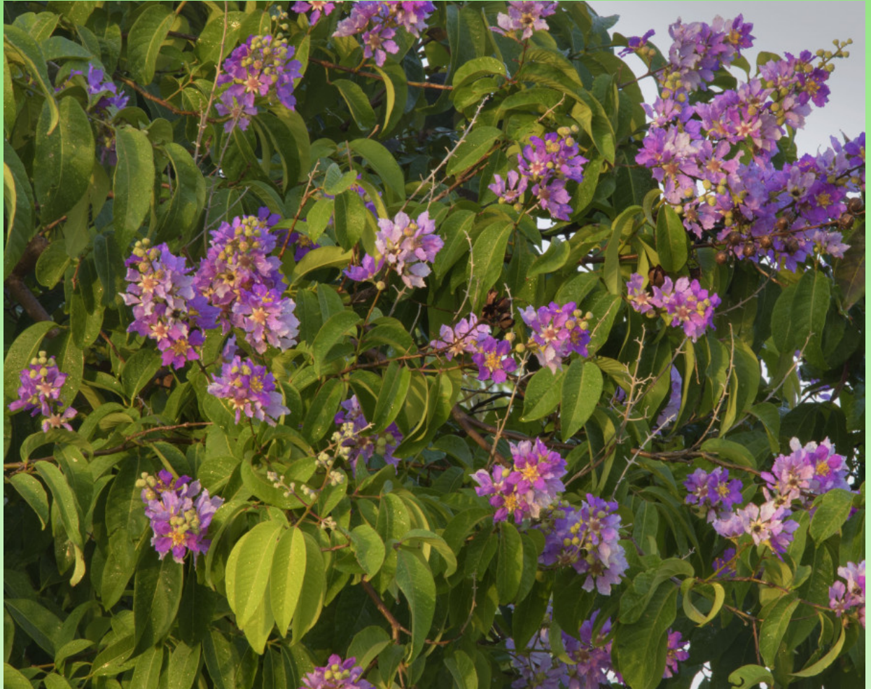
Рис. 3. Lagerstroemia indica во время цветения.

Древесина лагерстрёмии белая или коричневатая и твердая. Кора считается стимулирующим и жаропонижающим средством. Листья и цветы кустарника используются в Индокитае как слабительное и потогонное средство, а корни обладают вяжущим действием и используются в Индии как полоскание. Считается, что семена содержат наркотическое вещество (Quisumbing, 1951; Sastri, 1962; Burkill, 1995).