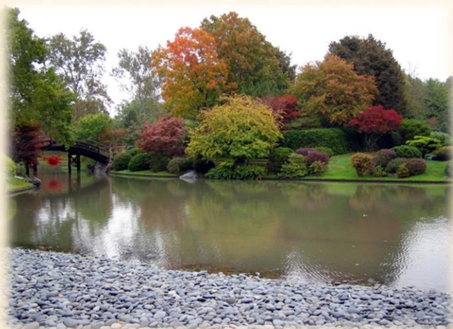
«Сад чистой гармонии и мира» в Миссурийском ботаническом саду в Сент-Луисе