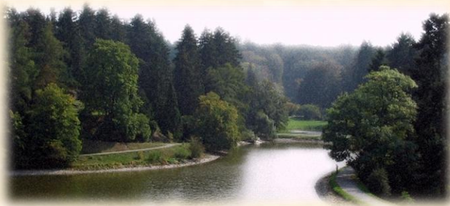
Арборетум в Прухонице. Романтическая дымка.

Однако стоит свернуть с дороги, опоясывающей водоем, как со всех сторон к вам приближаются мрачные старые деревья, а в зарослях начинается какое-то движение. Начинаешь поневоле слегка подергиваться и оглядываться в ожидании увидеть... В общем, после этой истории ежик на ночь свет не выключает.