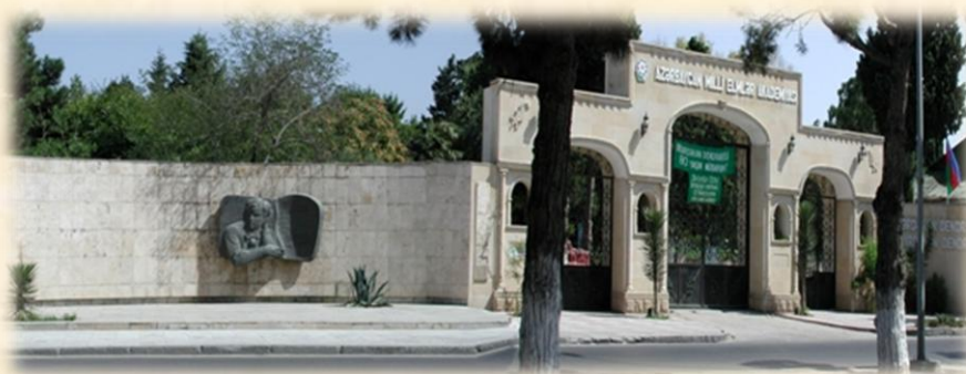
Главный вход в Мардакянский дендрарий. Баку.

Есенин. Его барельеф украшает стену дендрария, и не понятно то ли его стихами пропитано это место, то ли некий джинн заставляет слагать здесь мысли в строчки.