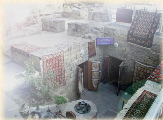
Оптовая продажа ковров-самолетов в Старом Баку (40С).

Едва привидевшись среди миражей жары, Расплавившей сознание поэта, Здесь призраки цариц Востока тают Рисунками любви покрыв ковры.