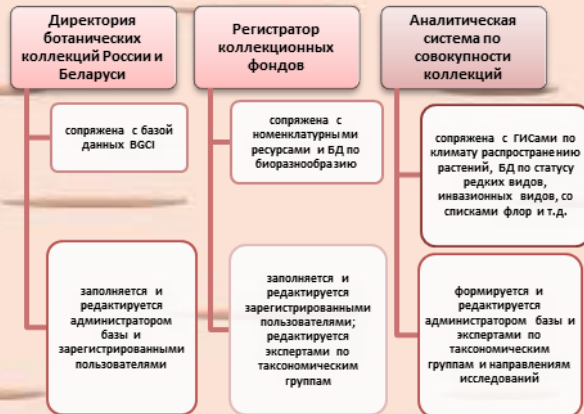
Рисунок 2. Предполагаемая структура ИС СБСРБ

и конвертирование данных в информационных системах, но и сопоставить коллекции наших стран с флорой Земли и ее отдельных регионов, с целью определения полноты коллекций и перспектив их пополнения. Данные о распространении растений представленные на сайте GRIN Taxonomy for Plants 18 позволяют сформировать геоинформационные системы, предназначенные для анализа климатических предпочтений видов с целью оптимизации их интродукции. Сравнительный анализ с используемым базой данных IUCN Red List of Threatened Species 19 , позволит оценить эффективность работы по сохранению редких видов растений в ботанических садах России и Беларуси.