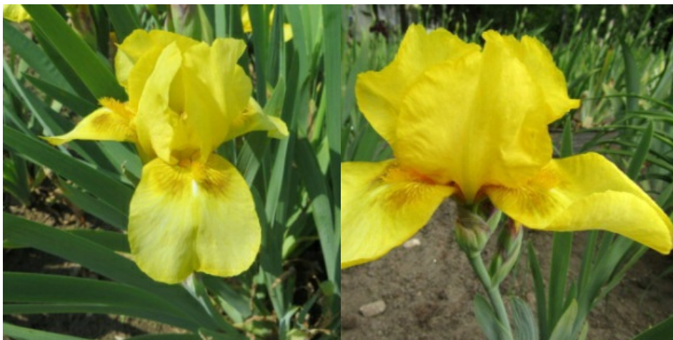
Рис. 25. 'Solent Breeze'.

'Solent Breeze' Taylor, 1964, Англия. IB, одноцветный. Цветок 14 см. Внутренние доли ( 5,1\pm 0,2 \times 4,5\pm 0,2 ) насыщенно-желтые, полусводчатые, наружные ( 6,6\pm 0,1 \times 4,6\pm 0,1 ) – насыщенно-желтые с двумя симметричными оливково-серыми пятнышками у бородок, основание желтое со светло-коричневыми и желтыми жилками, полупущенные. Ветви столбика желтые. Бородки оранжевые. Аромат сильный. Цветонос 50-60 см высотой, с 4-мя цветками. Цветет с 18-19.05 в течение 10-20 дней (Таллинский ботанический сад, 1979).