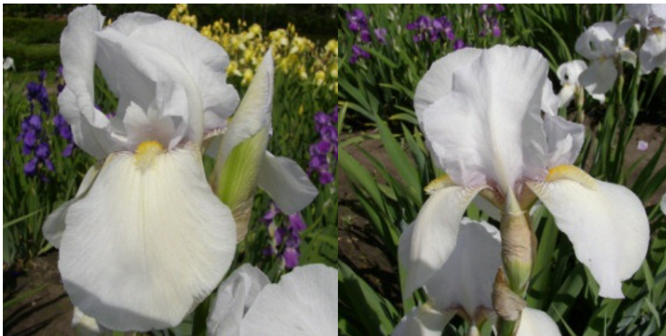
Рис. 27. 'White City'.

наружные ( 9,0 \pm 0,5 \times 6,0 \pm 0,2 ) – полупарящие. Основания белые с широкими коричневыми жилками, частично заходящими на «плечи». Ветви столбика белые с голубизной. Бородки ярко-желтые. Аромат средний. Цветоносы коротковетвистые, 85-90 см высотой, с 5-6 цветками. Листья без антоциана. Средний. Цветет с 3-15.06 в течение 12-15 дней (Национальный ботсад, Саласпилс, Латвия, 1981).