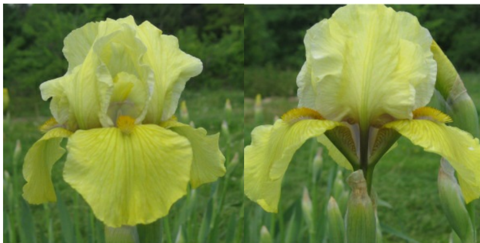
Рис. 32. 'Uroda'.