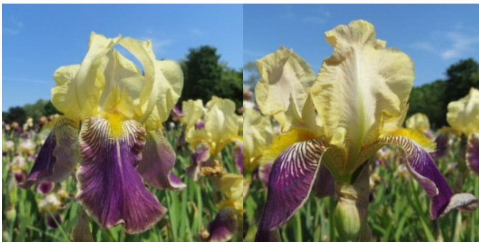
Рис. 15. 'Nibelungen'.

Цветоносы 80-85 см, с 3-4 цветками. Цветет с 1-8.06 в течение 11-15 дней (НБС им. Н. Гришко НАН Украины, Киев, 1956).