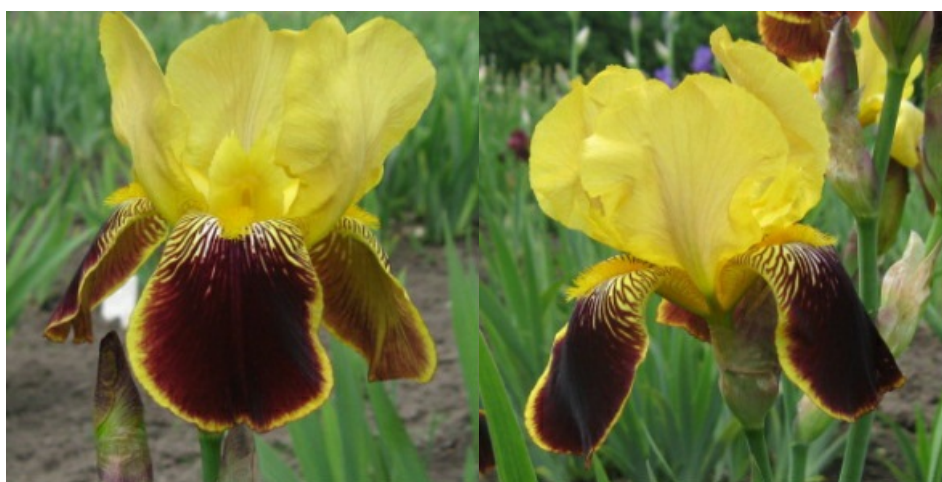
Рис. 8. 'Ramuntcho'.

'Ramuntcho' Saueux, 1939, Франция. ТВ, двухцветный, окаймленный. Цветок 15 см, не гофрированный. Внутренние доли ( 7,4 \pm 0,3 \times 5,1 \pm 0,5 ) золотисто-желтые, полусводчатые, наружные ( 8,1 \pm 0,2 \times 4,9 \pm 0,4 ) – бордовые с желтой каймой по краю, с белой областью у бородок и с бордовыми разводами в желтых основаниях и на «плечах», бархатистые, полуопущенные. Ветви столбика желтые. Бородки ярко-желтые. Аромат нежный. Цветоносы 75-80 см, разветвленные, 5-6-ти цветковые. Одновременно раскрыто 3 цветка. Листья без антоциана. Цветет с 1-12.06 в течение 15-18 дней (ГБС им. Н.В. Цицина РАН, Москва, 1962).