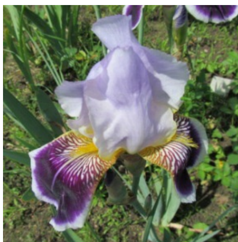
Рис. 6. 'Espana'.

'Espana' Saueux, 1937, Франция. ТВ, двухцветный-окаймленный. Цветок 21 см. Внутренние доли ( 8,2 \pm 0,2 x 7,6 \pm 0,2 ) в нежных голубовато-сиреневых тонах, с темными разводами в желтых основах, волнистые, слегка гофрированные по краю, образуют полусвод, наружные ( 10,6 \pm 0,3 x 7,1 \pm 0,1 ) – пурпурно-фиолетовые с белой каймой по краю и с многочисленными коричневыми разводами в желто-белых основаниях и на «плечах», бархатистые, полуопущенные. Ветви столбика светло-голубые с синей центральной жилкой. Бородки желтые. Аромат сильный. Цветонос 70-80 см высотой, несет 3-4 цветка. Листья без антоциана. Средний. Цветет с 8-16.06 в течение 14-18 дней (ГБС им. Н.В. Цицина РАН, Москва, 1962).