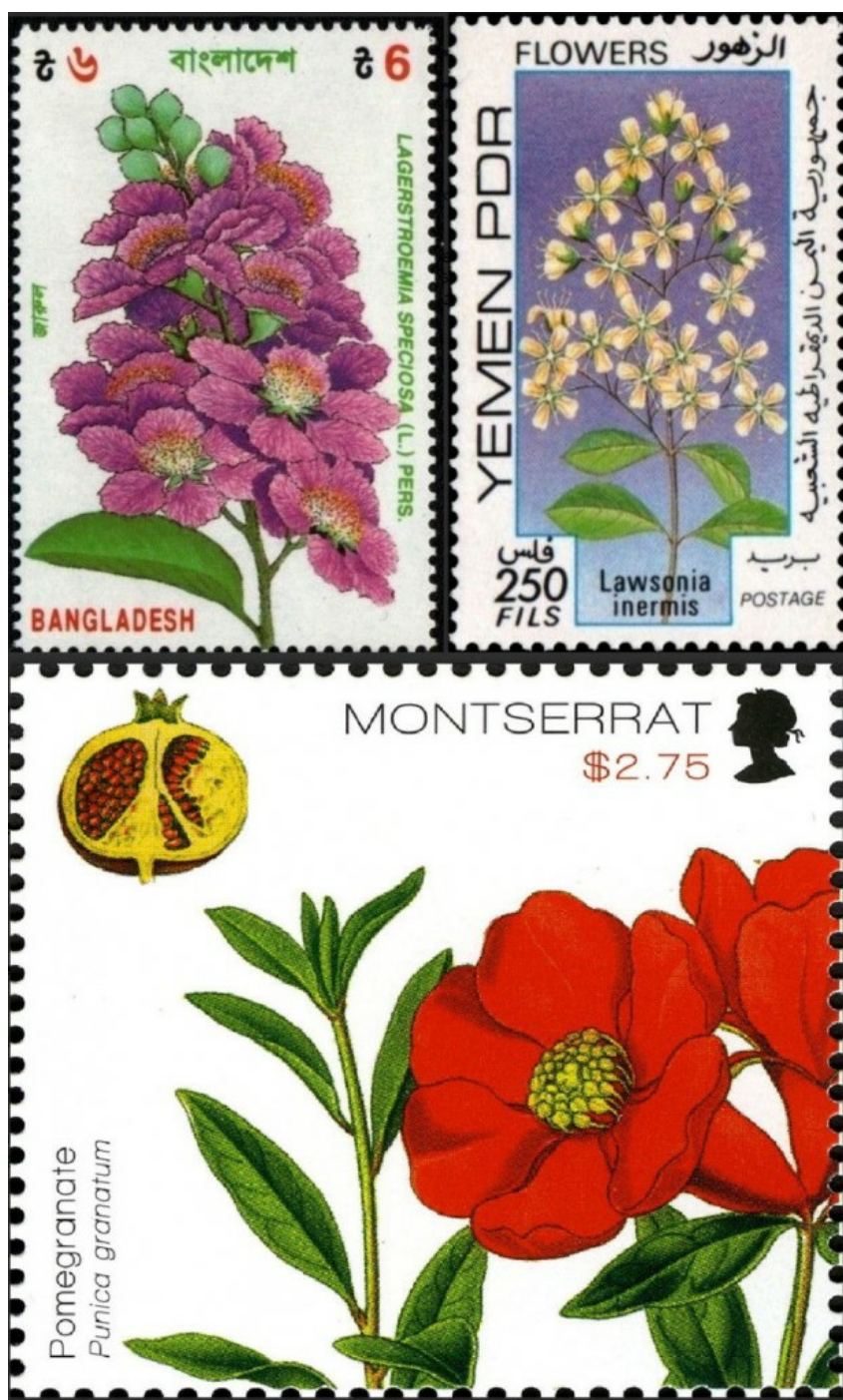
Рис. 6. Виды семейства Lythraceae на почтовых марках – Lagerstroemia speciosa , Lawsonia inermis и Punica granatum (изображения марок взяты с сайта https://colnect.com/en/search/list/collectibles/stamps/q/ ).