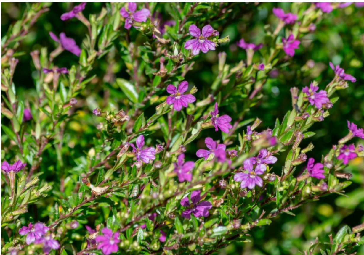
Рис. 2. Цветущая Cuphea hyssopifolia в частном саду.

Куфея также хорошо смотрится на клумбах и в бордюрах, а также в вазонах (Сох, 2011; https://floridata.com./plant/932 ).