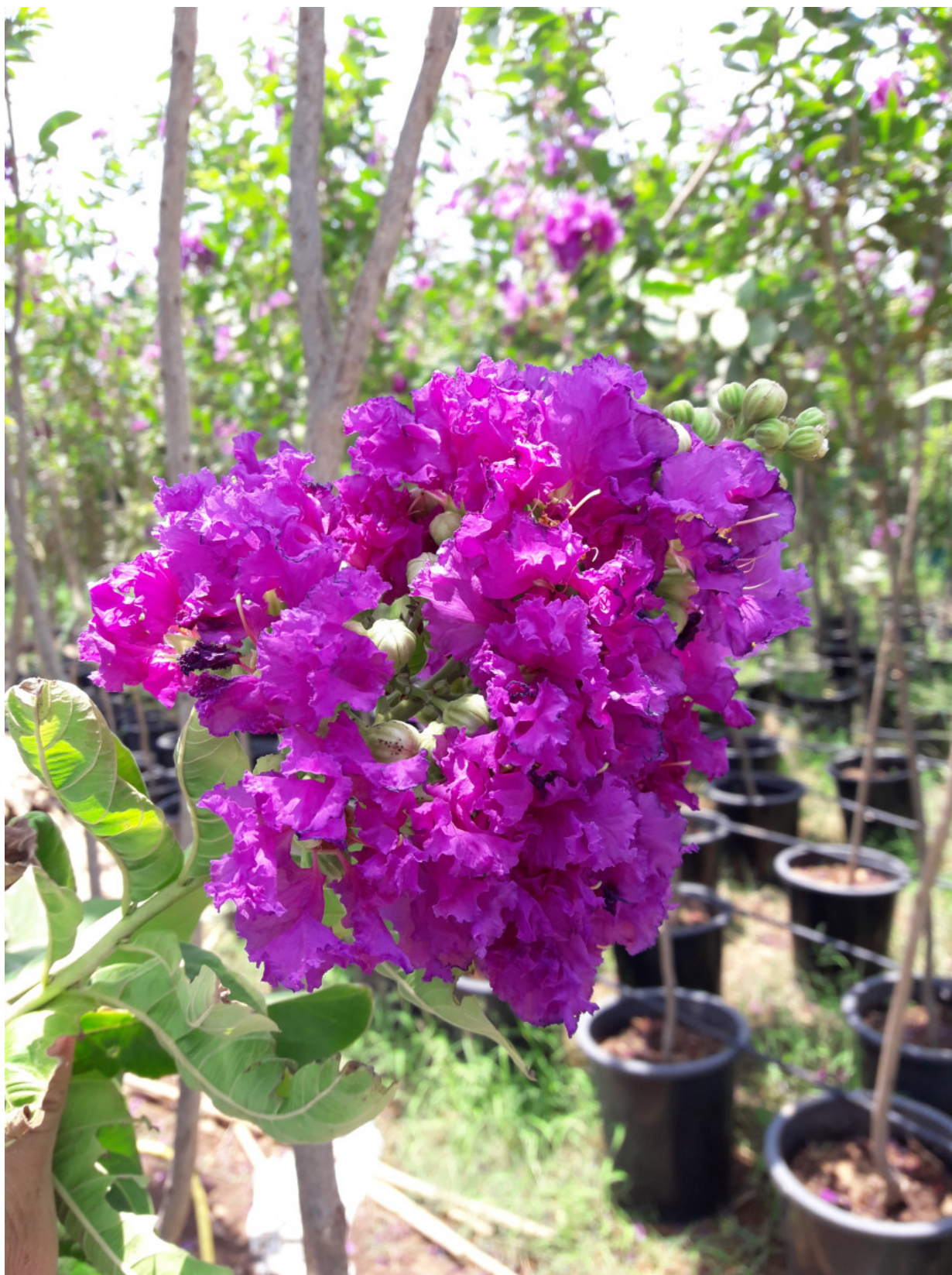
Рис. 5. Lagerstroemia speciosa в питомнике растений в Диббе.