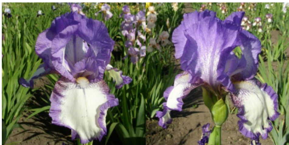
Рис. 18. 'Dancer's Veil'.

'Dancer's Veil' Hutchison, 1959, Англия. ТВ, пликата. Цветок 15 см, гофрированный. Внутренние доли ( 7,8 \pm 0,6 x 6,7 \pm 0,1 ) голубовато-сиреневые с белым пятном в центре, полусводчатые, наружные ( 8,0 \pm 0,3 x 5,4 \pm 0,4 ) – белые с голубовато-сиреневым крапом по краю, полуопущенные. Основания и «плечи» белые с бордовым крапом и такими же тонкими жилками. Ветви столбика белые с центральной жилкой и надрыльцевыми гребнями в тон внутренним долям. Бородки бледно-голубые, в основаниях желтые, с белыми основами. Аромат приятный. Цветоносы 90-100 см высотой, разветвленные, с 7-9 цветками. Одновременно раскрыто 2-3 цветка. Средний. Цветет с 7-13.06 в течение 16-19 дней (ГБС им. Н.В. Цицина РАН, Москва, 1970).