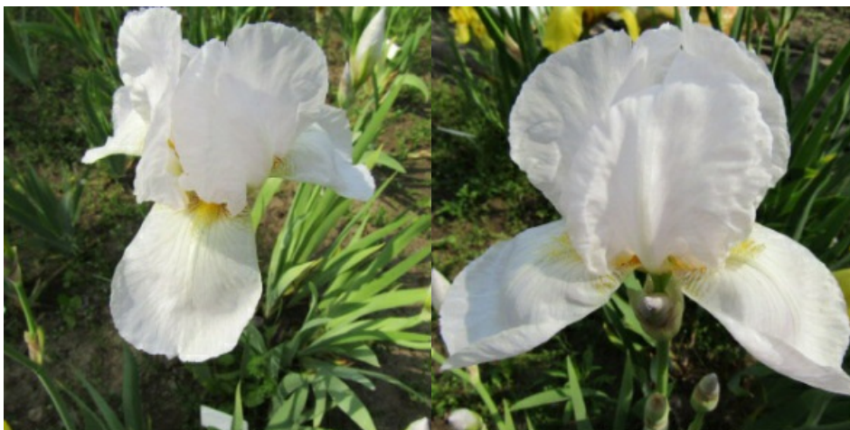
Рис. 16. 'Schneegottin'.

'Schneegottin' Steffen, 1948, Германия. ТВ, одноцветный. Цветок 16 см, не гофрирован. Доли околоцветника белые, при роспуске цветков с едва заметной голубизной, внутренние ( 9,1 \pm 0,2 \times 6,9 \pm 0,2 ) – полусводчатые, наружные ( 9,5 \pm 0,1 \times 6,3 \pm 0,2 ) – полуопущенные. Основание наружных долей белое в коричнево-серых тонких жилках. Ветви столбика в тон долям. Бородки желтые. Аромат сильный. Цветоносы 70-80 см высотой, 5-6-ти цветковые. Средний. Цветет с 6-10.06 в течение 14-18 дней. (Ботсад БИН им. В.Л. Комарова РАН, Санкт-Петербург, 1968).