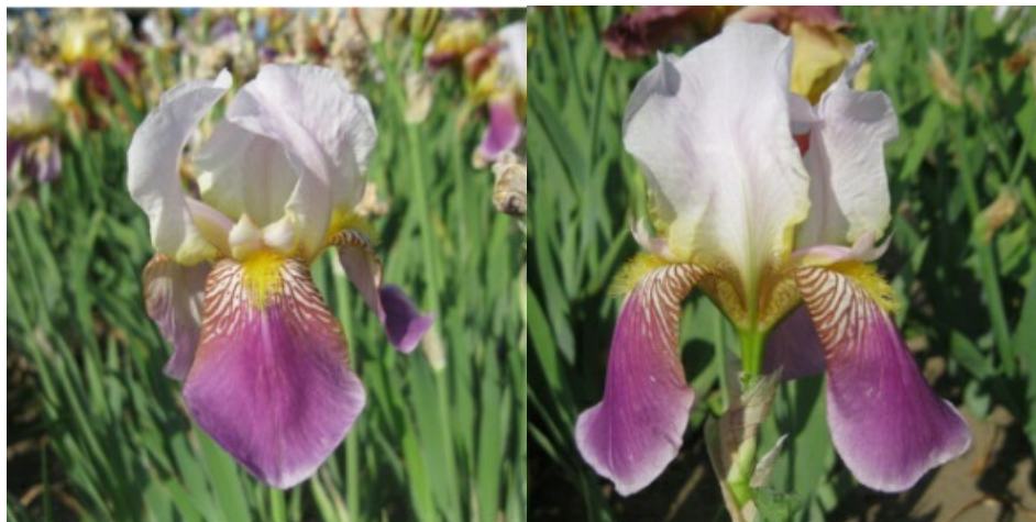
Рис. 11. 'Folkwang'.