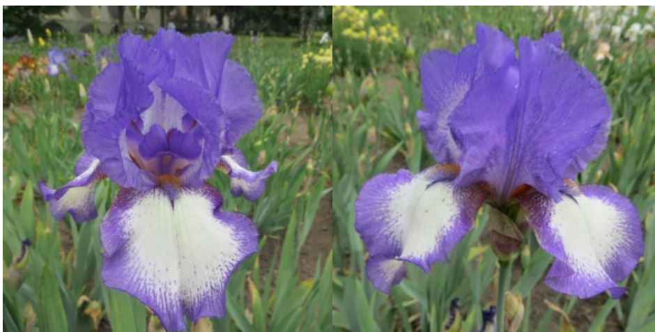
Рис. 29. 'Kytice'.

'Kytice' Blazek, 1966 (2013), Чехия. ТВ, пликата. Цветок 18 см, слегка гофрированный. Внутренние доли ( 8,3\pm 0,4 \times 7,1\pm 0,3 ) сиреневые с более светлой крапчатой зоной в центре, сводчатые, наружные ( 8,8\pm 0,5 \times 6,4\pm 0,4 ) – с белым пятном в центре и широкой крапчатой каймой по краю, полуопущенные. Основания белые с сиреневым крапом и коричнево-бордовыми жилками, переходящими на «плечи». Ветви столбика сиреневые, кремовые по краям. Бородки оранжевые с синими кончиками, продолжают синими сигналами. Аромат средний. Цветоносы 80-90 см высотой, 5-6 цветковые. Одновременно раскрыто 3 цветка. Листья в основании с сильным антоцианом. Средний. Цветет с 4-15.06 в течение 12-14 дней (Ботсад БИН им. В.Л. Комарова РАН, Санкт-Петербург, 1978).