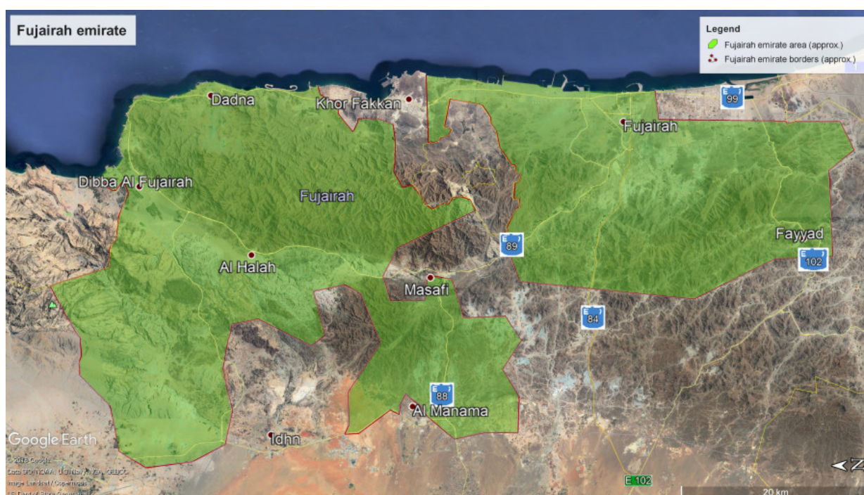
Рис. 1. Карта эмирата Фуджейра

При изучении в Фуджейре видового состава дербенниковых – интродуцентов открытого грунта были обследованы места культивирования растений в различных районах эмирата Фуджейры, и самого города Фуджейра (рис. 1). Инвентаризация проводилась с использованием маршрутного метода. Маршруты охватывали различные участки в горах, на побережье, а также парки, скверы, бульвары и набережные, уличные посадки и придомовые территории, некоторые частные сады и многочисленные питомники растений. В той или иной мере были обследованы следующие населённые пункты эмирата Фуджейра: Бидия (Bidiyah), Аль Кидфа (Al Qidfa), Аль Гурфа (Al Gurfa), Мазафи (Masafi), Аль Куррая (Al Qurraa), Аль Сиджи (Al Siji), Аль Фуджейра (Al Fujairah), Аль Таваин (Al Tawueen), Аль Хала (Al Halah), Аль Битна (Al Bithnah), Шарм (Sharm), Дибба (Dibba Fujairah), Аль Фарфар (Al Ferfar), Аль Ака (Al Aqah), Аль Хейл (Al Hail), Рул Дадна (Rul Dadnah), Мерба (Mirbah), Аль Тайба (Al Taiba) и Альвала (Awhala).