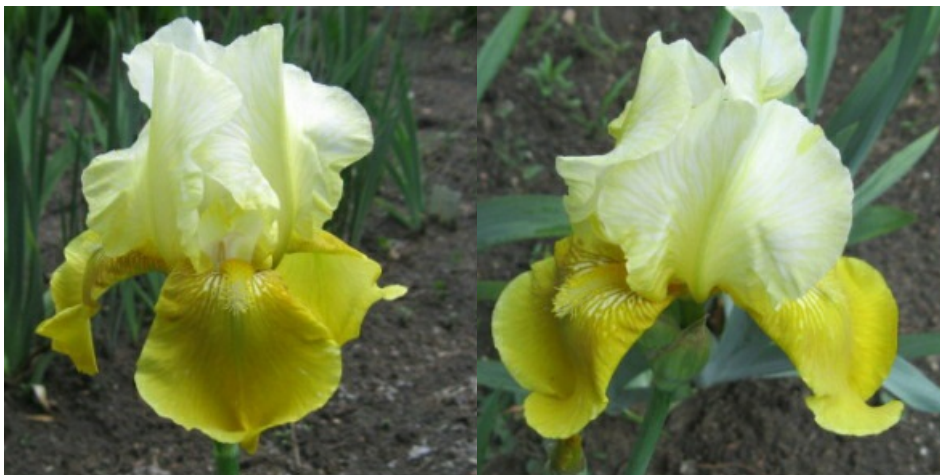
Рис. 19. 'Golden Alps'.

жилкованием, переходящим к центру в сплошное кремовое пятно, полусводчатые, наружные ( 9,4\pm 0,4 x 5,8\pm 0,5 ) – темно-желтые, полуопущенные. Основание желтое с толстыми коричневыми жилками, вдоль бородок белая зона. Ветви столбика кремово-белые. Бородки ярко-желтые, оранжевые в основаниях. Аромат приятный, нежный. Цветоносы 70-80 см высотой, 3-4 х цветковые. Лист без антоциана. Средний. Цветет с 5-13.06 в течение 13-15 дней (Ботсад БИН им. В.Л. Комарова РАН, Санкт-Петербург, 1970).