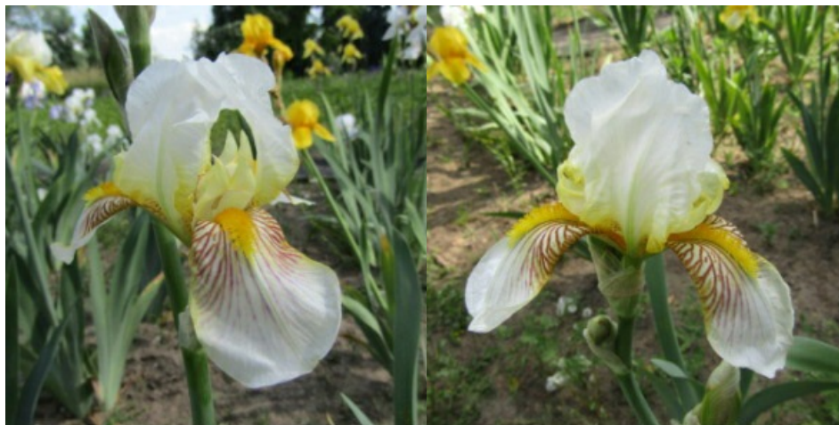
Рис. 2. 'Balaruc'.

'Balaruc' Denis, 1920, Франция. ТВ, одноцветный. Цветок 13 см, с волнистыми долями. Внутренние доли ( 5,8 \pm 1,1 \times 4,0 \pm 0,0 ) белые с легкими желтыми прожилками, в основе желтые с бордовыми жилками, сводчатые, наружные ( 6,6 \pm 0,4 \times 3,3 \pm 0,4 ) – белые с редкими лиловыми вкраплениями, полуопущенные. Основания и «плечи» кремовые в желтых и коричнево-бордовых штрихах и жилках. Ветви столбика белые с кремовым оттенком по краям. Бородки ярко-желтые. Цветоносы 70-80 см высотой, коротковетвистые, с 4-10 цветками. Листья без антоциана. Аромат сильный. Среднепоздний. Цветет с 10-15.06 в течение 15-18 дней (НБС им. Н. Гришко НАН Украины, Киев, 1956).