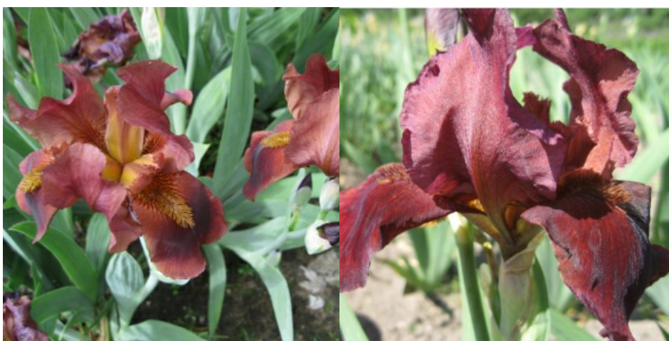
Рис. 30. 'Sametka'.