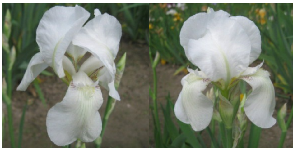
Рис. 33. 'White Queen'.

' White Queen ' Geulenkek, 1918, Голландия. ТВ, одноцветный. Цветок 7 см, не гофрирован. Доли белые, внутренние сводчатые, наружные опущенные, основание с бордовыми жилками. Ветви столбика белые. Бородки желтые с белой основой. Аромат приятный. Цветоносы коротковетвистые, 60-70 см высотой, с 6-7-ю цветками. Раннесредний. Цветение обильное. Одновременно на цветоносе раскрыто 2-3 цветка. Цветет с 25.05-10.06 в течение 15-20 дней.