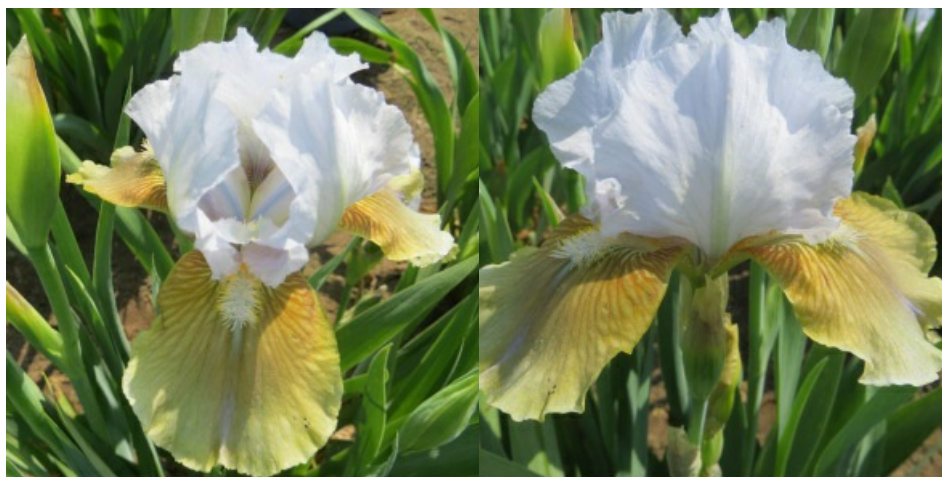
Рис. 31. 'Uljana'

'Uljana' Blazek, 1983, Чехия. SDB, двухцветные. Цветок 12 см, гофрирован. Внутренние доли ( 6,9\pm 0,1 x 4,9\pm 0,1 ) светло-голубые, сводчатые, наружные ( 6,9\pm 0,1 x 4,4\pm 0,1 ) – светлые, оливково-коричневого цвета, переходящего к краю долей в кремовый, горизонтальные или полуопущенные. Табачно-коричневое жилкование в белом основании и на «плечах». Ветви столбика нежно-голубые с желтизной по краям, с более темной голубой центральной линией. Бородки белые с желтым кончиком с бело-голубой основой. Аромат нежный. Цветоносы 40-45 см высотой, 4-х цветковые. Поздний. Цветет с 20 -25.05 в течение 17-20 дней (Ботсад Ботанического ин-та АН Чешской республики, Пругонице, 2009).