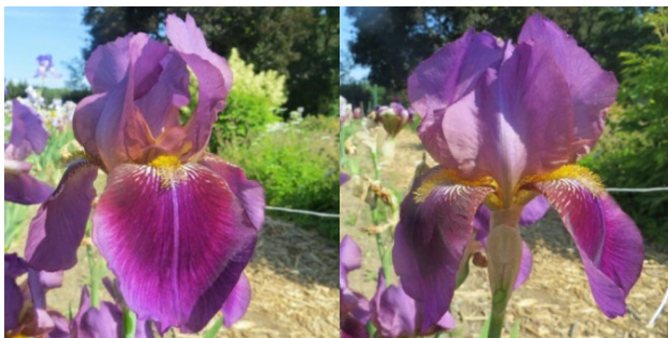
Рис. 10. 'Zingarella'.

'Zingarella' Saueux, 1931, Франция. ТВ, двухтонный. Цветок 13-14 см. Внутренние доли ( 10,0\pm 0,1 x 6,5\pm 0,1 ) светлые, оливково-фиолетовые, основа желтая с бордово-коричневым жилкованием, полусводчатые, наружные ( 9,9\pm 0,1 x 7,0\pm 0,3 ) – пурпурно-фиолетовые бархатистые, светлее по краю, плечевая зона с пурпурно-фиолетовым оттенком, бархатистая, основание желтое с бордовыми жилками, вдоль бородок большая белая зона с бордовыми жилками, полупущенные. Иногда на наружных долях проявляется более светлая центральная линия. Ветви столбика желтые с широкой центральной линией и надрыльцевыми гребнями в тон внутренним долям. Бородки насыщенно-ярко-желтые. Аромат сильный. Цветоносы 70-80 см высотой, 1-2 разветвленные с 4-5 цветками. Лист без антоциана. Средний. Цветет с 4-11.06 в течение 10-12 дней (Salaspils, National Botanical Garden of Latvia, 1982).