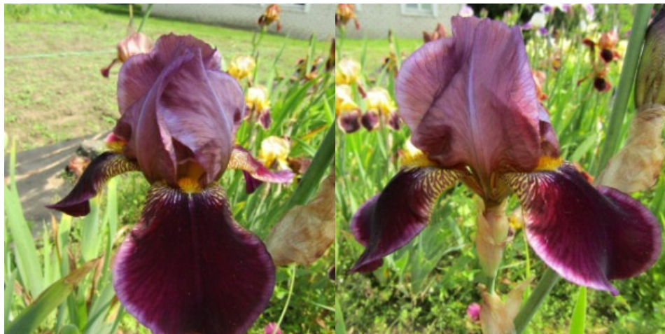
Рис. 17. 'Thorsten'.