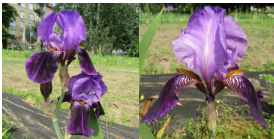
Рис. 1. 'Archeveque'.

'Archeveque' Vilmorin, 1911, Франция. IB, двухтонный. Цветок 12 см, с волнистыми долями. Внутренние доли ( 6,9 \pm 0,1 \times 4,4 \pm 0,2 ) лиловые, полусводчатые, наружные ( 6,9 \pm 0,1 \times 4,8 \pm 0,2 ) – темно-лилово-фиолетовые с более светлой средней линией, бархатистые, полу- или опущенные. Основания и «плечи» белые с лилово-бордовыми жилками и штрихами. Ветви столбика в тон внутренним долям. Бородки желто-коричневые. Цветоносы 60 см высотой с 2-3 цветками. Листья без антоциана. Аромат приятный. По срокам цветения сорт можно отнести к среднепоздним интермедия (IB) или раннесредним бордюрным (BB) ирисам. Цветет с 25.05-4.06 в течение 14-18 дней (НБС им. Н. Гришко НАН Украины, Киев, 1956).