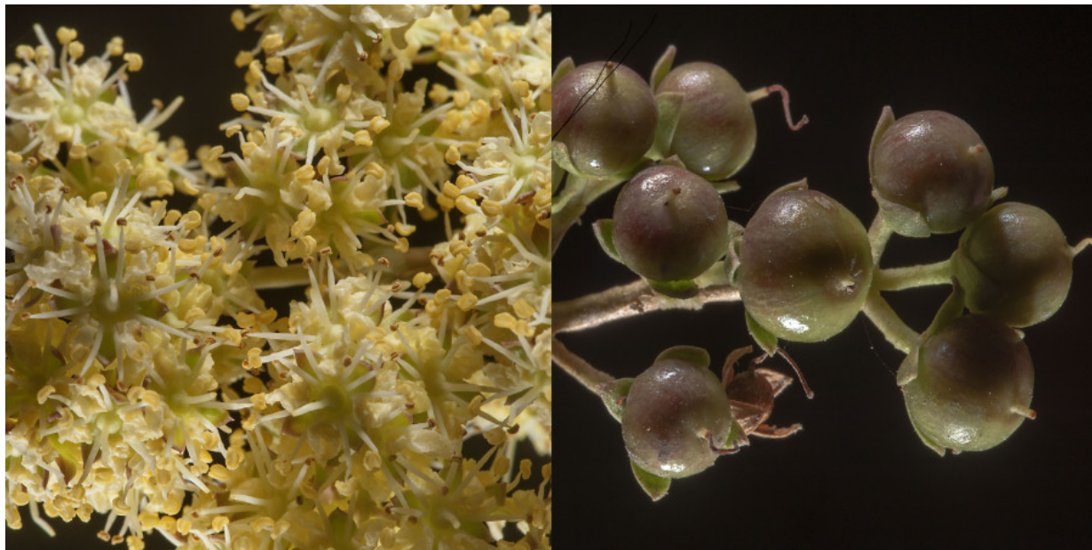
Рис. 7. Lawsonia inermis – цветы и плоды (коллаж сделан на основании фото Алексея Сергеева).

Важное красильное растение в Пакистане (Белуджистане) и Зап. Индии, известное с очень древних времен, используется для окраски волос, ногтей, подошв и ладоней, зубов, а также хвостов и грив лошадей, а в некоторых частях мира даже ослов. Краситель получают путем измельчения веток и молодых листьев и добавления горячей воды для образования пасты, которую наносят на окрашиваемую часть. Цветы имеют приятный стойкий запах и используются в качестве духов (Dar, 2025).