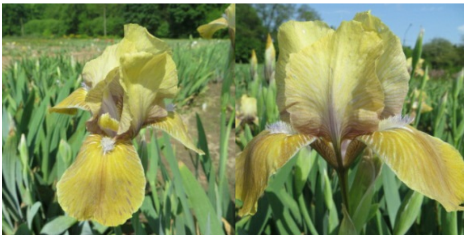
Рис. 14. 'Natascha'.

'Natascha' Werckmeister, 1966, Германия. АВ, одноцветный. Цветок 12 см, не гофрирован. Внутренние доли ( 7,0\pm 0,0 x 4,2\pm 0,1 ) табачно-желтые с сиреневыми штрихами, волнистые, наружные ( 7,0\pm 0,1 x 3,8\pm 0,1 ) – табачно-желтые с четкими коричневыми и белыми штрихами в основаниях, полуопущенные. Ветви столбика нежно-сиреневые с желтыми надрыльцевыми гребнями. Бородки светлые голубые, в горловине желтые с белыми основами. Аромат нежный. Цветоносы 60-65 см высотой, с 3-4-мя цветками. Ранний. Цветет с 17-19.05 в течение 15-20 дней, обильно. (Ботсад БИН им. В.Л. Комарова РАН, Санкт-Петербург, 1986).