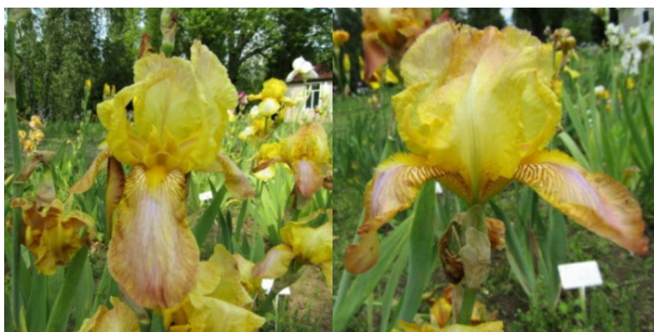
Рис. 26. 'Talisman'.

'Talisman' Murrell, 1930, Англия. ТВ, переливчатый. Цветок 15 см, с узкими продолговатыми долями, не гофрирован. Внутренние доли ( 7,5\pm 0,2 \times 4,8\pm 0,2 ) желтые с розовым приливом по краю, сводчатые, наружные ( 7,9\pm 0,2 \times 4,3\pm 0,2 ) – оранжево-коричневые с розово-сиреневой зоной в центре, полуопущенные. Основание желто-белое с коричневыми жилками, переходящими на «плечи». Ветви столбика желтые, с розовинкой по центральной линии и на надрыльцевых гребнях. Бородки желтые. Аромат сильный. Цветоносы 75-85 см высотой, с 4-5 цветками. Листья в основании с антоцианом. Средний. Цветет с 5-11.06 в течение 13-16 дней (ГБС им. Н.В. Цицина РАН, Москва, 1962).