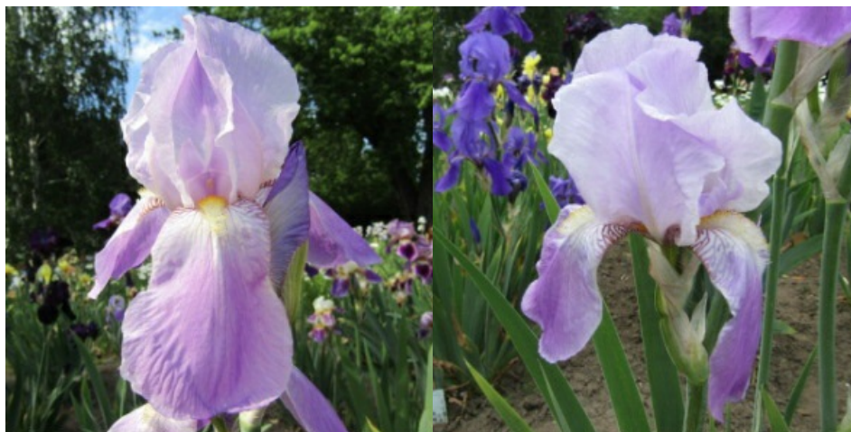
Рис. 4. 'Charmeur'.

'Charmeur' Saueux, 1931, Франция. ТВ, двухтонный. Цветок 12-13 см, с волнистыми долями. Внутренние доли бело-сиреневые, в основе с бордовыми точками штрихами, сводчатые. Наружные доли светло-сиреневые (цвета яблони), светлее к краям, полуопущенные. Основания белые с сиреневым и бордовым жилкованием. Ветви столбика в тон верхним долям. Бородки средней толщины, желтые с белой основой. Цветоносы 80-90 см высотой, коротковетвистые, с 8-9 цветками. Одновременно на цветоносе цветет 2-3 цветка. Листья без антоциана. Аромат средний. Среднеранний. Цветет с 25.05-1.06 в течение 15-20 дней (ГБС им. Н.В. Цицина РАН, Москва, 1970).