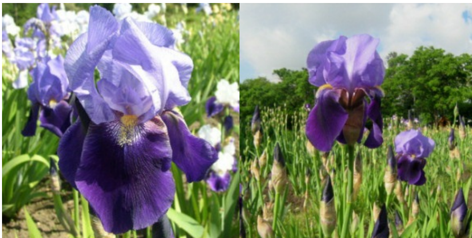
Рис. 21. 'Joanna'.

фиолетовые с легким пурпуром, бархатистые, основание с красно-коричневыми разводами и жилками, зона вдоль бородок белая с жилками в тон наружным долям, полуопущенные. Ветви столбика светло-голубые с темно-голубыми центральной линией и надрыльцевыми гребнями. Бородки голуовато-желтые. Аромат сильный, приятный. Аромат сильный, приятный. Цветоносы короткоцветистые, 80-90 см высотой, с 4-5 цветками. Средний. Цветет с 1-18.06 в течение 14-20 дней (Москва, 1970).