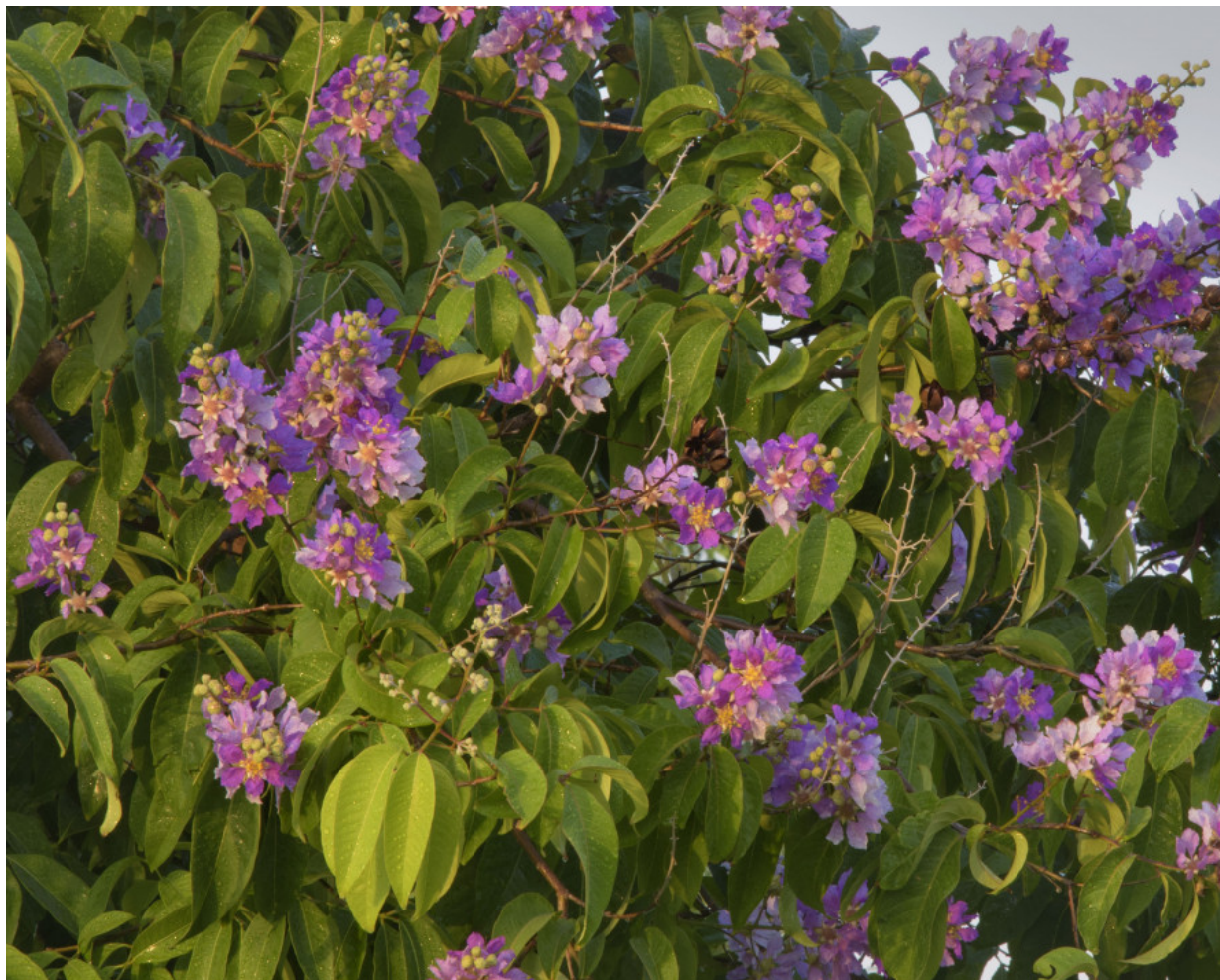
Рис. 3. Lagerstroemia indica во время цветения.

Древесина лагерстрёмии белая или коричневатая и твердая. Кора считается стимулирующим и жаропонижающим средством. Листья и цветы кустарника используются в Индокитае как слабительное и потогонное средство, а корни обладают вяжущим действием и используются в Индии как полоскание. Считается, что семена содержат наркотическое вещество (Quisumbing, 1951; Sastri, 1962; Burkill, 1995).