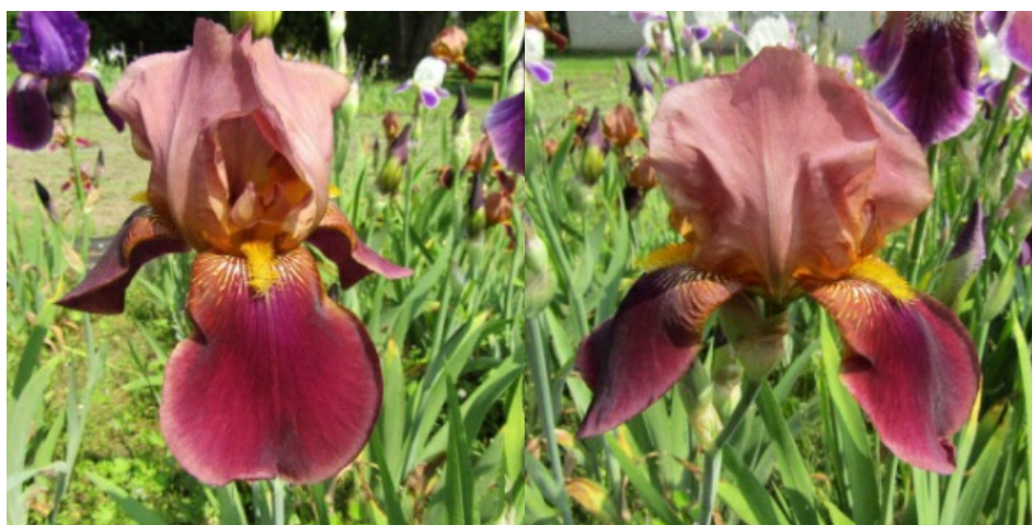
Рис. 5. 'Depute Nomblot'.

'Depute Nomblot' Saueux, 1929, Франция. ТВ, двухтонный-переливчатый. Цветок 18 см, не гофрированный с волнистыми долями. Внутренние доли ( 8,3 \pm 0,4 \times 6,8 \pm 1,1 ) оливково-лилово-красные с фиолетовыми переливами, сводчатые, наружные ( 10,3 \pm 0,4 \times 7,3 \pm 0,4 ) – темно-лилово-бордовые с фиолетовыми переливами, по краю светлее, бархатистые, полуопущенные.