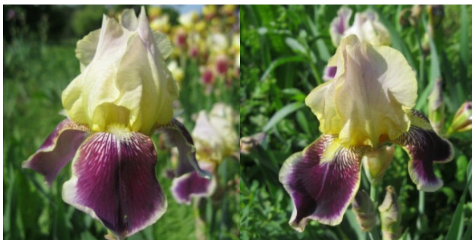
Рис. 9. 'Salonique'.