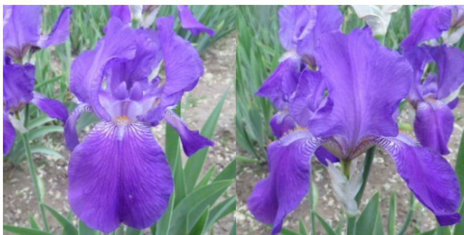
Рис. 3. 'Caprice'.

'Caprice' Vilmorin, 1893, Франция. ВВ, одноцветный. Цветок 16 см, с волнистыми долями. Внутренние доли сиренево-лиловые, полусводчатые. Наружные доли чуть темнее верхних, полуопущенные или опущенные. Основания белые с красно-коричневыми разводами, «плечи» белые с красно-фиолетовыми разводами. Ветви столбика белесые с лиловой центральной жилкой и сиренево-лиловыми надрыльцевыми гребнями. Бородки сиренево-голубые, в основаниях желтые. Цветоносы 50-60 см высотой с 4-5 цветками. Аромат сильный. По срокам цветения соответствует среднерослым бордюрным (ВВ) ирисам. Цветет с 5-14.06 в течение 12-16 дней (НБС им. Н. Гришко НАН Украины, Киев, 1956).