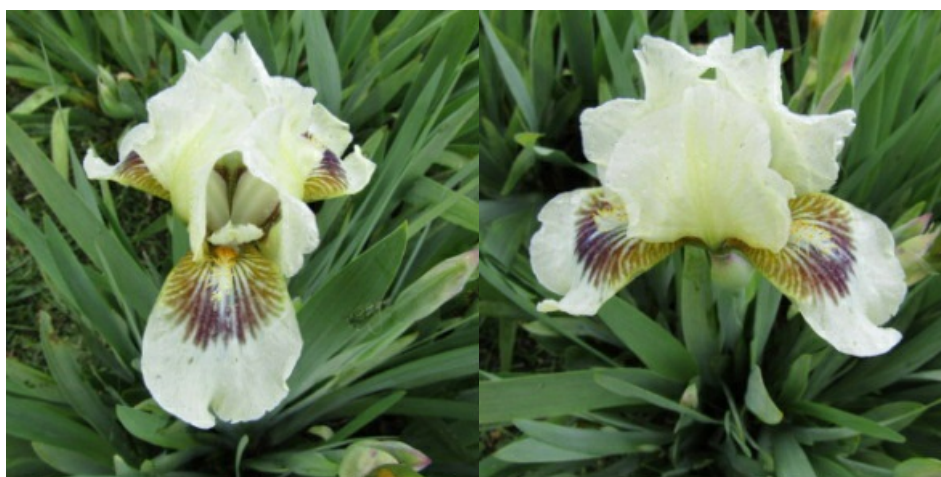
Рис. 28. 'Widcombe Fair'.

'Widcombe Fair' Taylor, 1965, Англия. SDB, одноцветный. Цветок 11 см, не гофрирован. Внутренние доли ( 6,5 \pm 0,3 \times 3,5 \pm 0,0 ) белые, кремовые по центральной жилке внутри, кремовые снаружи, волнистые, сводчатые, наружные ( 6,7 \pm 0,5 \times 3,5 \pm 0,1 ) – белые с темным коричнево-бордовым лучистым пятном у бородок, горизонтальные. Основание и «плечи» желто-белые с широкими коричневыми жилками. Ветви столбика кремовые. Бородки желтые с белыми основами, в основаниях оранжевые, продолжают на долю белоголубыми сигналами. Аромат сильный. Цветоносы 30-40 см высотой, 3-х цветковые. Средний. Цветет с 17-29.05 в течение 11-15(22) дней (Ботсад БИН им. В.Л. Комарова РАН, Санкт-Петербург).