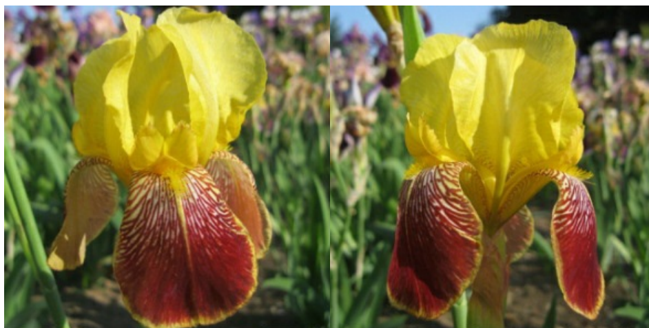
Рис. 12. 'Fro'.

'Fro' Goos & Koepemann, 1909, Германия. IB, двухцветный-окаймленный. Цветок 14 см, не гофрирован. Внутренние доли ( 6,9\pm 0,1 x 4,8\pm 0,1 ) золотисто-желтые, сводчатые. наружные ( 6,7\pm 0,2 x 4,3\pm 0,2 ) – бархатистые, красно-коричневые с белыми радиальными жилками, отходящими от бородок, со светло-желтой каймой по краю, опущенные. Ветви столбика золотисто-желтые, красиво лежат на наружных долях. Бородки желтые, продолжают на долю желтым сигналом. Аромат сильный. Цветоносы 65-75 см высотой, 5-6-ти цветковые. Одновременно раскрыто 2-4 цветка. Листья без антоциана. По срокам цветения сорт можно отнести к среднепоздним интермедия (IB) или раннесредним бордюрным (BB) ирисам. Цветет с 27.05-6.06 в течение 15-17 дней (ГБС им. Н.В. Цицина РАН, Москва, 1962).