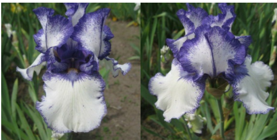
Рис. 22. 'Orinoco Flow'.

'Orinoco Flow' Bartlett, 1993, Англия. ВВ, пликата. Цветок 14 см, гофрированный. Внутренние доли ( 7,5\pm 0,7 x 5,3\pm 0,4 ) белые с каймой из синих штрихов по краю, полусводчатые, наружные ( 7,9\pm 0,8 x 5,9\pm 0,5 ) – белые с узкой каймой из синих штрихов, полуопущенные. Основание и «плечи» синие с пурпурным оттенком, с бордовыми тонкими жилками. Ветви столбика синие с пурпурным оттенком, темнее по центральной жилке и надрыльцевым гребням. Бородки голуовато-желтые. Цветоносы короткоцветистые, до 60 см высотой, с 3-4 цветками. Раннепоздний. Цветет с 25.05-10.06 в течение 10-15 дней (Ботсад БИН им. В.Л. Комарова РАН, Санкт-Петербург, 2011).