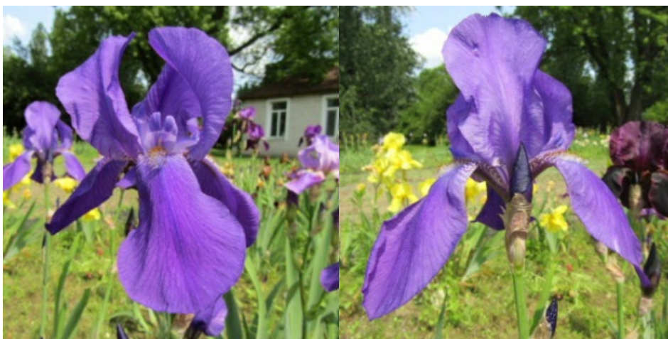
Рис. 20. 'Harmony'.

' Harmony ' Dykes, 1923, Англия. ТВ, одноцветный. Цветок 13 см. Доли околоцветника сине-фиолетовые, с более темным жилкованием. Внутренние доли образуют свод ( 7,3\pm 0,4 x 4,5\pm 0,7 ), наружные – опущенные ( 7,0\pm 0,0 x 4,5\pm 0,7 ). Основания с темными фиолетовыми жилками. Ветви столбика светло-сине-фиолетовые. Бородки коричневые с голубыми основами. Аромат сильный. Цветоносы 70 см высотой, 3-4 х цветковые. Средний. Цветет с 3-14.06 в течение 12-14 дней (НБС им. Н. Гришко НАН Украины, Киев, 1956).