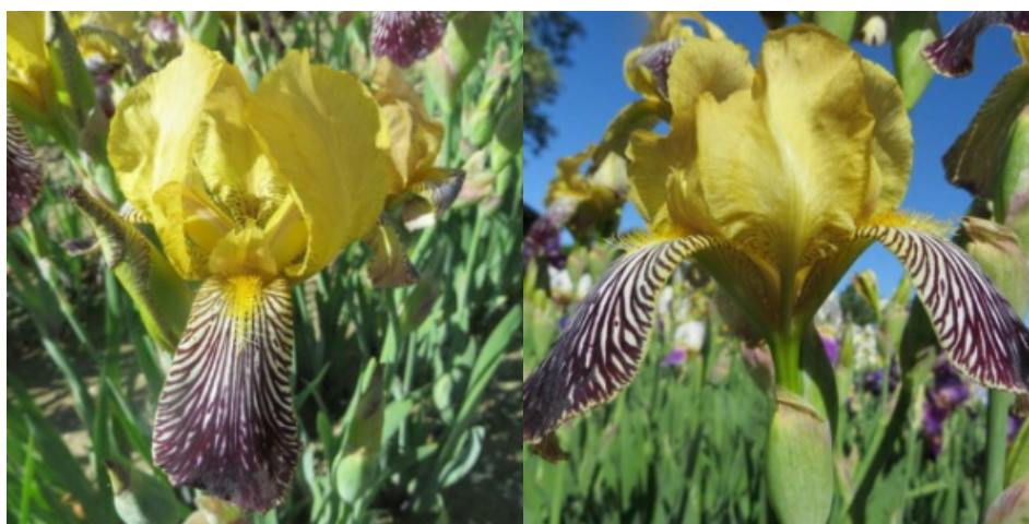
Рис. 7. 'Jacquesiana'.