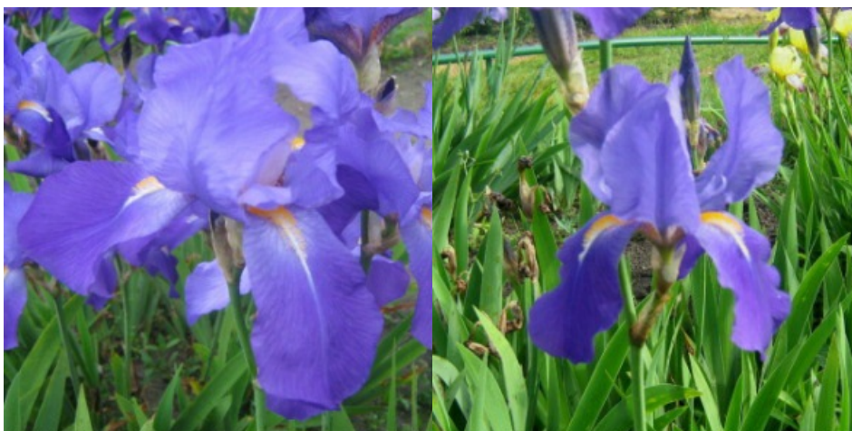
Рис. 24. 'Sapphire'.

'Sapphire' Dykes, 1922, Англия. IB, одноцветный. Цветок 18 см, не гофрирован. Внутренние доли ( 8,2\pm 0,5 x 4,5\pm 0,0 ) околоцветника светло-фиолетовые с голубоватым переливом, в основах с коричневым жилкованием, полусводчатые, наружные ( 8,0\pm 0,0 x 4,5\pm 0,0 ) – чуть темнее, полуопущенные. Основания наружных долей белые с коричневыми жилками. Ветви столбика светло-голубые с более темными центральной линией и надрыльцевыми гребнями. Бородки оранжевые с белой основой, продолжают на долю коротким белым сигналом. Аромат нежный. Цветоносы тонкие, коротковетвистые, 60-70 см высотой, с 3-5 цветками. По срокам цветения сорт можно отнести к среднепоздним интермедия (IB) или раннесредним бордюрным (BB) ирисам. Цветет с 28.05- 3.06 в течение 16-20 дней (НБС им. Н. Гришко НАН Украины, Киев, 1956).