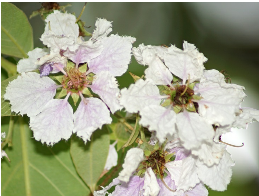
Рис. 4. Характерные бахромчатые цветки Lagerstroemia loudonii

по продаже растений ( https://www.greensouq.ae/product/664/lagerstroemia-loudonii ). В Фуджейре мы это дерево не встречали ни в питомниках, ни в публичных посадках, но предполагаем, что оно может быть встречено в частных садах около вилл, куда поступает из Дубая (от Фуджейра-сити до Дубая всего 1 час езды на автомобиле). Не является инвазивным видом.