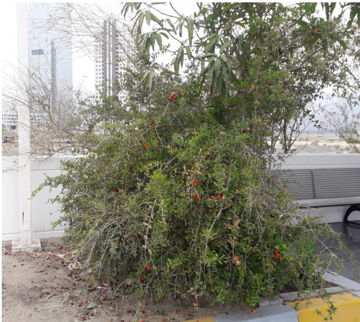
Рис. 8. Punica granatum в городских посадках в г. Фуджейра-Сити (ОАЭ).

приготавливают суррогат чайного напитка (Шипчинский, 1958).