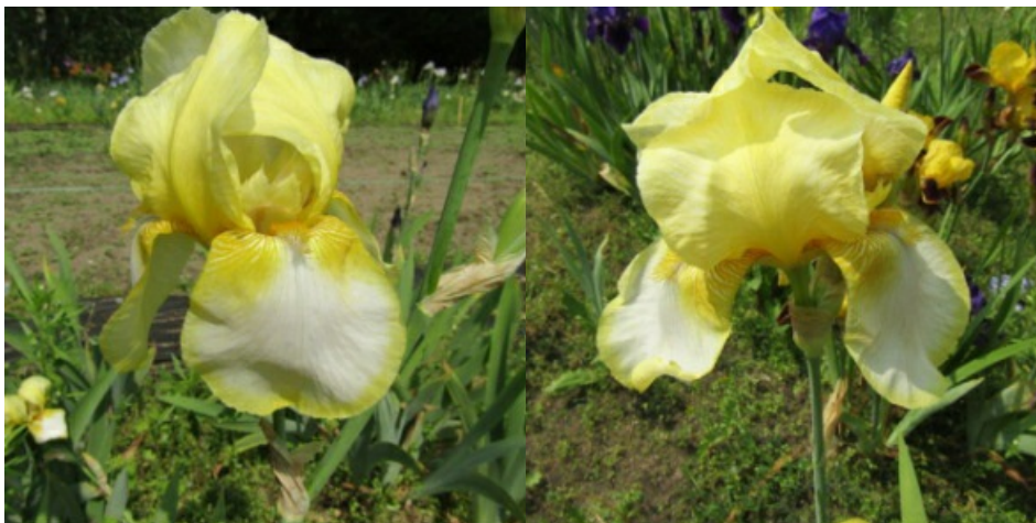
Рис. 23. 'Paper Moon'.

Внутренние доли ( 9,6\pm 0,5 x 6,0\pm 0,4 ) кремовые, сводчатые, наружные ( 9,8\pm 0,4 x 6,3\pm 0,5 ) – белые с неширокой ( 0,4-0,5 см) кремовой каймой по краю, полуопущенные. Основания белые с красно-коричневыми жилками, вдоль бородок охристо-желтые жилки на белом фоне, «плечи» охристо-желтые. Ветви столбика охристо-желтые, с белой центральной линией. Бородки желтые с синей подсветкой. Цветоносы 80-90 см высотой, с 5-6 цветками. Средний. Цветет с 10 -15.06 в течение 15-20 дней (ГБС им. Н.В. Цицина РАН, Москва, 1970).