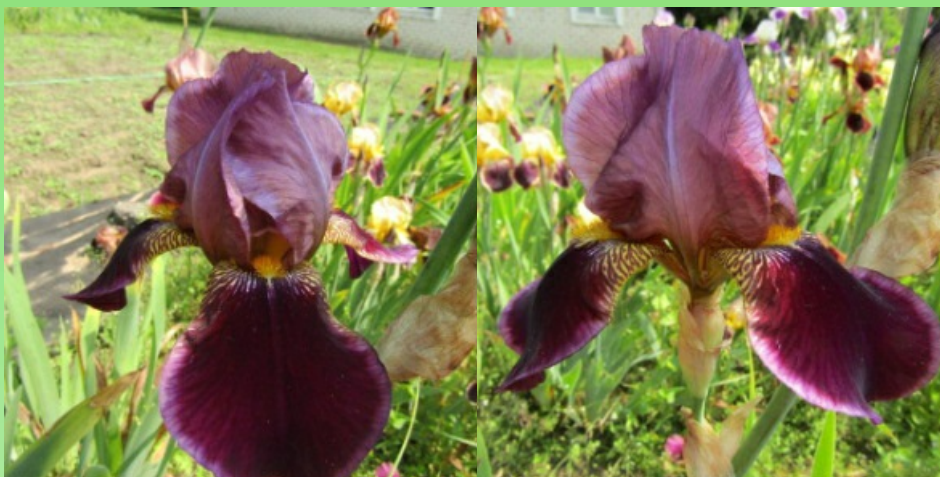
Рис. 17. 'Thorsten'.