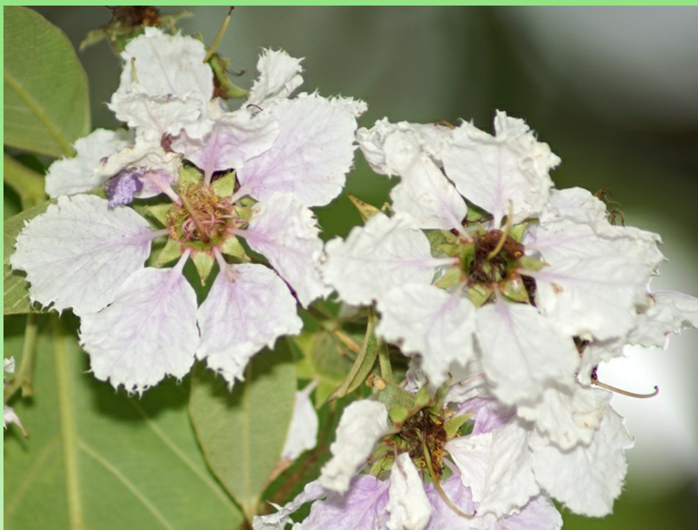
Рис. 4. Характерные бахромчатые цветки Lagerstroemia loudonii

по продаже растений ( https://www.greensouq.ae/product/664/lagerstroemia-loudonii ). В Фуджейре мы это дерево не встречали ни в питомниках, ни в публичных посадках, но предполагаем, что оно может быть встречено в частных садах около вилл, куда поступает из Дубая (от Фуджейра-сити до Дубая всего 1 час езды на автомобиле). Не является инвазивным видом.