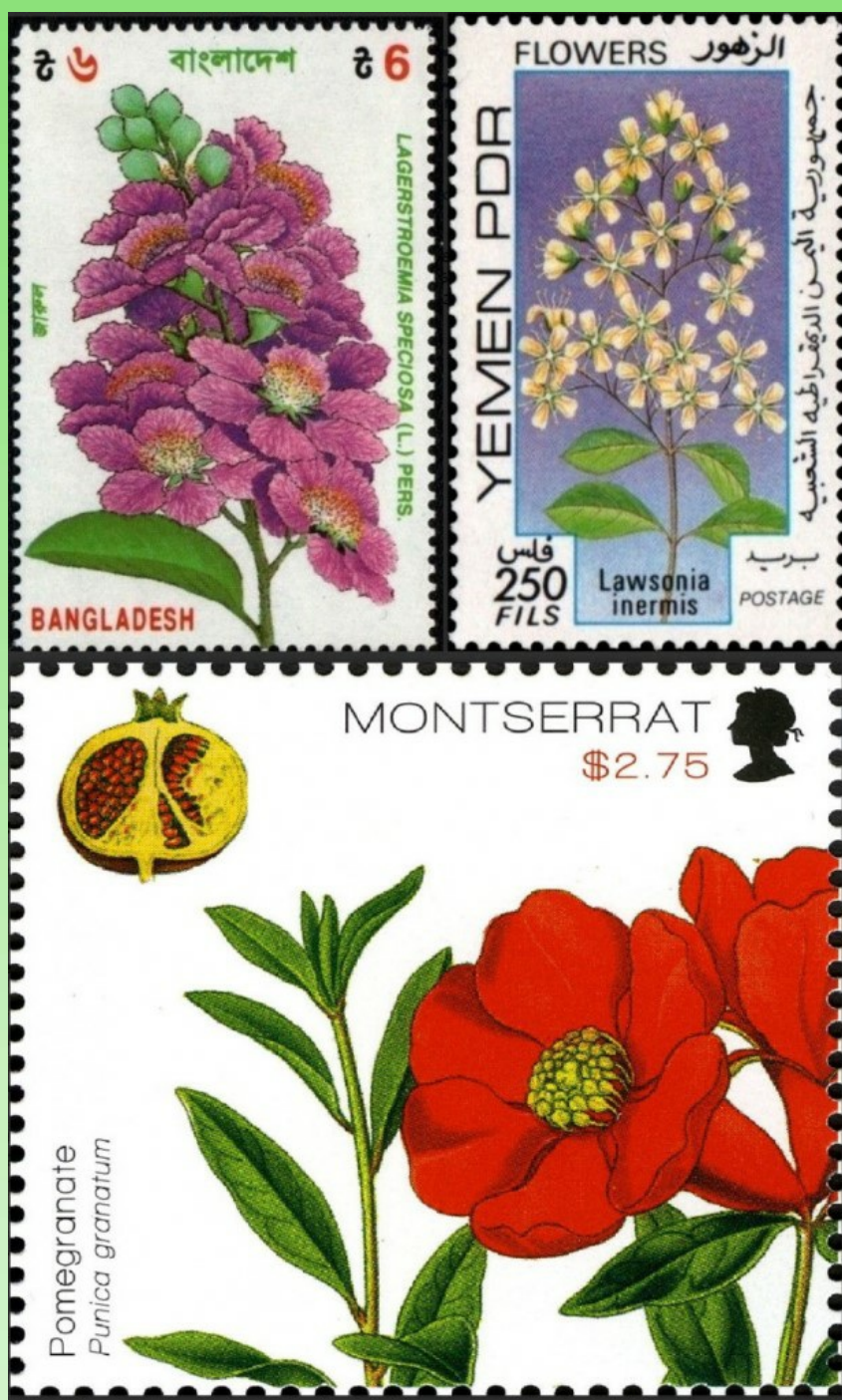
Рис. 6. Виды семейства Lythraceae на почтовых марках – Lagerstroemia speciosa , Lawsonia inermis и Punica granatum.