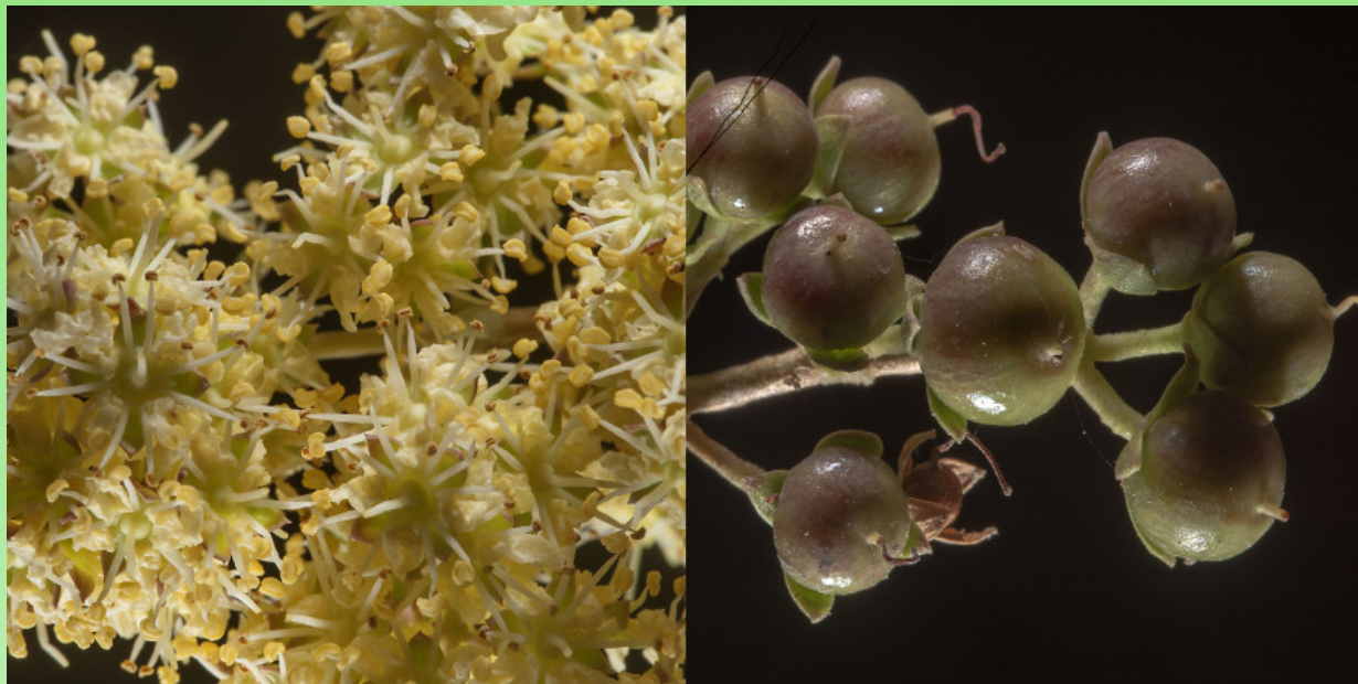
Рис. 7. Lawsonia inermis – цветы и плоды (коллаж сделан на основании фото Алексея Сергеева).

Важное красильное растение в Пакистане (Белуджистане) и Зап. Индии, известное с очень древних времен, используется для окраски волос, ногтей, подошв и ладоней, зубов, а также хвостов и грив лошадей, а в некоторых частях мира даже ослов. Краситель получают путем измельчения веток и молодых листьев и добавления горячей воды для образования пасты, которую наносят на окрашиваемую часть. Цветы имеют приятный стойкий запах и используются в качестве духов (Dar, 2025).