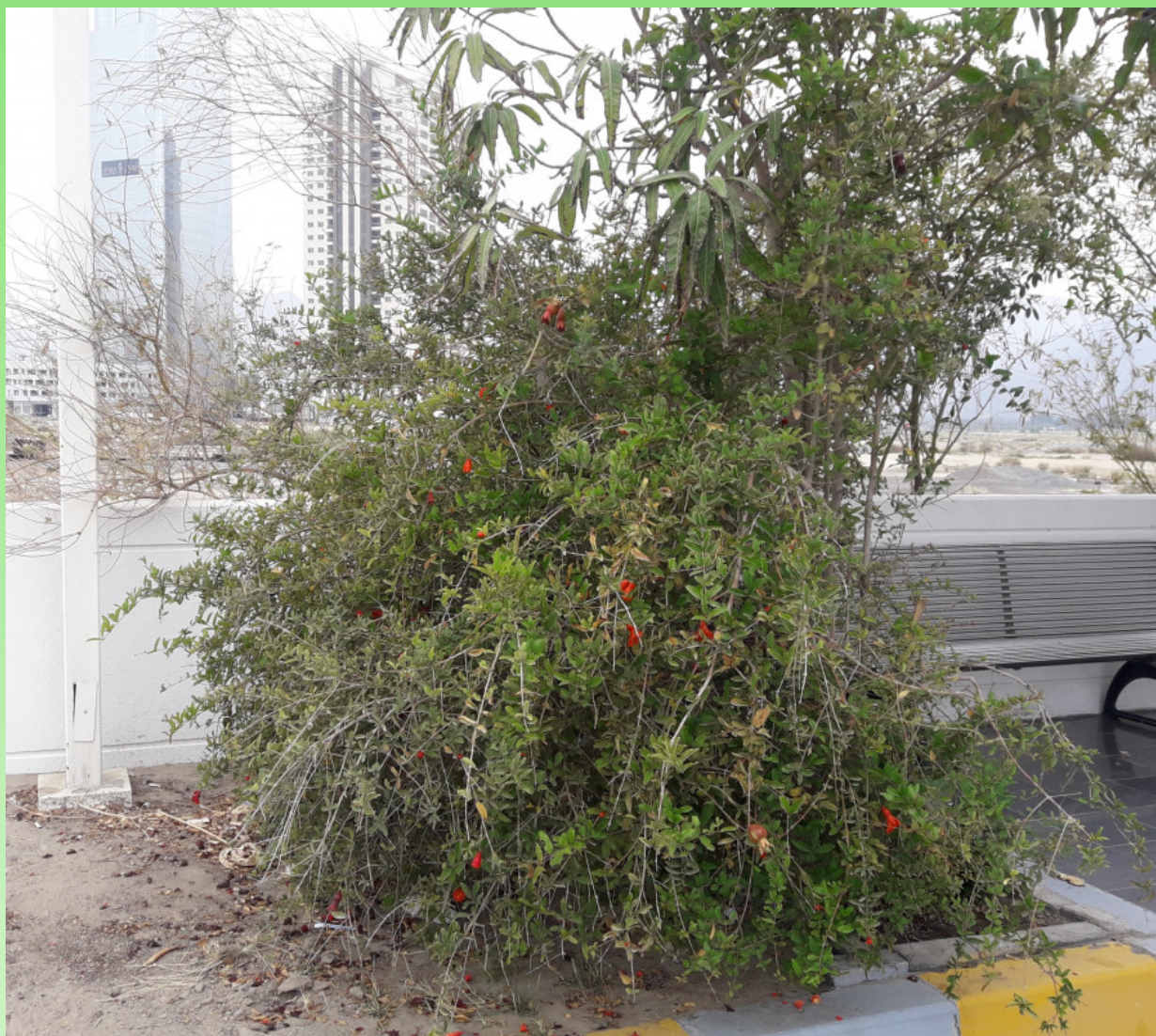
Рис. 8. Punica granatum в городских посадках в г. Фуджейра-Сити (ОАЭ).

приготавливают суррогат чайного напитка (Шипчинский, 1958).