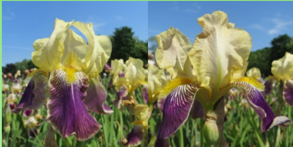
Рис. 15. 'Nibelungen'.

Цветоносы 80-85 см, с 3-4 цветками. Цветет с 1-8.06 в течение 11-15 дней (НБС им. Н. Гришко НАН Украины, Киев, 1956).