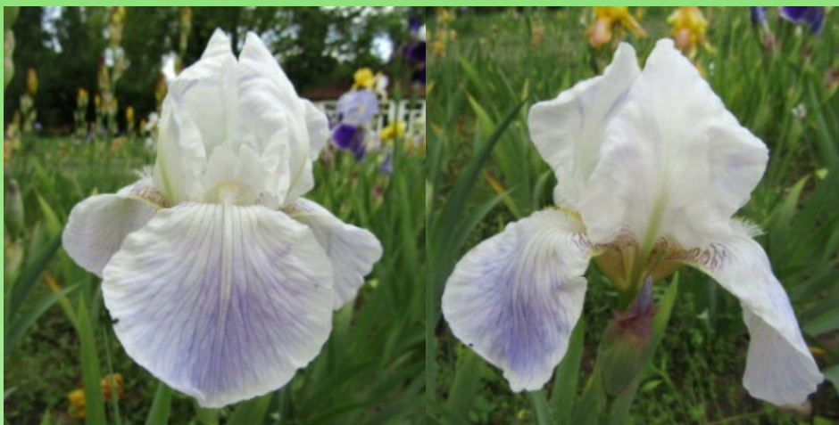
Рис. 13. 'Lenzschnee'.